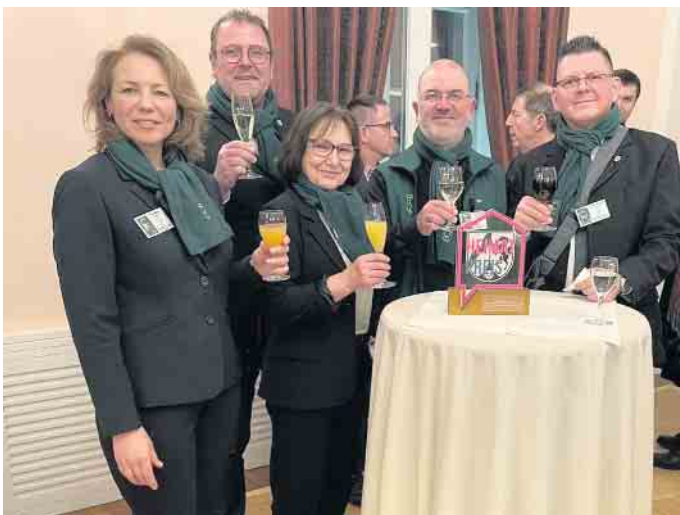
In Feierlaune: Der Vorstand der Waldfreunde nach der Preisverleihung

Duisdorf. Ihre Liebe zur Natur und zum Wald steckt schon in ihrem Namen. Und ihr Engagement für die Umwelt ist groß und vielfältig. Seit knapp 100 Jahren setzen sich die Duisdorfer Wald-