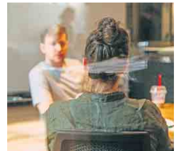
Dialog statt Monolog: Bei Vorstellungsgesprächen sollten auch Bewerber aktiv Fragen stellen.