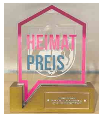
Begehrte Trophäe: der Heimatpreis des Landes NRW

Dieses vielfältige Engagement wurde nun mit einer renommierten Auszeichnung belohnt. Im