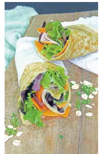
Für die gesunde Mittagspause sind Hafer-Wraps genau das Richtige.