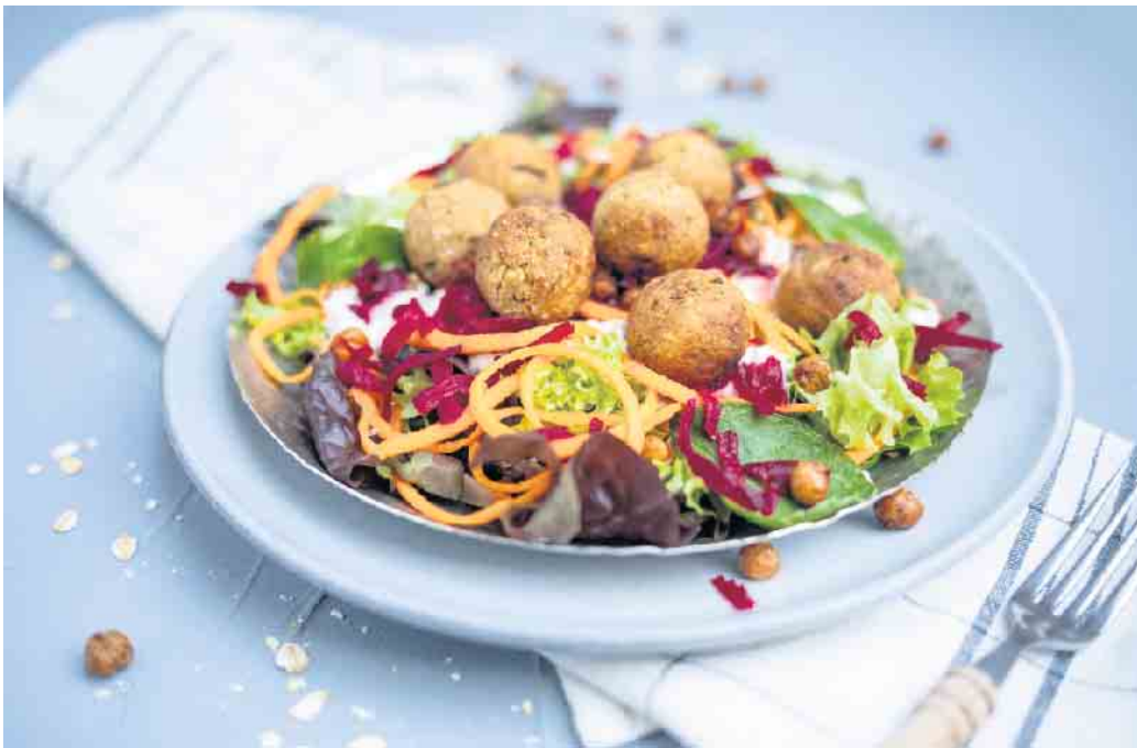
Hafermahlzeiten wie eine Salat-Bowl mit Haferbällchen lassen sich gut vorbereiten.

So gelingt eine gesunde Ernährung in Homeoffice und Büro