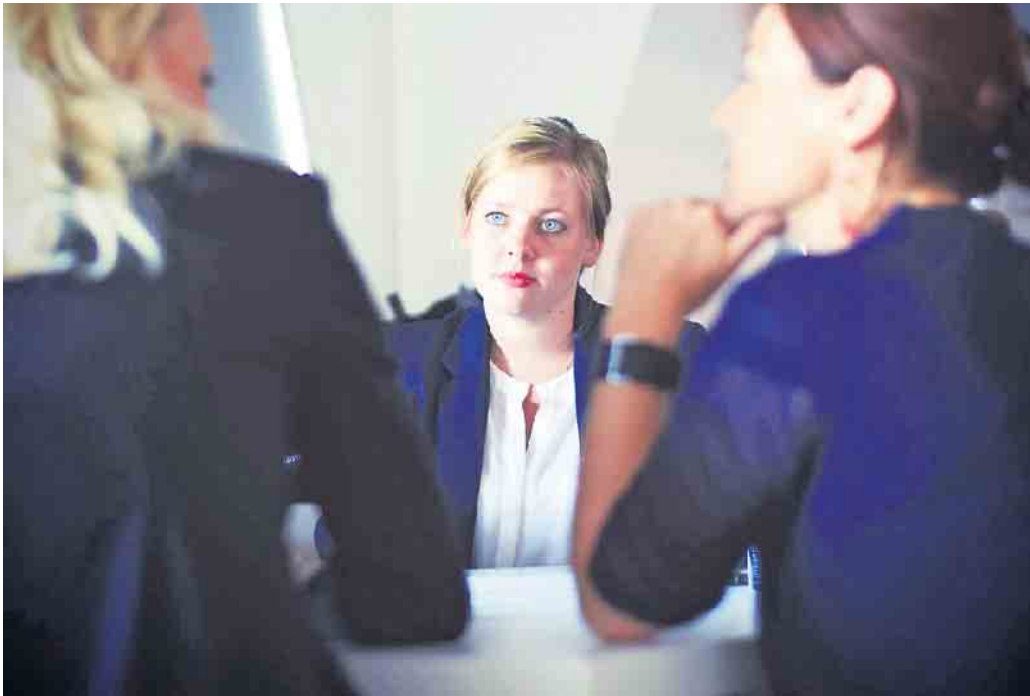
Mit gezielten Fragen können Bewerber im Vorstellungsgespräch ihr Interesse an einem Job untermauern.

So können Bewerber im Vorstellungsgespräch punkten