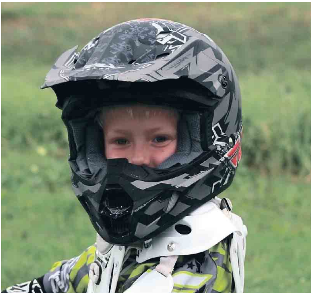
Wer leidenschaftlich gerne Motorrad fährt, steckt mit seiner Begeisterung oft auch den Nachwuchs an.

Kinder sicher auf dem Motorrad mitnehmen