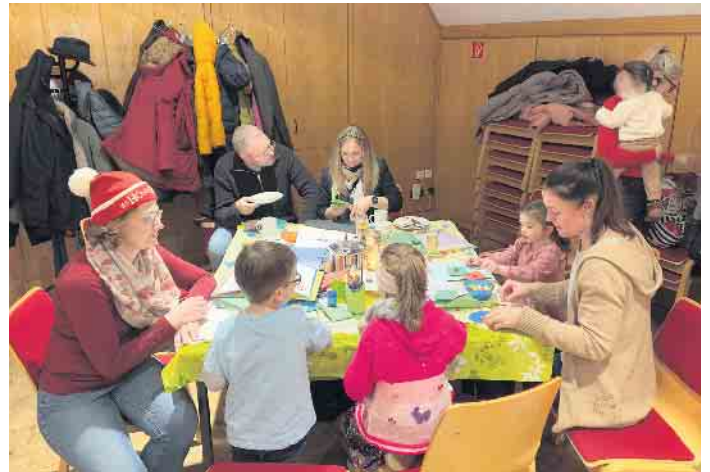
Basteln und Malen für die Jüngsten während der Weihnachtsfeier des Bonner CI-Treffs

Malen, Basteln, Kickern, Musizieren, Kulinarisches genießen - bei der gelungenen Weihnachtsfeier des Bonner CI-Treffs hatten die zahlreich erschienenen kleinen und großen Gäste einen kurzweiligen Nachmittag, bei dem die Zeit wie im Fluge verging.