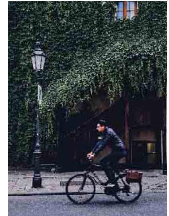
Volle Dröhnung: Auf keinen Fall darf man mit aufgesetzten Kopfhörern und hoher Lautstärke am Straßenverkehr teilnehmen.

Die Gesellschaft für Technische Überwachung (GTÜ) mahnt vor diesem Hintergrund zum eigenverantwortlichen und sicherheitsbewussten Umgang mit Kopfhörern im Straßenverkehr - dazu gehört die Wahl eines schalldurchlässigen Modells und eine nicht zu hohe Lautstärke. Dies gilt nicht nur am Steuer eines Autos, sondern für alle Verkehrsteilnehmer. Kritisch werden können Kopfhörer vor allem bei einem Unfall: Wer mit einge-