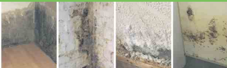
Defekte Horizontalsperre Querdurchfeuchtung Ausblühungen Schimmelbefall

Öffnungszeiten: Di.-Fr.: 9.00-18.00 Uhr Sa.: 8.00-14.00 Uhr