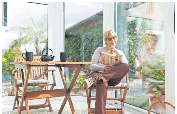
Der Lieblingsplatz ist immer da, wo das meiste Licht ist. Das ist einer der wichtigsten Gründe für die Beliebtheit eines Wintergartens.

zentrale Rolle nimmt dabei die Terrasse ein, für die eine gläserne Überdachung eine sinnvolle Ergänzung sein kann. Sie bietet wirkungsvollen Wetterschutz,