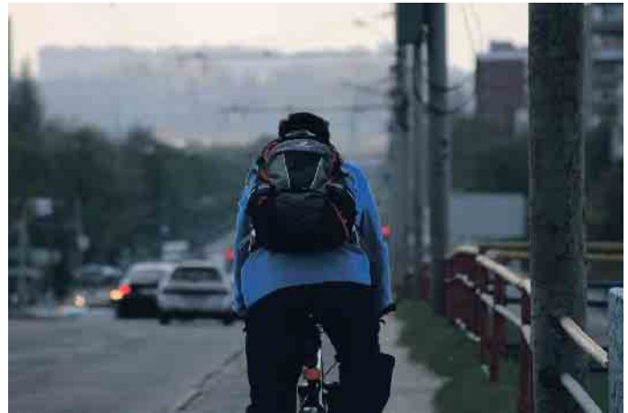
Zum Schutz aller Verkehrsteilnehmer bedarf es mehr gegenseitiger Rücksichtnahme.

Dooring-Unfälle verhindern können vor allem diejenigen, die die Autotür öffnen. Beim Aussteigen sollten sie grundsätzlich immer zuerst in den Seitenspiegel und dann über die Schulter schauen, bevor sie die Tür öffnen. Hier hilft der sogenannte Holländische Griff: Dabei wird die Fahrertür mit der rechten Hand geöffnet, der Oberkörper dreht so nach links und der Blick geht ganz automa-