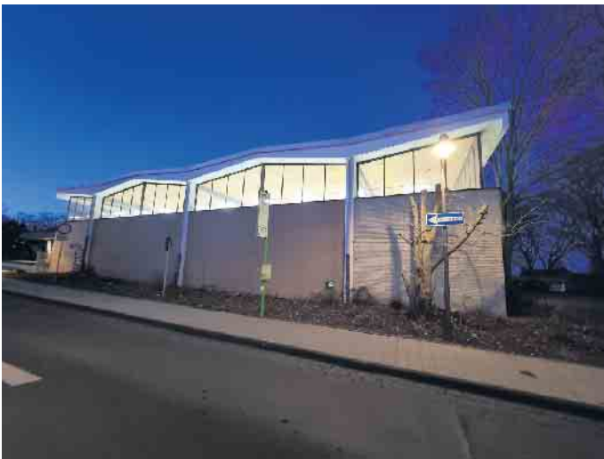
Die alte Turnhalle der Anna Schule.

Letzte Veranstaltung in der alten Turnhalle der Anna Schule