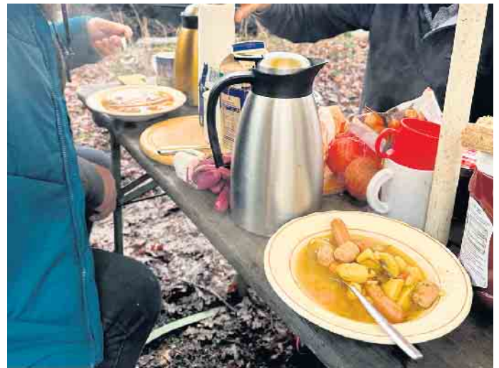
Suppe für die fleißigen Helfer.