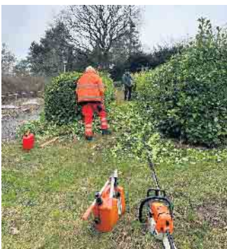
Fleißige Helfer bei der Arbeit.