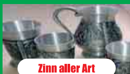
Zinn aller Art