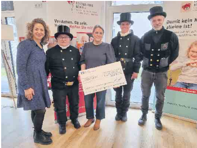
Glücksbringer überreichen Scheck.

Schornsteinfeger überreichen dem Förderkreis Bonn e.V. einen Scheck