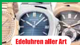
Edeluhren aller Art

Wir zahlen zur Zeit bis zu 150,- *pro Gramm für M-Schmuck