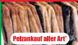
Pelzankauf aller Art*