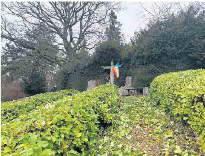
Der Friedensweg.