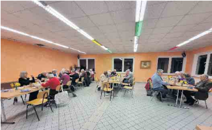
Heringssessen in der MZH.