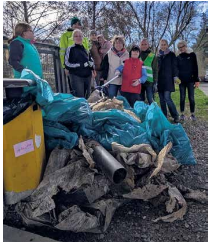
Groß und klein haben gemeinsam angepackt