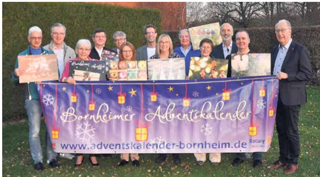
Repräsentanten der bedachten Organisationen und der Rotarier freuten sich über das super Ergebnis der Kalenderaktion 2025 und präsentierten Kalender der bisherigen zehn Jahre.

Aber auch die Käufer der Adventskalender konnten sich nicht beklagen, warteten auf sie doch 631 Gewinne