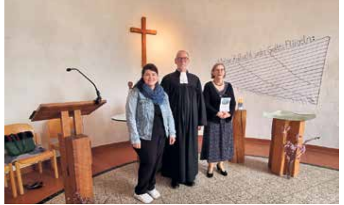
Leiteten den Gottesdienst zum Jubiläum.