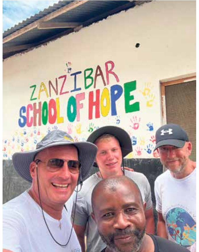
Der Verein Menschenfreude e.V. baut Schulen.

„Jeder Tropfen kann das Fass füllen. Ich habe gelernt, dass nicht jeder Euro einen Euro wert ist“, erklärt Perdeck. Die nächste Möglichkeit den Verein zu unterstützen, bietet sich am 7. April ab 18 Uhr in der freien evangelischen Gemeinde Bonn, Hatschiergasse 19, 53111 Bonn bei der Osterfeier MahlZEIT. Dort lädt der Verein zu einem Osteressen ein. (SAPIR)