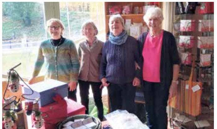
Eine-Welt-Gruppe im Evangelischen Gemeindezentrum.