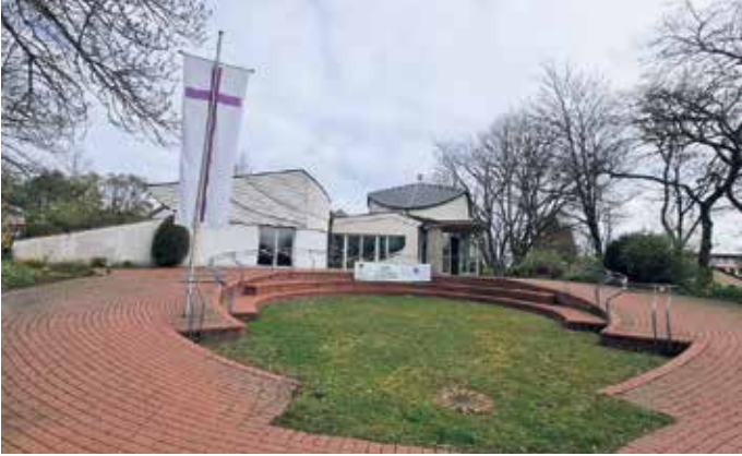
Das Evangelische Gemeindehaus am Herrenwingert.

30 Jahre Kirche am Herrenwingert und 25 Jahre Eine-Welt-Gruppe