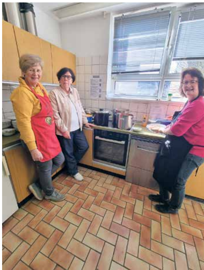
Die drei Köchinnen.

Der gemeinnützige Verein aus Bonn unterstützt Mädchen und junge Frauen in der kolumbianischen Krisenregion Chocó. Dies ist die ärmste Region Kolumbiens. Das Ziel von CASA HOGAR ist: Mädchen und Frauen ein selbstbestimmtes Leben zu ermöglichen. Dafür werden in enger Zusammenarbeit mit lokalen Partnerorganisationen Schutzräume geschaffen. Den Mädchen und Frau-