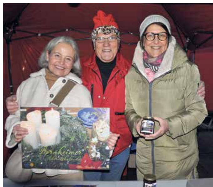
Ausverkauft. Die letzten Kalenderexemplare konnten die Rotarier bei der 3. Advents-Charity auf dem Peter-Fryns-Platz an ihrem Aktionsstand verkaufen.