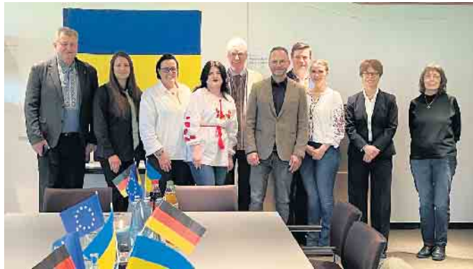
Die Bürgermeister Sergii Kasian (l.) und Rolf Schumacher (5.v.l.) unterzeichnen Solidaritätspartnerschaft im Alfterer Rathaus.

Im Auftrag des Bundesministeriums für wirtschaftliche Zusammenarbeit und Entwicklung (BWZ) unterstützt die Servicestelle Kommunen in der Einen Welt (SKEW) im Rahmen des Projektes „Kommunale Partnerschaften mit der Ukraine“. Die SKEW berät seit dem Angriffskrieg Russlands gegen die Ukraine im Februar 2022 deut-