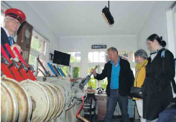
Hier ist Muskelkraft gefragt. Ein Stellwerk zum Anfassen

Technik aus den 1960er Jahren hautnah zum Anfassen