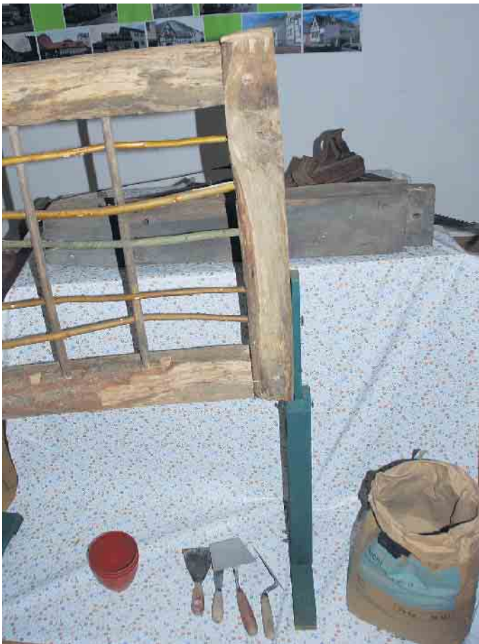
Die Bastel-Ecke. Das Gefach aus einem abgebrochenen Haus am Görreshof steht für jedermann bereit

Fachwerkhäuser gehörten zu dem typischen Baustil des Vorgebirges. Die Ausstellung beschäftigt sich mit 15 der 65 verbliebenen Fachwerkhäuser in Alfter Ort. Dabei werden die typischen Merkmale der Bauten und ihre Besonder-