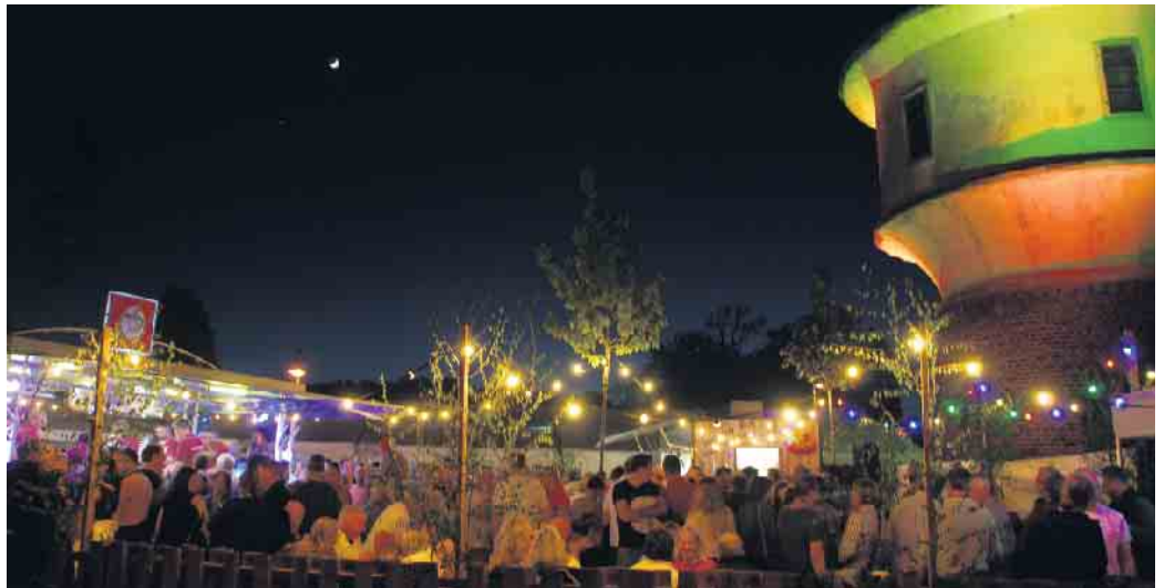
Rund um den Wasserturm in Gielsdorf