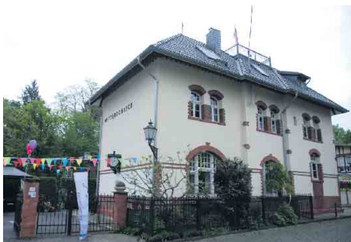
Die Technik aus den 1960er Jahren im Bahnhof Witterschlick

www.regio-pressevertrieb.de REGIO pünktlich • zielgerichtet • lokal PRESSE VERTRIEB GmbH Die Zeitungszustellgesellschaft der RAUTENBERG MEDIA KG