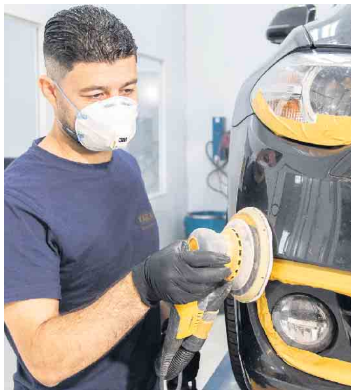
Die Reparaturkosten am Fahrzeug des Geschädigten übernimmt die Kfz-Haftpflichtversicherung des Unfallverursachers.

ner DEVK-Partnerwerkstatt im sogenannten Smart-Repair-Verfahren beheben lassen. Das kostet pauschal 50 Euro - ohne Hochstufung in der Schadenfreiheitsklasse. Unter www.devk.de/auto kann man sich über die Leistungen der Kfz-Versicherung informieren. Bis zum 30. November können viele ihre Police kündigen und zum neuen Jahr zu einem anderen Anbieter wechseln.(DJD)