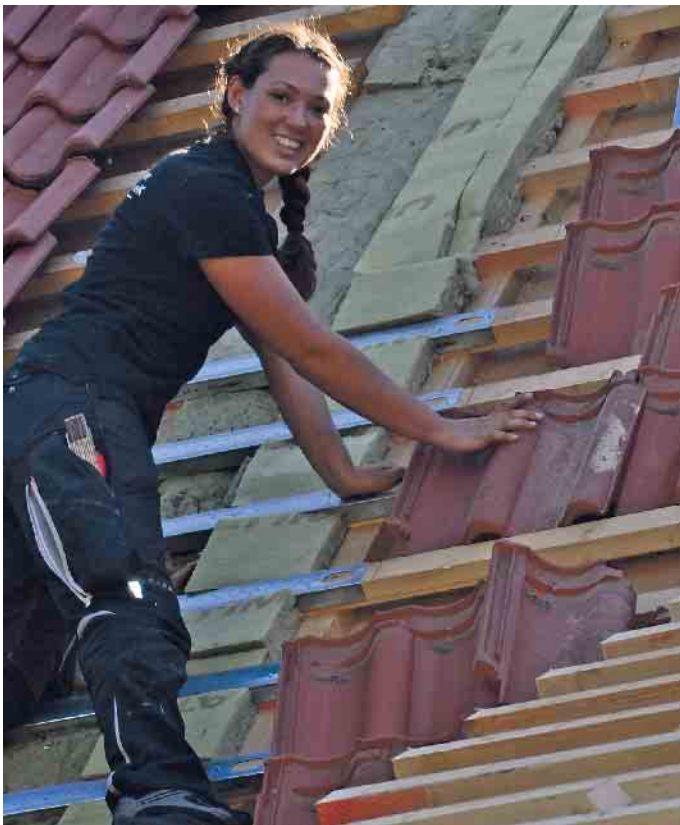
Dachdeckerinnen sind auf dem Vormarsch: schweres Tragen ist out, das übernehmen Lastenaufzüge.