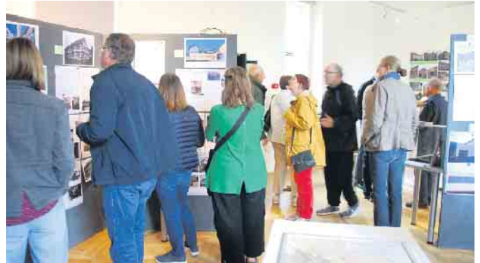
Das Interesse war groß

heiten herausgestellt. Es wird die teils 300 Jährige Geschichte der Häuser aber auch das Leben der Familien, die in diesen Häusern leben, erzählt. Des Weiteren zeigt die Ausstellung die Möglichkeiten auf, wie diese alten Gebäude behutsam saniert werden können, sodass sie den heutigen Ansprüchen an das Wohnen entsprechen, ohne ihren Charakter zu zerstören. Was sind Schwelle, Ständer, Riegel und Rähm? Wie werden die Hölzer miteinander verbunden, ohne Eisenwinkel oder Ähn-