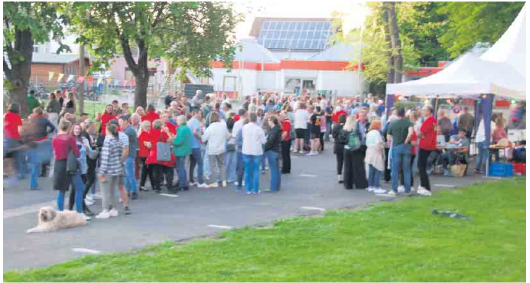
Der Dorfplatz in Volmershoven

Rund um den historischen Wasserturm wurde in Gielsdorf gefeiert. Der Maibaum wurde durch die Junggesellen aufgestellt und anschließend folgte die Krönung des Maipaares. Im Festzelt und im Biergarten wurde dann in den Mai gefeiert. (SPI)