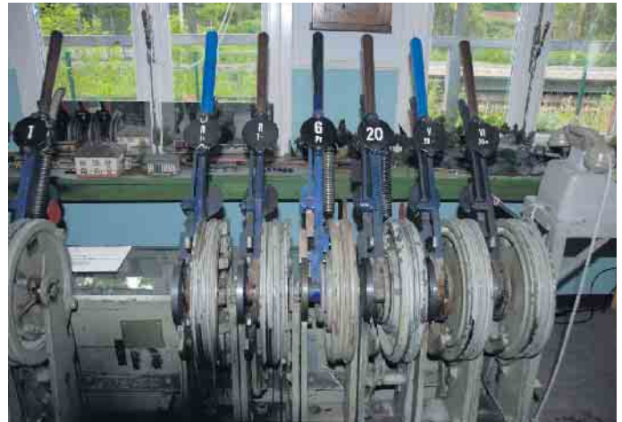
Voll funktionstüchtig. Heute wird die Modelleisenbahn damit gesteuert

Wer wollte konnte auch noch einen Blick in die Schalterhalle und das Trauzimmer werfen. Für das laibliche Wohl war mit Kaffee und Kuchen sowie mit Reibekuchen bestens gesorgt. Am Andenkenstand gab es die Möglichkeit Eisenbahnartikel käuflich zu erwerben und am Schalter konnten alte Pappfahr-