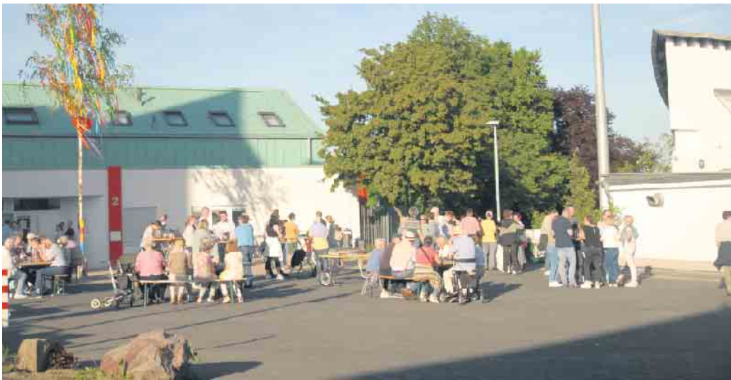
Maiansingen wie anno dazumal in Impekoven

Maiansingen wie anno dazumal oder mit großem Festzelt - Auf den Dorfplätzen war für Jeden etwas dabei