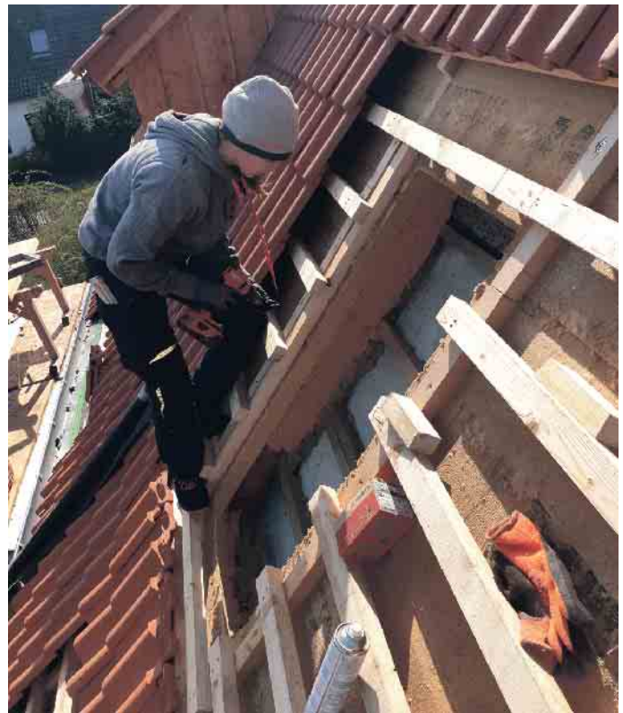
Höhentauglich, handwerkliches Geschick, mathematisches Grundverständnis und gerne teamfähig: das sind die wichtigsten Dachdeckereigenschaften - geschlechtsunabhängig.

eine Ausbildung im Handwerk startet, hat viele Möglichkeiten, morgen Karriere zu machen. Nach einer dreijährigen Ausbildung - die auch verkürzt werden kann - gibt es Weiterbildungen zum Vorarbeiter, Baustellenleiter, Energieberater bis hin zum Dachdeckermeister, um beispielsweise einen eigenen Betrieb zu führen. Aktuell sind besonders die Fortbildungen zum PV- oder Gründach-Manager im Dachdeckerhandwerk gefragt.