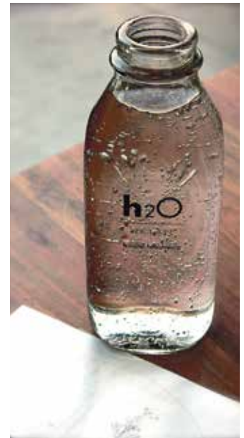
Es ist sinnvoll, eine individuelle Trinkroutine zu entwickeln.