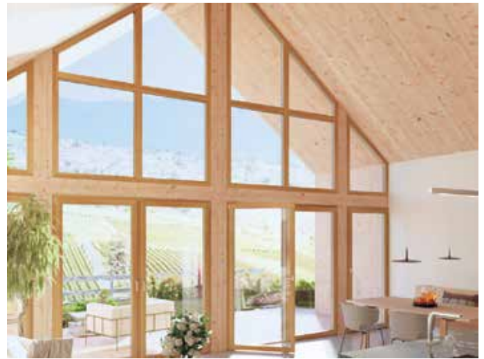
Bei großen Fensterfronten ist der Energiespar-Effekt von gut gedämmten Fenstern besonders groß.

Besonders Fenster mit Einfachverglasung, die bis Ende der 1970er Jahre eingebaut wurden, bieten sich für einen Tausch an. Im Gegensatz zu modernen Zwei- oder Dreifachverglasungen bieten sie keinerlei Wärmedämmung. Aber auch ältere Isolierverglasfenster (vor 1995, also noch ohne Wärmeschutzbeschichtung) lassen noch immer viel Wärme entweichen. Auch sie sind gute Kandidaten für eine Sanierung. „Wer noch einen dieser Fenstertypen verbaut hat, sollte unbedingt über eine Modernisierung nachdenken. Das gilt insbesondere, weil die Bundesregierung bei Einzelmaßnahmen wie der Fenster-Sanierung mit der BEG-Förderung weiterhin bis zu 20 Prozent der Investitionskosten übernimmt.“, rät Frank Lange, VFF-Geschäftsführer. Alternativ kann im selbstgenutzten Wohnraum im