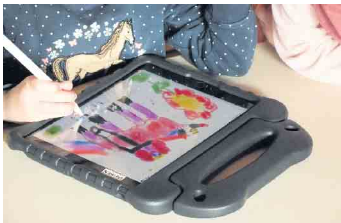
Der gesunde Umgang mit den digitalen Medien will gelernt sein: Weg vom passiven Film- und Videoschauen, hin zu einer aktiven und pädagogisch wertvollen Nutzung.

Obwohl laut der MiniKim Studie 2020, Kita Kinder noch immer das klassische Spiel draußen oder mit Spielzeug bevorzugen, ist es wichtig, einen gesunden Umgang mit Medien zu lernen und diese aktiv in den Alltag einzubringen. Deshalb ist es ein wichtiges Ziel