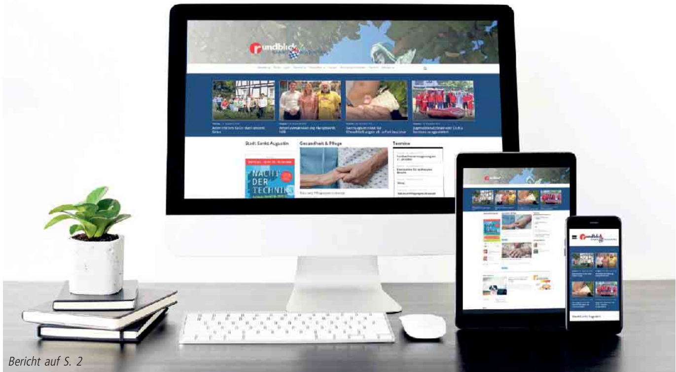
Bericht auf S. 2