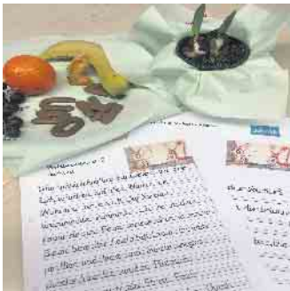
Obst und Kekse nahmen den Schülerinnen und Schülern die Nervosität

Schon lange hatten sich die Schülerinnen und Schüler der Gutenbergschule auf ihren Lesewettbewerb gefreut, sie hatten viel geübt und waren gut vorbereitet. Doch zwei Tage vor dem Wettbewerb brach der Winter mit voller Wucht über unsere Region herein, 20 Zentimeter Neuschnee legten die Straßen lahm, und das Schulministerium und gewährte zwei freie Schultage. Das Planungsteam zeigte sich aber flexibel und verschob den Lesewettbewerb um eine Woche.