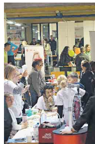
Krankenpflege zum Anfassen auf dem Stand der ASKLEPIOS Kinderklinik.

images/pdf/JobgoalsKompakt_2024_Homepage.pdf