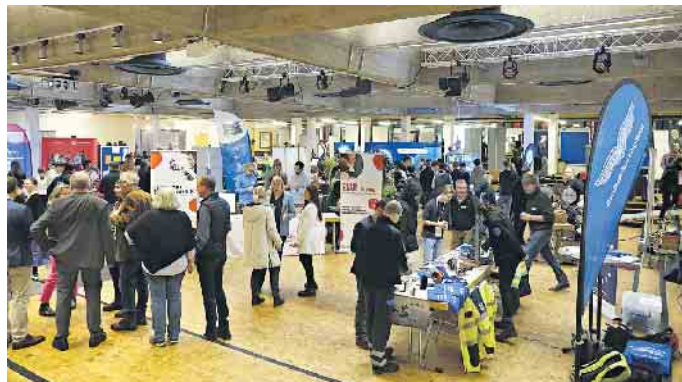
Gut besucht. Alles sechs weiterführenden Schulen der Stadt besuchen die Ausbildungsmesse zeitlich koordiniert.

abgestimmt. Zumindest optisch groß war das Interesse an den Berufen zur Gesundheitsversorgung und Pflege, was vielleicht auch an der praxisorientierten, zum Anfassen auffordernden Präsentation mit Dummies vom Säugling bis zur bettlägerigen Patientin und den entsprechenden Hilfsmitteln zur Krankenversorgung lag. Auch andere Stände mit handwerklichen Inhalten und Objekten zum Ausprobieren waren umlagert. Naturgemäß schwieriger gestalteten sich Kontaktgespräche über Verwaltungs- und kaufmännische Berufe vom Archivar, über die Steuerberatung und IT-Dienstleistung bis zum Versicherungskaufmann. Doch auch diese fanden für beide Seiten zufriedenstellend statt. Die Veranstalter, die Stadt Sankt Augustin und die Wirtschaftsförderungsgesellschaft (WFG) Sankt Augustin haben die Ausbildungs-