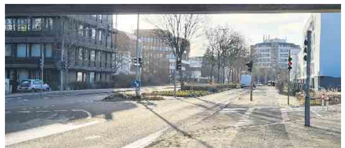
Blick auf die Rathausallee.

hausallee zwischen dem Kreisverkehr vor der Ost-West-Spange und der Zufahrt zum Rathaus (Mewasseret-Zion-Brücke) für den Bau zweier neuer Haltestellen vor dem Rathaus voll gesperrt. Der Verkehr wird für die Zeit der Baumaßnahme umgeleitet. Die Umweg-