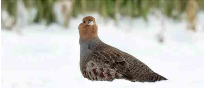
Rebhuhn in einem Schneefeld der Grünen Mitte.