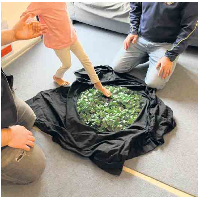
Mutig! - Ein Kind traut sich über Scherben zu gehen.