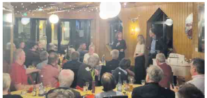
Politisches Fischessen der SPD in Hangelar