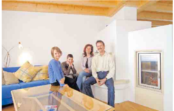
Wohlfühlklima fürs Familienheim: Der Traditionswerkstoff Lehmputz lässt sich als Trockenbausystem spielend leicht verarbeiten.

stoffe. Die Luft wird ionisiert und wirkt dadurch spürbar frischer. Allergiker fühlen sich wohler und die Gefahr der Ansteckung über Tröpfcheninfektionen sinkt. Nachhaltig und ökologisch ist Lehm ebenfalls, denn die Herstellung verbraucht extrem wenig Primärenergie. Materialreste oder rückgebauter Lehmprodukte können problemlos über Bauschutt oder Hausmüll entsorgt werden.