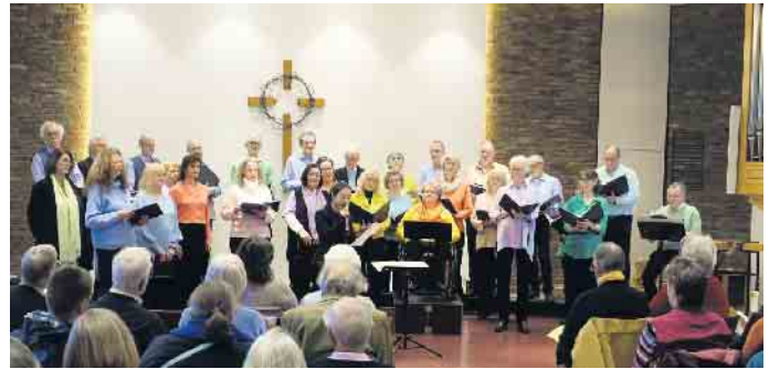
Die Chöre Bon Canto und La Voce während ihrem Konzert in der Emmaus-Kirche in Menden.