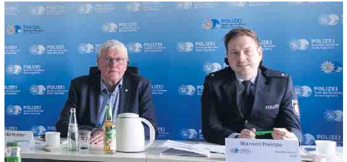
Landrat Sebastian Schuster und Polizeirat Manuel Heinze bei der Vorstellung der Verkehrsunfallbilanz 2024.

Servicekraft mlwld Spielhalle VZ in Menden gesucht. IDEAL FÜR RENTNER! Keine Berufserfahrung nötig. Bewerbungen telefonisch an Roco Spielautomaten GmbH & Co. K TEL: 02405 87011