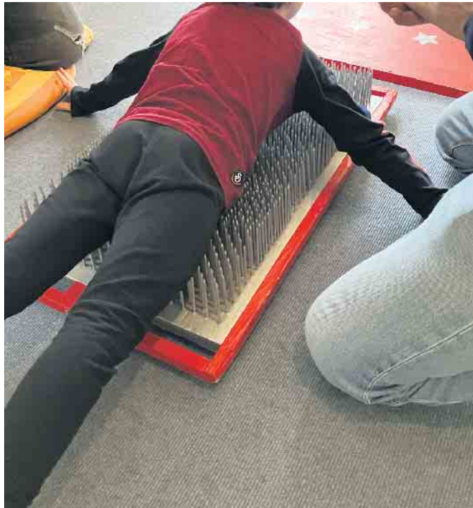
Wie liegt es sich auf einem Nagelbrett?

Zum Abschluss der Zirkuswoche waren alle Familien eingeladen an einem Nachmittag zu erleben, was die Kinder in der Woche ausprobiert und erlernt hatten. Ebenso konnten sie selbst aktiv werden und erfahren, wie es ist über Scherben zu laufen oder sich auf das Nagelbrett des Fakirs zu legen. Natürlich durfte die Zirkuscafeteria mit selbstgebackenem Kuchen und Popcorn nicht fehlen. Das Fazit dieser Woche von allen Kindern, dem Kita-Team und Familien war „das war super.“