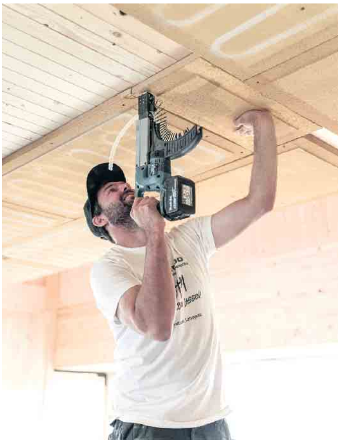
Trockenbau-Lehmputzplatten lassen sich einfach verschrauben oder verkleben. Das aufwendige Anmischen und manuelle Aufbringen des Putzes auf Wand- oder Deckenflächen kann man sich so ersparen.