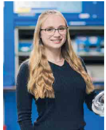
Kaufleute für Groß- und Außenhandelsmanagement sorgen für einen reibungslosen Warenfluss.

Kaufleute für E-Commerce betreuen Onlineshops, entwickeln Marketingmaßnahmen, analysieren