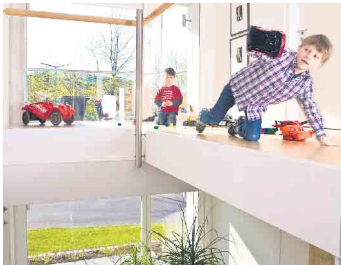
Eine gläserne Balustrade gibt dem Haus ein Gefühl der Leichtigkeit und holt viel Tageslicht in den Eingangsbereich.

Eine offene, lichtdurchflutete Atmosphäre fördert das Wohlfühlen. Mit Glas wirkt jeder Raum nicht nur heller und freundlicher, sondern wird gleichzeitig optisch vergrößert. Ein Vorteil des Materials: Fachbetriebe können Trennwände,