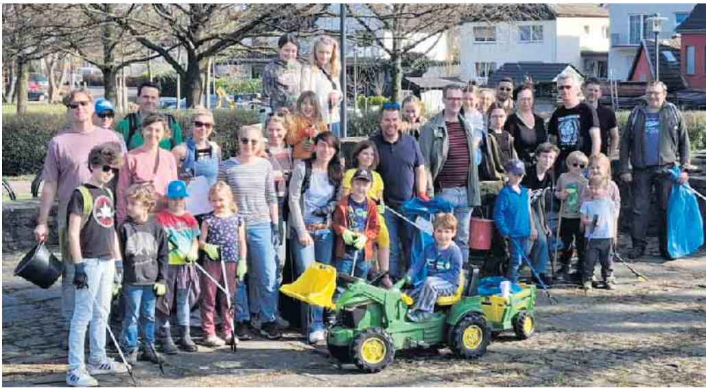
Alle Hände voll zu tun hatte „Menden Clean Up“ beim Frühjahrsputz in Sankt Augustin-Menden.

Frühjahrsputz-Aktion der Initiative Menden Clean Up wieder sehr erfolgreich