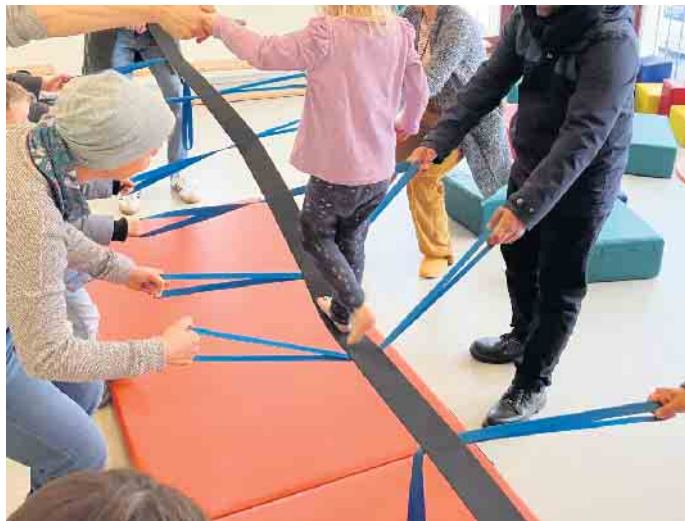
Viele helfen beim Gang über die Slackline.