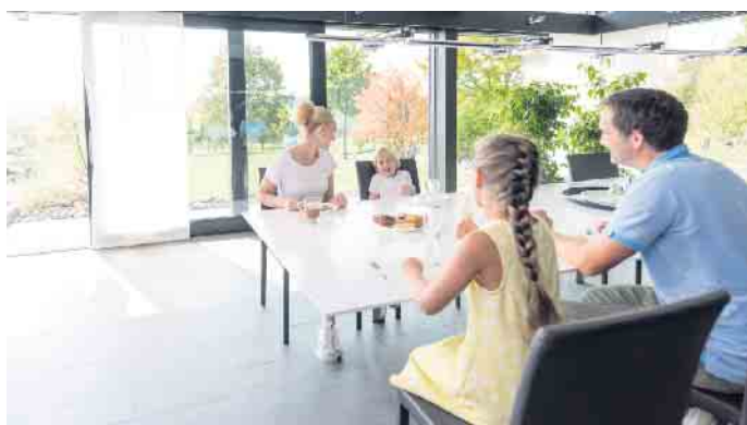
Wohnen mit Durchblick: Glas ist aus der modernen Architektur nicht wegzudenken - auch als Gestaltungsmittel im Innenausbau.

Schiebeelemente oder Treppen ganz nach eigenen Wünschen planen und bauen. Eine Galerie zum Beispiel erhält mit einem Glasgeländer und durchsichtigen Brüstungen ein besonders elegantes Erscheinungsbild. „Transparente Treppen scheinen förmlich im Raum zu schweben. Auch eine glä-