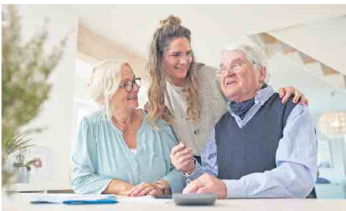
Eine Eigentumswohnung für die Kinder kaufen: Dieses Finanzierungsmodell ist bei Immobilienbesitzern und Banken gleichermaßen beliebt.

Ferienwohnimmobilien sind nicht zuletzt durch die coronabedingten Einschränkungen stark gefragt. Die Aussicht, im Urlaub selbst dort zu wohnen und das Domizil für das übrige Jahr zu vermieten, ist verlockend. Was so einfach klingt, sehen Banken aber oft anders. Denn die Auslastung ist schwer kalkulierbar und bei Eigennutzung gelten steuerliche Sonderregeln. Wer über ein Investment in eine Ferienwohnung nachdenkt, sollte sich einen Überblick über Finanzierungslösungen verschaffen oder sie von einem ungebundenen Vermittler vergleichen lassen. Zum Beispiel unter www.drklein.de gibt es weitere nützliche Tipps rund um die Finanzierung von Zweitimmobilien und eine Kontaktmöglichkeit. (djd)