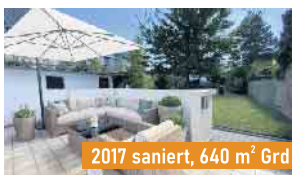
2017 saniert, 640 m 2 Grd

SANKT AUGUSTIN Einfamilienhaus, BJ 1956 ca. 125 m 2 Wohnfläche EA-B: G, 205,9 kWh, Gas