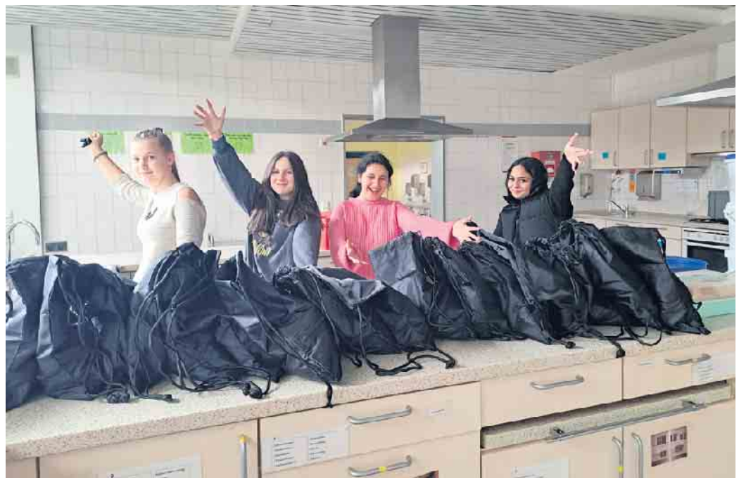
Mitglieder vom Jugendforum mit den „Begegnungsrucksäcken“.

„Du gehörst dazu!“ lautete das Motto einer Aktion des Jugendforums „8sam! - gegen Rassismus“. Das Jugendforum ist im Bundesprogramm „Demokratie leben!“ ein zentrales Merkmal für die Beteiligung von Kindern und Jugendlichen. Jugendliche aus dem städtischen Jugendforum „8sam! - gegen Rassismus“ entwickelten die Idee, Bedürftige zu unterstützen und konnten mit ihrer Aktion Ende März im Rahmen der Internationalen Wochen gegen Rassismus Impulse geben für ein besseres Miteinander, für Respekt, Gleichbehandlung und Toleranz. Sie verteilten gepackte, wiederverwendbare „Begegnungsrucksäcke“ an 20 Personen, die in einer Unterkunft in Sankt Augustin wohnen. Die Jugendlichen kamen mit den Menschen ins Gespräch und tauschten sich aus. Direkt im Anschluss an diese Begegnungen