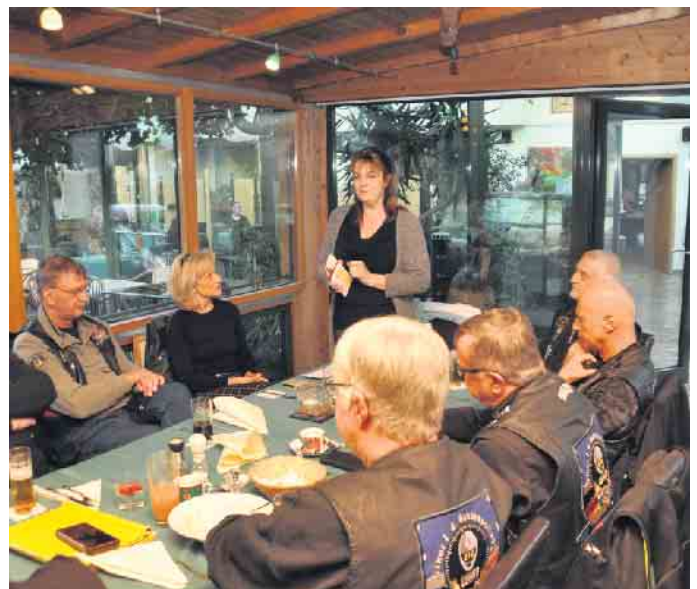
Vorstellung der Bedarfe im Frauenhaus bei den BiB St. Augustin