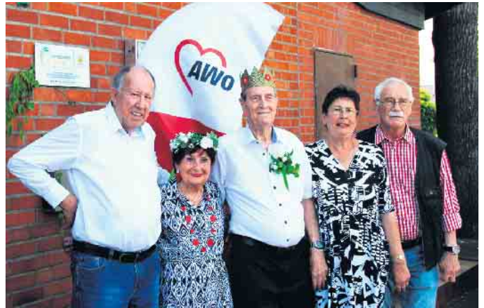
Das AWO-Maipaar 2024

beklatschten ihren Ehrentanz. Es war ein Genuss, zuzuschauen und die anderen Teilnehmer ließen es sich nicht nehmen, mit dem Maipaar auf der Tanzfläche die Hüften zu schwingen. Jeden Donnerstag wird bei der AWO Niederpleis im Schützenhaus von 14 bis 17.30 Uhr getanzt. Zu Beginn wird sich bei Kaffee und Kuchen gestärkt und dann kann das Tanzbein zu der Musik vom DJ Hans-Georg geschwungen. Wer es etwas ruhiger mag, der ist im Niederpleiser Schützenhaus mittwochs beim gemeinsamen Spiel, Gesang und Gesprächen gut aufgehoben. (ot)