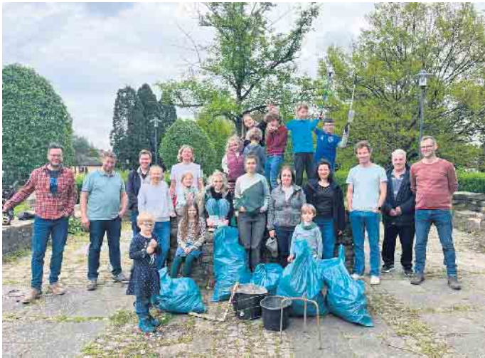
Aktiv für ein sauberes Menden: die Initiative Menden Clean UP mit dem Ergebnis ihrer zweiten Müllsammelaktion.

Es war wieder Zeit für eine Menge „Trash-Talk“ in Menden - aber nicht auf die übliche Weise! Am Sonntag, 28. April, schlossen sich mehr als 30 heldenhafte Freiwillige zusammen, um ihren Stadtteil von Müll zu befreien. Ausgestattet mit Greifzangen, Handschuhen und einer gesunden Portion Engagement, begaben sie sich auf die Mission, die Straßen von achtlos weggeworfenem Müll zu säubern.