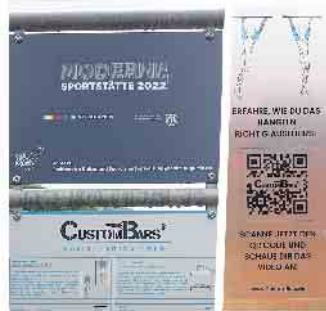
An den Geräten sind QR-Codes zum Abrufen von Beispielvideos zur Nutzung der Sportgeräte angebracht.

Quartierssozialarbeit und der mobilen Jugendarbeit öffentliche und kostenlose Einführungs- oder Schnupperkurse zur Nutzung der Sportgeräte und kostenlose Sportaktionen speziell für junge Menschen im Quartier.