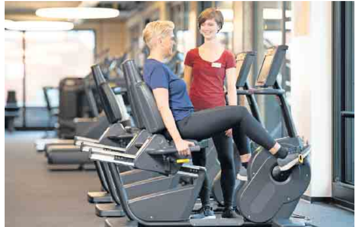
In der Zeit der Pandemie ist die Bedeutung von Fitness- und Gesundheitsanlagen im Bewusstsein von Gesellschaft und Politik gewachsen.