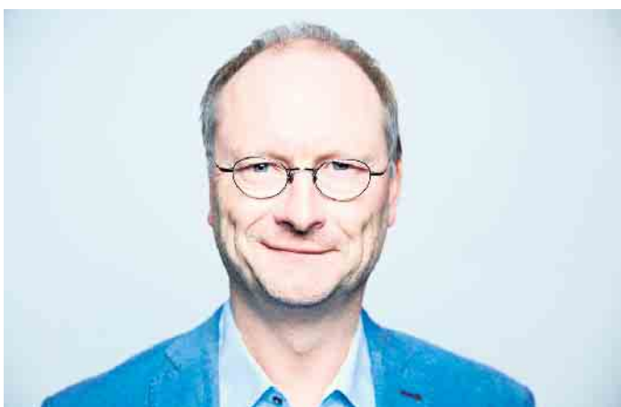
„Zieht euch warm an, es wird heiß“ - Vortrag von Sven Plöger (Diplom-Meteorologe, Buchautor und Fernsehmoderator).

Vortrag von Sven Plöger im Rahmen der Woche der Nachhaltigkeit