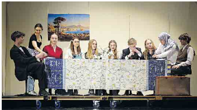
Die Mafia-Familie Spadera an der großen Tafel beim Mittagessen. La familia ist alles.

Das neue Musical des RSG taucht in die amerikanische Mafia ein