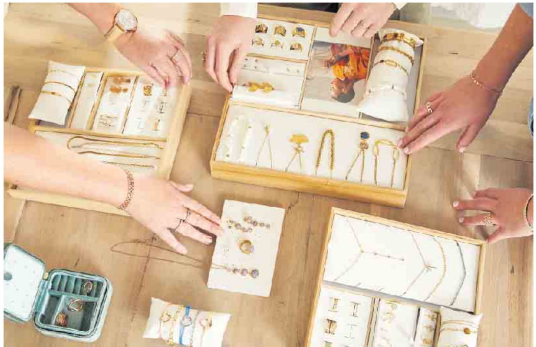
Die komplette Schmuckkollektion wird der Stylistin vom Auftraggeber kostenlos zur Verfügung gestellt.

Als Freiberuflerin ist man nicht in einer Firma angestellt, sondern arbeitet selbstständig auf eigene Rechnung. Für jedes verkaufte Schmuckstück erhält man daher eine Provision. Unter www.victoria-schmuck.de ist eine Infobroschüre zum kostenlosen Download bereitgestellt. Es ist möglich, eine Freiberuflichkeit in Vollzeit auszuüben oder auch als Nebenerwerb, als Zusatz zur bisherigen Haupttätigkeit. Wichtig ist, dass man einem zukünftigen Auftraggeber niemals selbst Geld zahlt, um für ihn arbeiten zu dürfen. Seriöse Unternehmen stellen ihre Stylistinnen mit allem aus, was sie für die Ausführung ihres Jobs benötigen. Zudem sollte er eine gründliche Einarbeitung garantieren. (DJD)