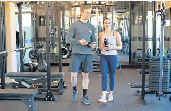
Fitness- und Gesundheitsanlagen etablieren sich zunehmend als elementare Bestandteile der Gesundheitsversorgung.