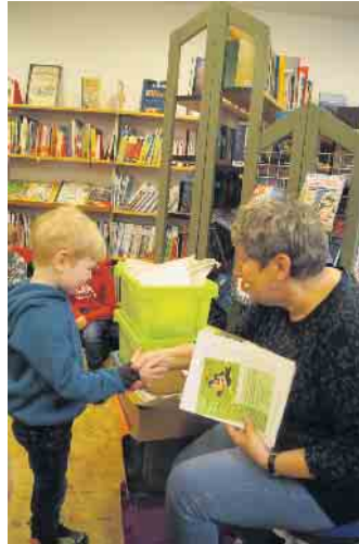
Die Bücherleitung überreicht den Bib-Führerschein

stellte spielerisch die vielfältigen Möglichkeiten der Bücherei vor. Dazu gehörten das Ausschuchen und Ausleihen, wobei die Kinder wesentliche Abläufe in der