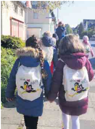
Mit Rucksack zurück in die Kita St. Anna

Zum achtzehnten Mal in Folge startete die Aktion „Bibfit“ der Katholischen Öffentlichen Bücherei St. Anna in Hangelar. Dazu lud sie die Vorschulkinder des Familienzentrums St. Anna zu verschiedenen Aktionen ein und