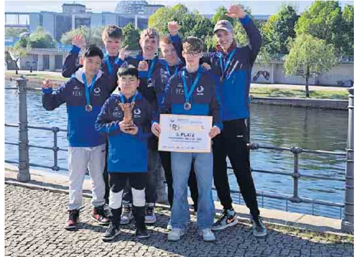
Das siegreiche Sankt Augustiner Tischtennisteam in Berlin

Bei der Abschlussveranstaltung und Siegerehrung in der Berliner Max-Schmeling-Halle wurde das Team schließlich mit dem dritten Platz geehrt. Für die Mannschaft war das eine unvergessliche