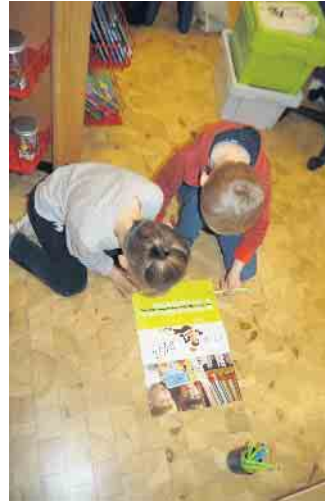
Vorschulkinder „unterzeichnen“ die große Urkunde

stellte spielerisch die vielfältigen Möglichkeiten der Bücherei vor. Dazu gehörten das Ausschuchen und Ausleihen, wobei die Kinder wesentliche Abläufe in der