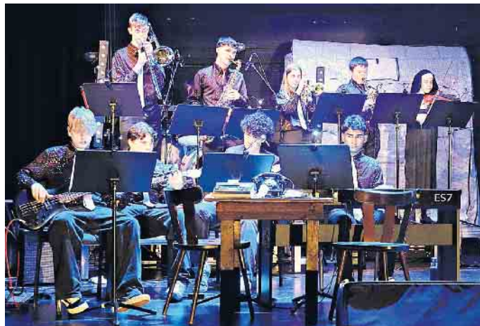
Sorgt für den guten Sound: Die Riva Swing Band.