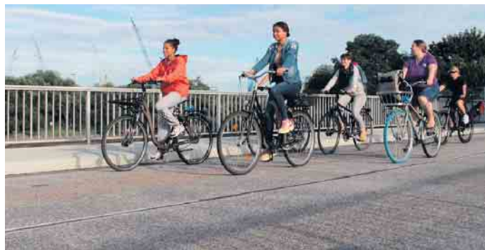
Sakrale und weltliche Architektur im Rhein-Sieg-Kreis und in Bonn.

Weitere Informationen beim Tourenleiter 0176-57815758, gereon.broil@adfc-bonn.de.