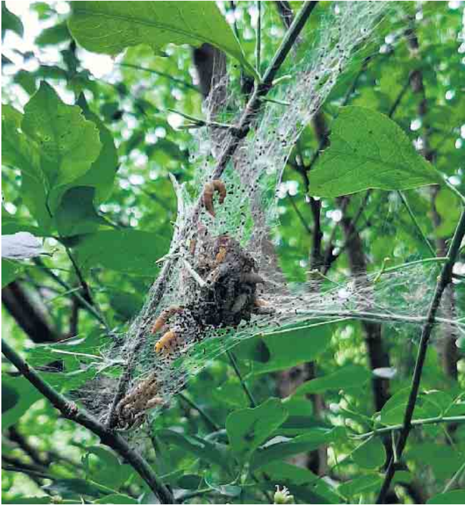
Die Larven der Gespinstmotte umweben die Äste ihrer Futterpflanzen mit einem schleierartigen Gespinst.

Städtisches Umweltbüro kann Anrufende beruhigen