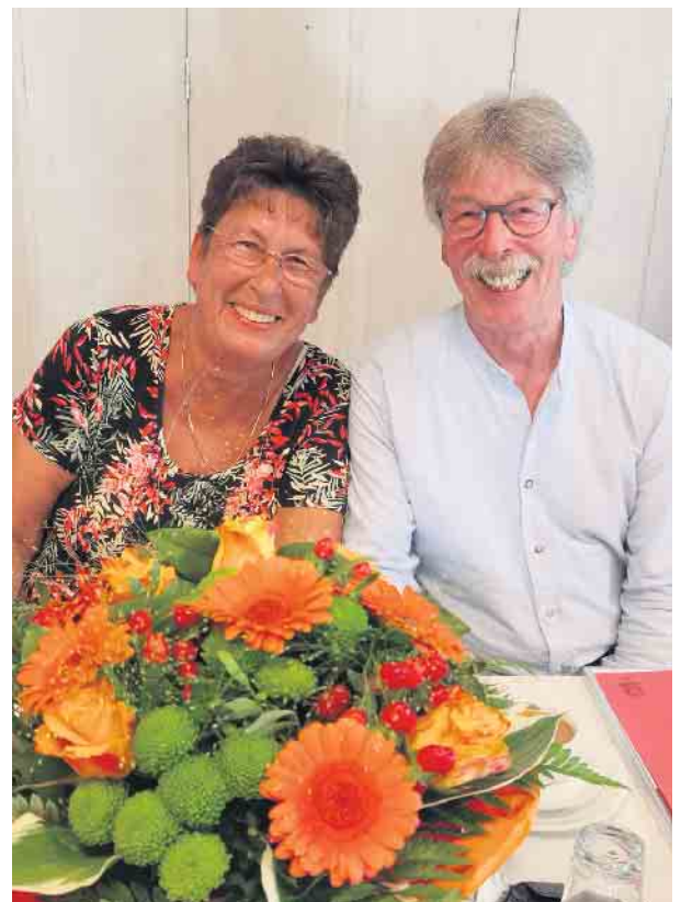
Stabwechsel bei der AWO Niederpleis