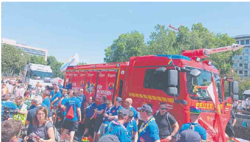
Feuerwehr beim CSD

Getreu diesem Motto hat die Freiwillige Feuerwehr Sankt Augustin gerne wie auch im letzten Jahr der Bitte um Unterstützung durch den VdF entsprochen.