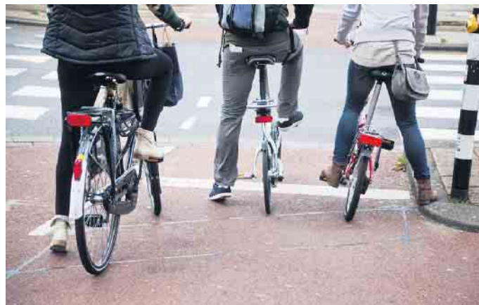
Warten an der Ampel

Die einseitige Radwegführung führt auch in Kreuzungsbereichen für Radler zu zeitraubenden Fahrmanövern, weil sie beim Abbiegen meistens zwei Ampelphasen abwarten müssen. Köhler: „Da gilt es noch viel Verbesserungspoten-