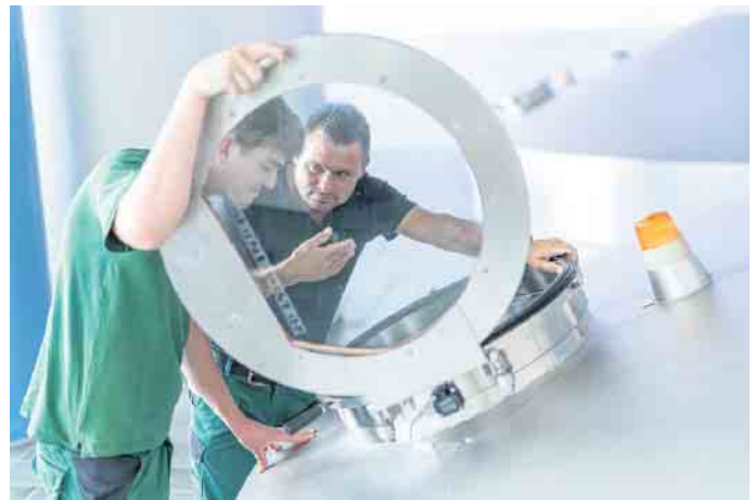
Energieagentur Rhein-Sieg: Anfang Juni trafen sich die Mitgliedskommunen der Energieagentur zur jährlichen Mitgliederversammlung in der Hennefer Meys Fabrik.

gien stieg von jetzt auf gleich sprunghaft an - viele möchten unabhängig werden von fossilen Energieträgern. „Unser Kooperationspartner, die Verbraucherzentrale NRW, hat sehr gute Angebote geschaffen, um möglichst allen Ratsuchenden gerecht zu werden.“ Aber auch die Kommunen selbst suchten nach Stellschrauben, um ihre Energiekosten zu senken. „Diese lassen sich nicht nur in den Heizungskellern finden - die Sensibilisierung der Nutzer zum eigenen Verhalten ist ebenfalls ein wichtiger Faktor“, so Schmidt. „Wir haben da auf vielfältige Weise unterstützt - und bauen diese Unterstützung nun noch weiter aus.“ So wird der weitere Ausbau von Photovoltaik auf Dächern kommunaler Liegenschaften auch in den kommenden Monaten auf der To-Do-Liste stehen. Im Bereich Photovoltaik ist die Kompetenz der Energieagentur mittlerweile sehr gefragt. Unternehmen, Bürger, Vereine oder auch Landwirte richten Anfragen an die Energieagentur. Mit einer neuen Stelle „Projektentwicklung Erneuerbare Energien“ wird diesem Bereich zukünftig noch mehr Bedeutung zugemessen und ein Beratungsangebot für