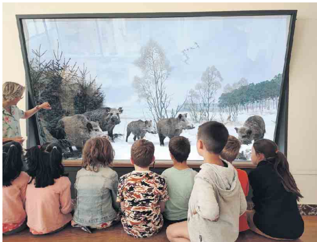
Bei einem Ausflug ins Museum König in Bonn nahmen die Kinder der OGS Meindorf an einer Führung teil.