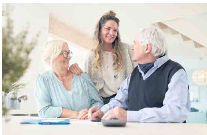
Mit Unterstützung der Eltern ins eigene Traumhaus: Um Kindern die Finanzierung einer Immobilie zu erleichtern, gibt es verschiedene Möglichkeiten.

Manchmal sind dennoch zusätzliche Mittel notwendig. Dann können Eltern die vorhandene Immobilie auch für die Kapitalbeschaffung nutzen und mit einem neuen Kredit beliehen. Zahlen Kinder ihren Eltern das private Darlehen zurück, ist es aber wichtig, die finanzielle Situation realistisch einzuschätzen. Nehmen die Eltern für den Immobilienkauf des Nachwuchses selbst einen Kredit auf, sind sie als Vertragspartner für das Begleichen der Raten zuständig. Die Hürde hierbei: Einige Banken gewähren älteren Darlehensnehmern keine Kredite. „Doch es gibt genügend Banken, die auch Senioren ein Darlehen auf ihre Immobilie geben“, sagt Udo Zimmermann. Es gibt also mehrere Wege, wie Eltern ihre Kinder unterstützen können. Ein weiterer Tipp: im Familienrat genaue Absprachen treffen und Risiken abwägen. Auch innerhalb der Familie sollten die Beteiligten ihre Geldgeschäfte besser vertraglich festhalten. (djd)