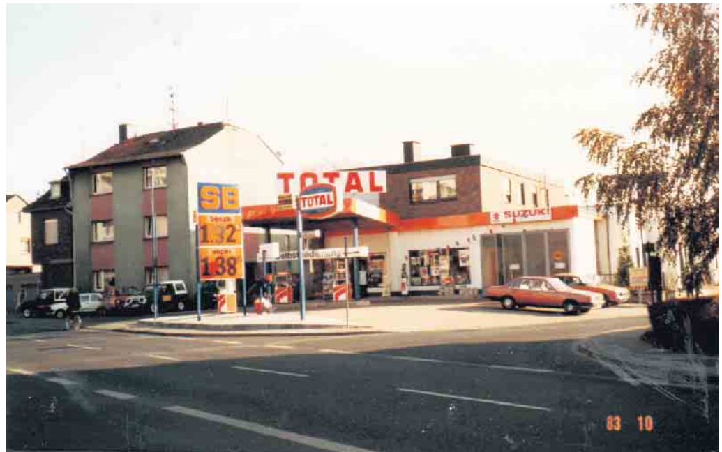
Die Tankstelle im Jahr 1984.