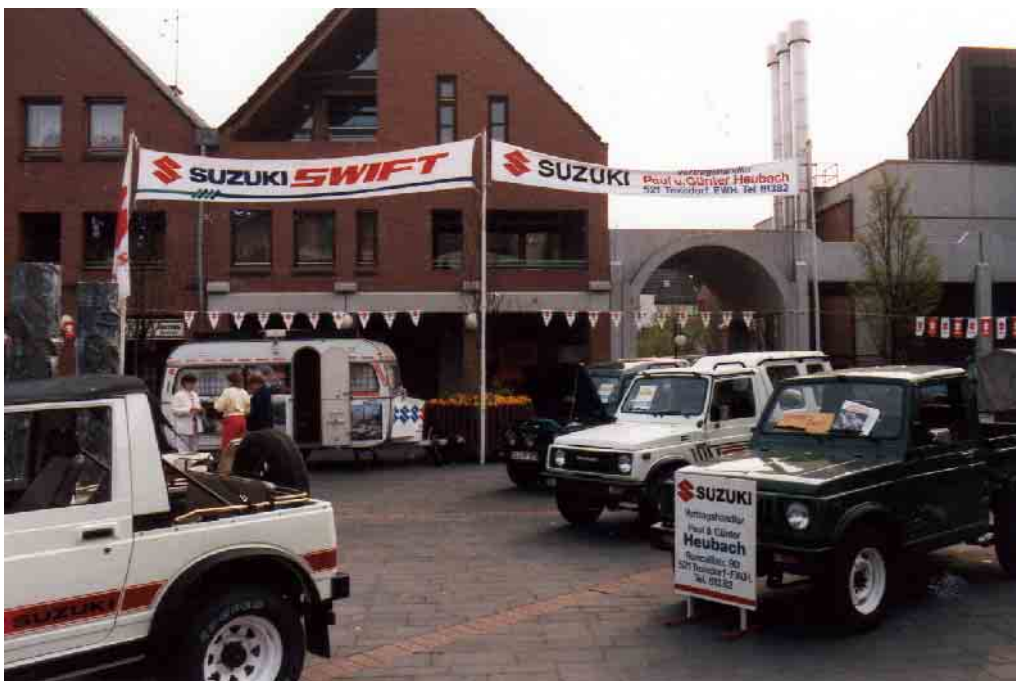
Seit 1982 Partnerschaft mit Suzuki. 1987 Ausstellung auf dem Wilhelm-Hamacher-Platz in Troisdorf-Mitte.