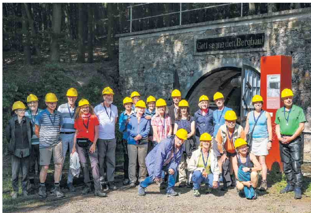
Teilnehmer der Wandergruppen des PSV am Tunneleingang zur „Grube Fortuna“ in Solms-Oberbiel.

Die 17 Kilometer lange Königsetappe am Samstag begann am Tierpark von Weilburg, führte zur Kubacher Kristallhöhle mit ihren zahlreichen Kalkspatkristallen und Sinterablagerungen und das bei nur sieben Grad unter Tage. Die Lahn wurde stillecht mit einer Hand betriebenen Rollfähre überquert. Die Altstadt und das