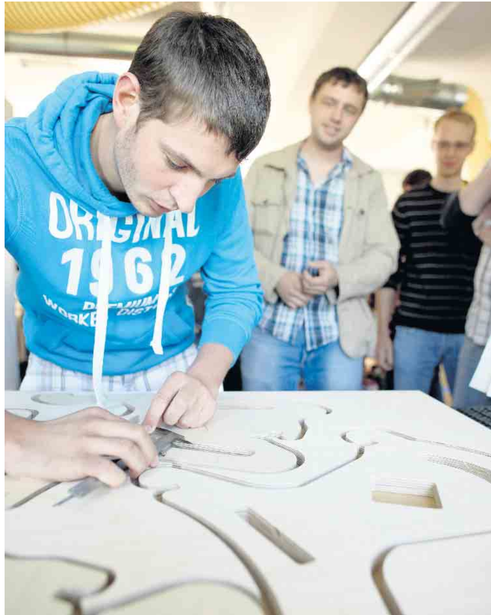
Die Arbeit mit dem Naturmaterial Holz fasziniert die Menschen seit Langem.

Wer gerne selbst den Werkstoff in die Hand nimmt, findet etwa mit einer Ausbildung als Holzbearbeitungsmechaniker oder -mechanikerin das passende Angebot. Doch nicht nur kaufmännische und technische Berufe bildet der Holzfachhandel vor Ort aus. Für effiziente Prozesse und eine zuverlässige, termingerechte Lieferung der Produkte an die Kunden sind Fachkräfte für Lagerlogistik verantwortlich. Sie begleiten das Holz quasi