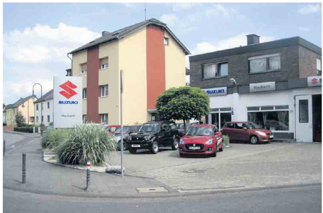
Autohaus Heubach 2023.