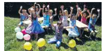
Freude über die Kindersitzgarnituren

neuen und spannenden Lebensabschnitt „Schule“ alles Gute, viel Freude und Gottes Segen.