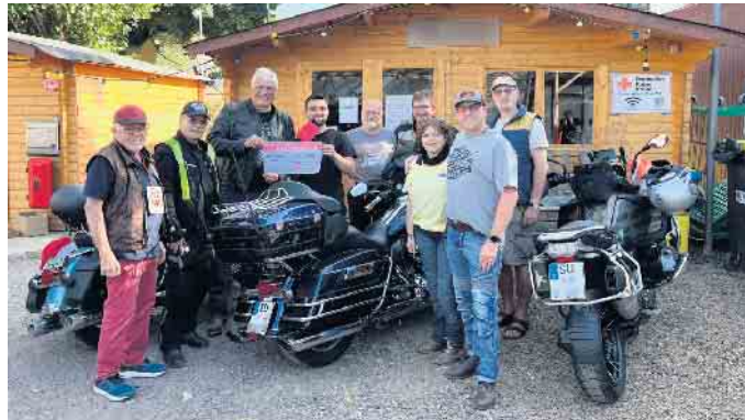
Scheckübergabe bei der AHRche e.V.

Im Anschluss ging es entlang der Ahr nach Ahrweiler auf Einladung der AHRche e.V. Was früher eine sehr belebte Gegend und eine beliebte Motor-