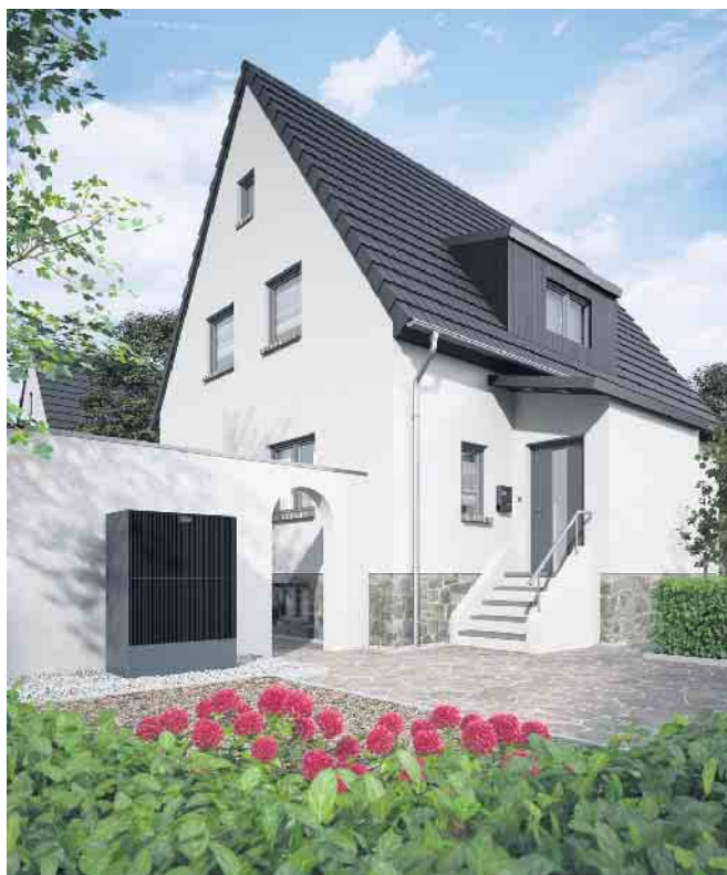
Viessmann Wärmepumpe Vitocal 25 x -A.

Seit einigen Monaten beherrschen die Themen steigende Energiepreise sowie die Notwendigkeit zur Umstellung der Heizung auf regenerative Technologien die Medien. Die Verunsicherung ist in Fachkreisen und insbesondere bei Endkunden groß. Vor diesem Hintergrund hat sich die Viessmann Verkaufsniederlassung Köln-Bonn dazu entschieden, vom Mittwoch, 17.08.2022, bis zum Freitag, 19.08.2022 , erstmalig Endkundentage durchzuführen. In der Zeit von 10:00 bis 18:00 Uhr haben interessierte Endkunden - gerne in Begleitung von unseren