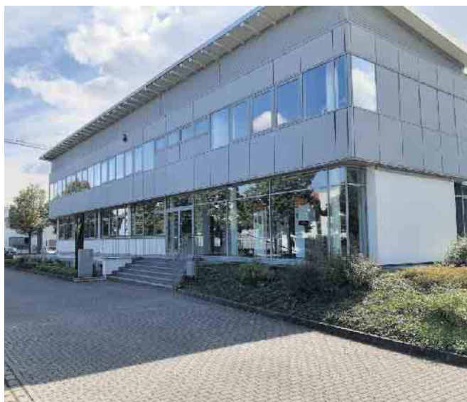
Viessmann Verkaufsniederlassung Troisdorf in der Josef-Kitz-