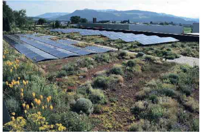
Auch Gärten sind auf Dächern möglich, es wird dann von einer intensiven Dachbegrünung gesprochen.