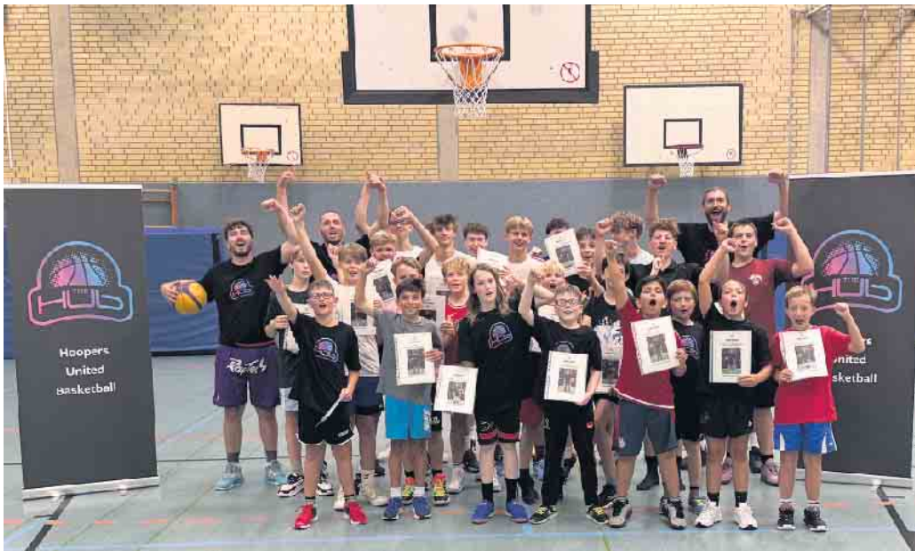
Begeisterte Kinder und Jugendliche mit den Trainern des Basketball-Camps. (Bericht auf Seite 10)