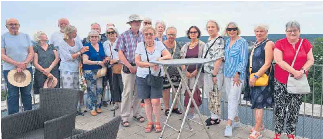
Unsere Gymnastik-Gruppe auf dem Michaelsberg

Nicht nur Sport, sondern auch geselliges Zusammensein ist unser Motto