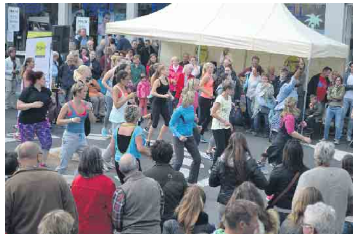
Der Apfelsonntag - eine Traditionsveranstaltung und stets ein kunterbuntes Spektakel - wie hier im Jahr 2015