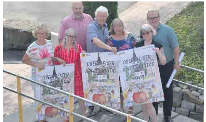
Der Vorstand des Werbekreises lädt herzlich zum 23. Apfelsonntag in den Ortskern von Oberpleis ein

kreises und werden die Kids auf die ein oder Fahrt durch den Ortskern mitnehmen. Die Liste der Angebote auch an diesem 23. Apfelsonntag ist lang, ein Besuch wird sich auf jeden Fall lohnen und dies gilt für Jung und Alt.