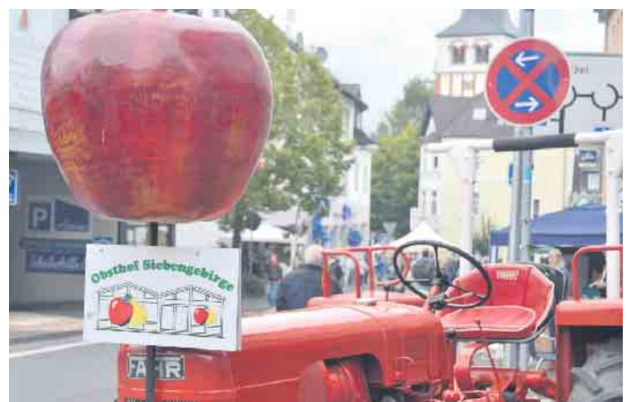
Der Obstanbau in der Region hat dem Apfelsonntag einen Namen gegeben, Obst wird auch in dieses Jahr wieder angeboten