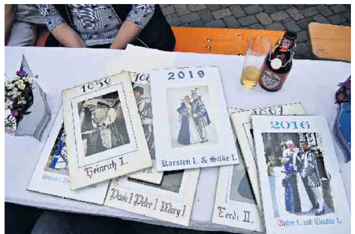
Die Prinzen- und Prinzenpaare seit 1952 suchen eine neue Wand für ihre Fotosammlung mit den Mendener Prinzen und Prinzenpaare seit 1952.