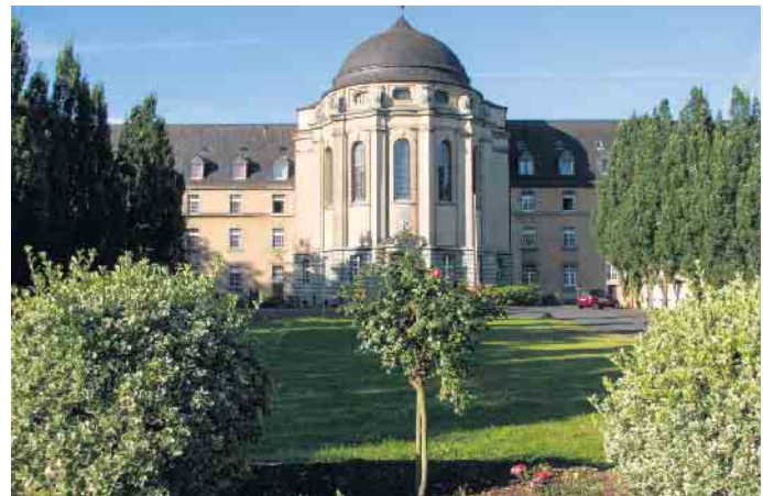
Kloster Steyler Missionare.

Rundum Betreuung zuhause durch legale Pflegekräfte. Vermittlung, Beratung und Betreuung PROMEDICAPLUS Rhein-Sieg-Nord H.-M. Fischer in Niederkassel Info Tel.: 02208-5065834