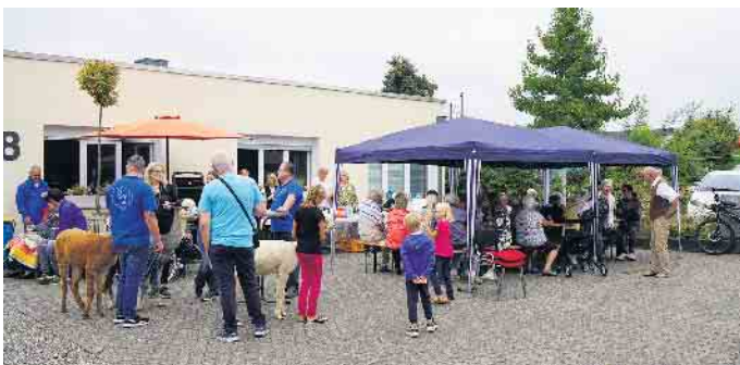
Sommerfest bei der Tagespflegestelle „rheinperle“