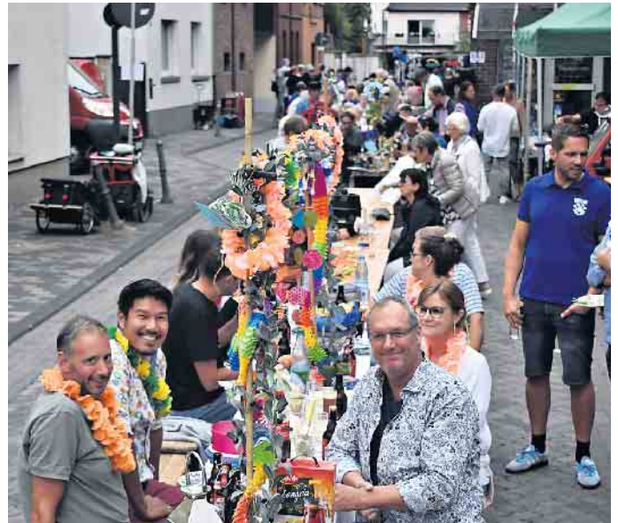
Der Versuch eines Fotos zum Längsten Tisch. Im Vordergrund der spätere Sieger für die schönste Deko: Nachbarn aus dem Rebhuhnfeld mit dem Motto Hawaii.

auch ein reger Besuchsverkehr von dem einen zum anderen Tische erforderlich wurde. Tisch 2 von Anwohnern aus dem neuen Wohngebiet Rebhuhnfeld und dem Motto Hawaii siegte mit deutlichem Abstand. Eine solche Entwicklung hat sich der Ortsausschuss mit der Idee Längster Tisch gewünscht. Wolfgang Prause, Vorsitzender des Ortsausschusses: „Wir wollen die Mendener Bürgerinnen und Bürger zwanglos zusammenbringen. Dabei haben wir noch Luft nach oben. Wir hatten 30 Bierzeltgarnituren geordert, die leider nicht alle besetzt wurden. Aber wir hoffen auf die entsprechende Mundpropaganda, dass wir auch neue Freunde für diese Veranstaltung finden.“ Kurios und zugleich nachdenklich stimmend war der Tisch der Prinzen- und Prinzenpaare seit 1952 zur Ansicht aus. Die üppige Fotosammlung ist mit Schließung der Gaststätte zur Goldenen Ecke in Menden heimatlos geworden und privat eingelagert. Geeignete Wand gesucht.