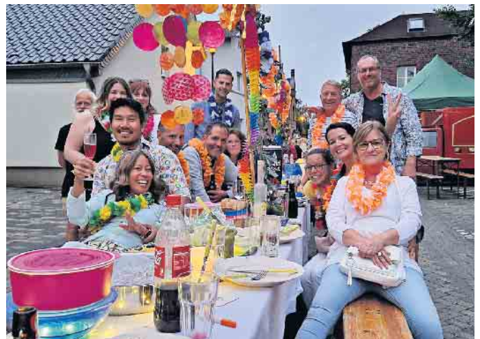
So feiern Sieger: Die Nachbarn aus dem neuen Wohngebiet Rebhuhnfeld siegen beim Längsten Desch vun Mengde mit ihrem Motto Hawaii.