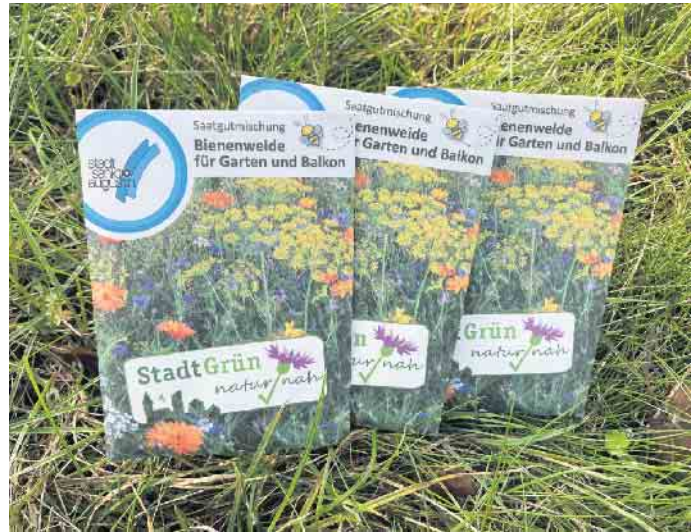
Für bunte Vielfalt in Sankt Augustin: Regionales Saatgut verschenkt das Büro für Natur- und Umweltschutz der Stadt Sankt Augustin.

Auf zahlreichen Flächen in Sankt Augustin ist in den Vorjahren bereits blühende Saat aufgegangen: in Schulgärten, bei Kirchengemeinden, auf Flächen, die von Grünpaten gepflegt werden. Die Samentüten können abgeholt werden an der Bürgerinformation im Foyer des Rathauses, Markt 1, in der Stadtbücherei oder beim Büro für Natur- und Umweltschutz (Technisches Rathaus, An der Post 19, 1. Etage) in Sankt Augustin. Informationen gibt es im Umweltbüro bei Birgit Dannefelder, Tel. 02241 243-426 oder umweltprogramm@stadt-sankt-augustin.de.