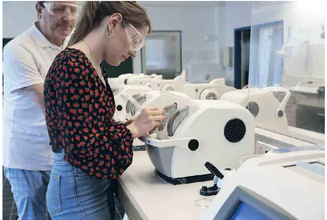
Brillenschliff, Reparatur und Anpassung - nur ein paar Dinge, die Augenoptiker-Auszubildene innerhalb von drei Jahren lernen

In der Augenoptik steht der zwischenmenschliche Austausch im Vordergrund. Gemeinsam mit dem Kunden findet der Augenoptiker individuelle Lösungen für jedes Sehproblem. Durch Expertise und modisches Gespür wird die Sehhilfe passgenau an die individuellen Bedürfnisse abgestimmt. Neben fundierten Physik- und Mathematikkenntnissen sind in der Augenoptiker-Ausbildung aber auch handwerkliches Geschick und Präzision gefragt. Der Azubi lernt, wie man Brillengläser bearbeitet, Brillen repariert und an den Träger anpasst. Moderne Messinstrumente und Hightech-Geräte