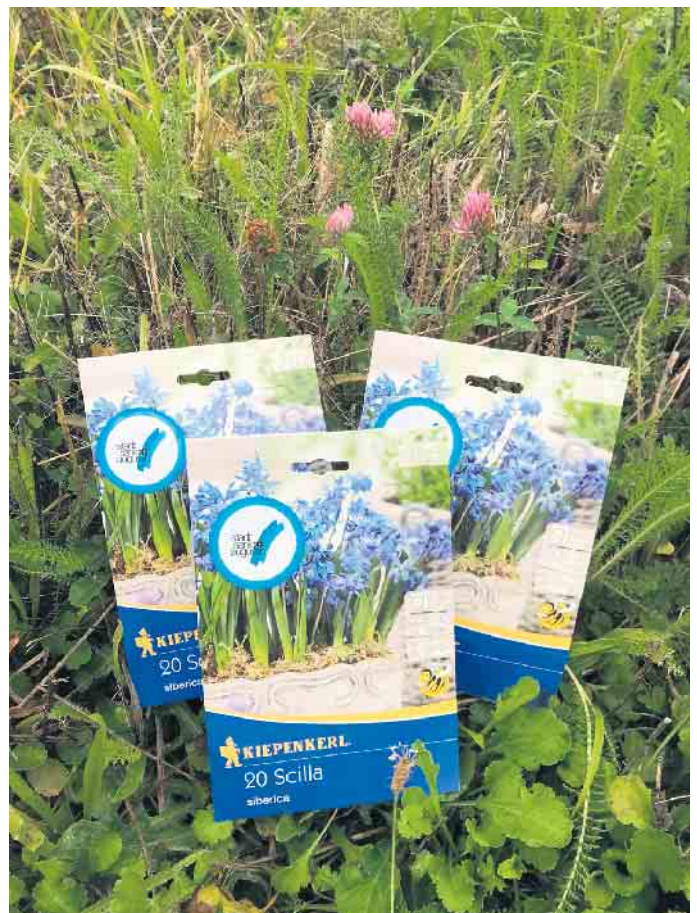
Blumenzwiebeln Sibirische Blausterne.

Zeit. An zugendem Standort und bei richtiger Pflege breiten sich die Blausterne selbständig aus und bilden wunderschöne Blütenteppiche im Garten. Die Päckchen enthalten zwanzig Zwiebeln des Sibirischen Blausters (Scilla siberica) und sie können ab September bis November vor oder unter lichten Gehölzen, in schütterer Rasen, Wiesen oder Beeten ohne Staunässe gesetzt werden. Eine Pflanztiefe von acht bis zehn Zentimeter darf dabei nicht über oder unterschritten werden. Der Blaustern wird ca. 15 Zentimeter hoch und blüht zwischen März und April leuchtend