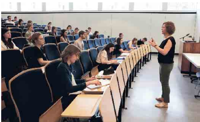
Nach einer erfolgreichen Ausbildung gibt es an verschiedenen Hochschulen die Möglichkeit, ein Studium im Bereich Augenoptik/Optometrie zu absolvieren.

Rolle im Beruf. Augenoptiker können nach der Ausbildung nicht nur im Fachgeschäft, sondern auch in der Forschung, in der Industrie, Augenkliniken oder Bildungseinrichtungen der Branche tätig werden. Umfassende Informationen hierzu finden Sie auf der Website des Zentralverbands der Augenoptiker und Optometristen (ZVA) unter www.zva.de und auf der Ausbildungsplattform www.be-optician.de . (akz-o)