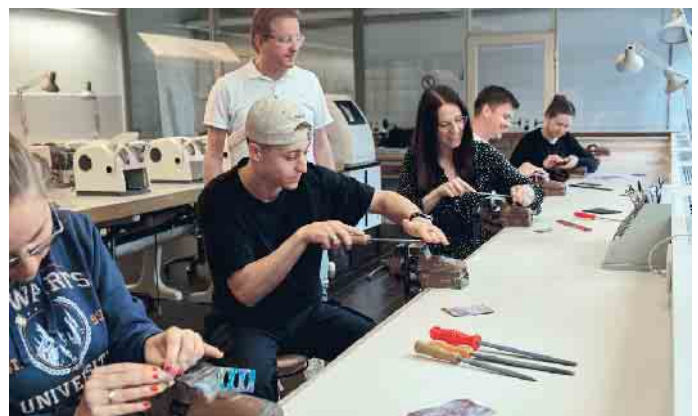
Handwerkliches Geschick und Präzision werden in der Augenoptik groß geschrieben