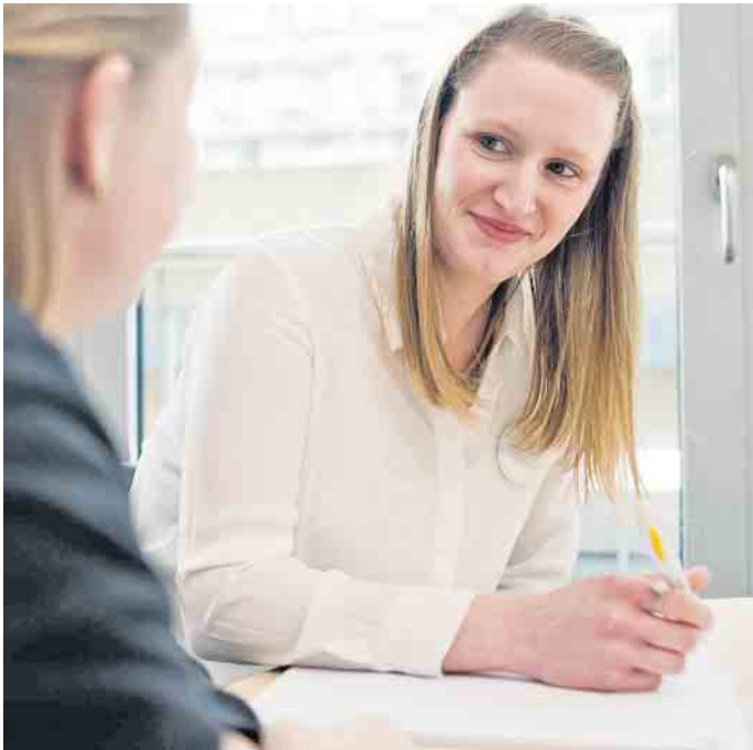
Von Mensch zu Mensch: Im Einzelcoaching werden die beruflichen Potenziale der Arbeitssuchenden ermittelt.

Förder- und Vermittlungsplan erstellt. Mit Einzel- oder Gruppencoachings wird an den nächsten Schritten zur Eingliederung in den Arbeitsmarkt gearbeitet. Diese können auch mit Kursen kombiniert werden, in denen spezielle Fachkenntnisse vermittelt werden - etwa aus dem kaufmännischen,