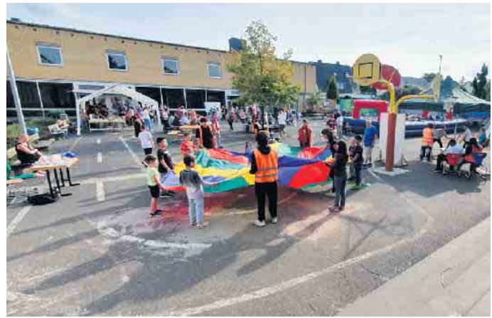
Viele Spielmöglichkeiten für die Kinder waren auf dem Schulhof aufgebaut

Zum wiederholten Male fand in der Gutenbergschule im Rahmen der „Interkulturellen Woche“ ein Spielefest für die gesamte Schulgemeinde statt, und dieses sogar bei herrlichem Herbstwetter. Auf dem Schulhof und im Schulgarten gab es mehrere Spielstationen für die Kinder und Jugendlichen, während es im Eingangsbereich des Foyers für alle Kaffee, Waffeln und Kuchen und unsere beliebten Grillwürstchen gab. Im Verlaufe des Nachmittags konnten alle Schüler*innen, aber auch Geschwisterkinder an 15 Stationen auf dem Schulhof und im Schulgarten mit unterschiedlichen Anforderungen ihre Geschicklichkeit und ihr Können beweisen, manchmal als Einzelperson, manchmal aber auch Teamgeist gefragt, um die Aufgaben zu lösen. Unbestreitbar der Renner war der extra für dieses Spielefest ausgeliehene Riesenkicker,