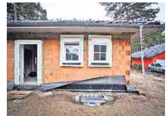
Wegen hoher Kosten, der Inflation und den Unsicherheiten der Energiemärkte verschieben viele Bauwillige mit mittleren Einkommen ihre Baupläne auf unbestimmte Zeit.

Wer seinen Traum vom Immobilieneigentum trotz schwieriger Rahmenbedingungen nicht aufgeben möchte, findet Rat und Tat bei den BSB-Bauherrenberatern. Unter www.bsb-ev.de gibt es dazu mehr Informationen, Adressen und regionale Ansprechpartner. Die unabhängigen Bauexperten beraten bei der Kostenplanung, der Auswahl eines Baupartners und der Vertragsgestaltung. Sie können Bauherren dabei unterstützen, Sparpotenziale zu identifizieren. Dazu bieten sie eine baubegleitende Qualitätskontrolle an, die das Bauprojekt vom ers-