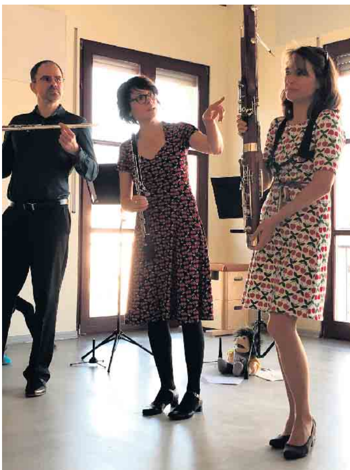
Das Ensemble Corrélatif erklärt die Instrumente und musiziert mit den Kindern.

Das Mitmachkonzert ist dabei ein schönes Highlight und die Kinder freuen sich jedes Jahr darauf. Nun fand ein weiteres Mitmachkonzert in der Kita statt. Das Ensemble Corrélatif spielte für die Kinder die Lieder „In einem kleinen Apfel“ und „Räder rollen“. Ganz nebenbei lernten die Kinder die Instrumente wie Fagott, Querflöte, Oboe und Klarinette kennen. Die Kinder sind immer wieder aufs Neue begeistert, wenn sie die Musik live erleben dürfen.