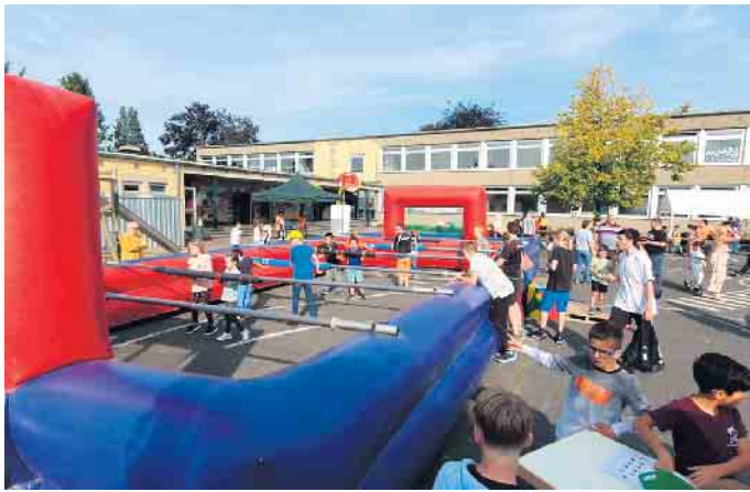
Die Riesenkicker war der Renner beim diesjährigen Spielefest

Die Gutenbergschule bot allen Kindern beim Spielefest Sport, Spiel und Spannung