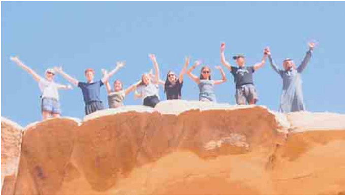
Wadi Rum in Jordanien, Foto: Gregor Schröder

Der Sankt Augustiner Verein JugendInterKult e.V. (JIK) sucht nicht nur VolontärInnen (ab ca. 4 Wochen) für das Tent of Nations (ToN) und weitere Mitarbeiter/-innen für unsere Projekte (siehe unsere Webseite: www.jugendinterkult.de ), sondern dringend 2 bis 3 Begleitpersonen für unsere zweiseitigen Jugendbegegnungen mit Israel-Palästina, die nach Fahrtteilnahme im Oktober 23 und intensiver JIK-Schulung diese Fahrten auch als Leitende vor-