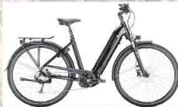
Victoria eTrekking 12.8