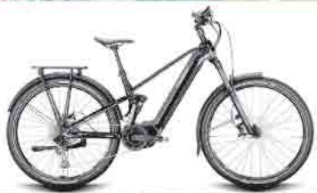
Conway Xyron SUV 6.9

Angebot gilt nicht für unsere Sonderposten, Leasing oder Finanzierung