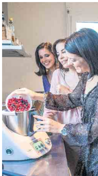
So wird kaufen zum Erlebnis: Bei Produktpräsentationen zu Hause kann man in Ruhe alles ausprobieren.

Wenn persönliche Kontakte reduziert werden, sind Produktpräsentationen zum Beispiel per Webcam eine erfolgreiche Alternative.