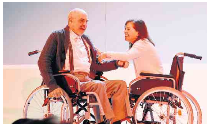
Ein heller Moment zum Schluss: Ein flotter Samba im Rollstuhl. Erinnerungen an bessere Zeiten.