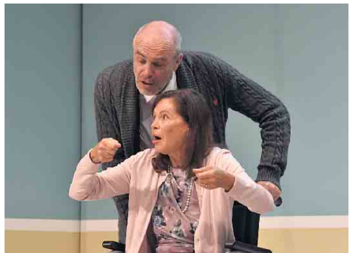
Es wird schwierig: Er erklärt ihr einfühlsam die Abläufe beim Zähneputzen, ein komplexer Vorgang, der plötzlich viel Zeit und Pausen zwischendurch erfordert.