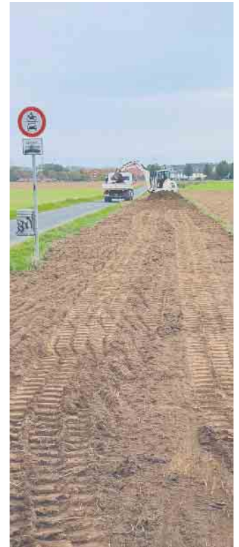
Blick auf den vorbereiteten Blühstreifen.

Die Stadtverwaltung konnte die Grundstückseigentümer und den Pächter eines rund 1000m 2 großen Teilstücks der Packlage von der Idee überzeugen, hier einen Blühstreifen zu realisieren. In der Gartenbaufirma Yildiz fand sich ein ausführendes Unternehmen, das ebenfalls gerne einen ehrenamtlichen Beitrag zum Natur- und Artenschutz leisten wollte. Das regionale Saatgut wird vom Landschaftsverband Rheinland (LVR-Dezernat Kultur und Landschaftliche Kulturpflege) zur Verfügung gestellt. Hier hatte das Büro für Natur- und Umweltschutz einen Antrag auf Förderung gestellt, der nun auch genehmigt wurde. Die Fläche wird nun in Kürze mit dem Saatgut eingesät werden. Schon im Frühjahr 2023 soll sie vielen Insekten und der Tierwelt in der Grünen Mitte als Ganzes Nahrung, Brutplatz und Deckung bieten. Deshalb werden insbesondere die Hundebesitzer darum gebeten, den Bereich nicht von Ihren Vierbeinern betreten zu lassen. Alle Besucherinnen und Besucher können sich schon darauf freuen!