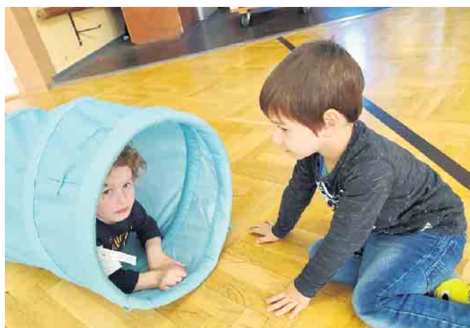
Bild: Zwei kleine Teilnehmer am Mutter-Kind-Turnen

Dem Basketballspiel ist hier in der Regel noch ein Aufwärmtraining vorgeschaltet.