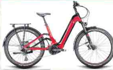
Conway Cairon SUV FS 4.7