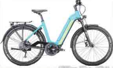
Victoria eAdventure 12.8