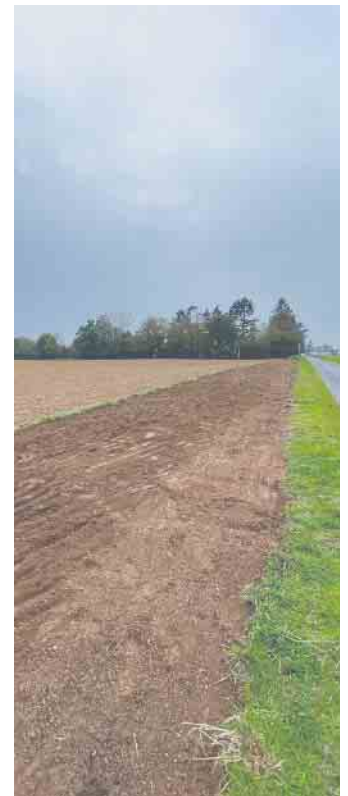
Blick auf den vorbereiteten Blühstreifen.