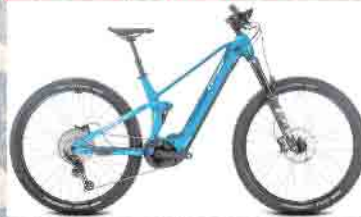
Conway Xyron S4.9