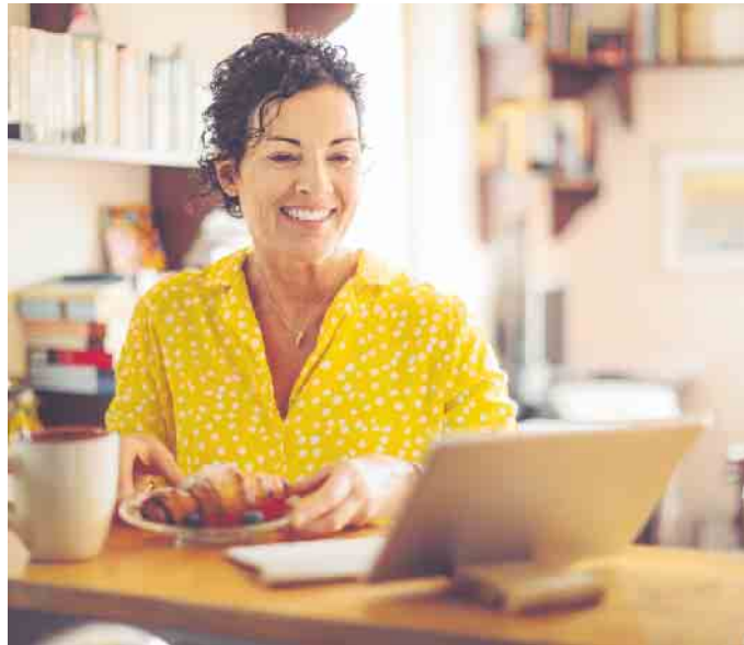
Gut beraten, auch mit Abstand: Digitale Technik gewinnt auch im Direktvertrieb stark an Bedeutung.

Für Einsteiger bieten die Unternehmen umfassende Schulungen, finanzielle Risiken gehen sie trotz der Selbstständigkeit nicht ein.