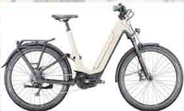
Victoria eParcours 12.8