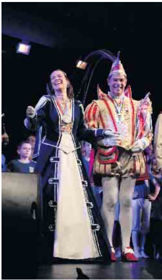
Das Prinzenpaar der Stadt Sankt Augustin war ebenfalls bestens gelaunt