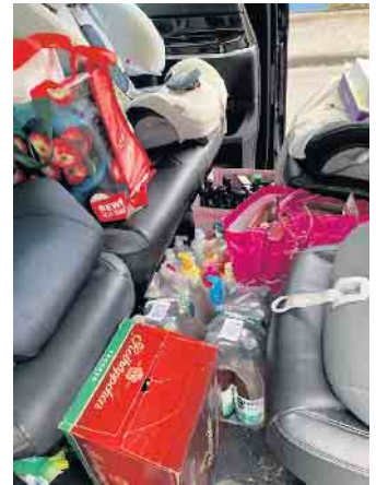
Eine Wagenladung voller Spenden

Eine Wagenladung voller Hilfe für das Ronald McDonald Haus. Das ist das tolle Ergebnis der Aktion „Teilen wie Sankt Martin“ an der sich die Familien im Familienzentrum Sankt Anna großzügig mit Sachspenden beteiligten. Die Aktion wurde vom Elternrat in Kooperation mit dem Ronald Mc Donald Haus durchgeführt. Im Ronald McDonald Haus können Eltern schwerkranker Kinder ein Zuhause auf Zeit finden, während die kleinen Patienten in der Kinderklinik nebenan behandelt werden. Es leistet wertvolle Hilfe für Familien in „Krisensituationen.“ Elternvertreter überreichten die reichhaltigen Spenden im Namen aller Kinder und Eltern an