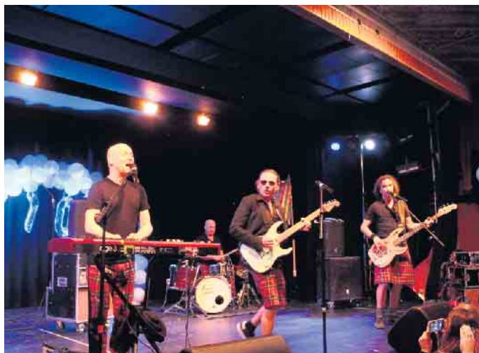
BRINGS rockte die Mendener Aula Bericht auf Seite 10

Mendener Jecken feiern mit BRINGS ihr Jubiläum