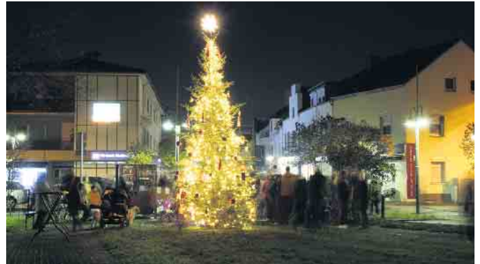
Der Dorfbaum in Hangelar am, seit 2022 neuen, Standort

vorsteher Wilfried Schwab zum zweiten Dorfbaumleuchten auf den aus jahrelangem Dornröschenschlaf erweckten Dorfplatz „Op d'r Dränk“ ein. Ab 16 Uhr soll wie schon im Vorjahr mit einem gemütlichen Nachmittag in der Dorf-