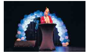
Der Sitzungspräsident stieß mit dem einen oder anderen Kölsch auf das Jubiläum an

nem frenetisch gefeierten Auftritt inklusive Zugabe unter großem Applaus die Bühne verließ. Ein großartiges Bild gaben im Anschluss die Funken Blau-Weiß Sieburg ab, die mit einer Großzahl von Tänzer*innen und tollen Darbietungen gratulierten. Der Topact des Abends waren zweifelsohne BRINGS. Und obwohl die Truppe an diesem Abend krankheitsbedingt auf Frontsänger Peter Brings verzichten musste, sorgte sie genau für die Stimmung, für die sie weit über die Kölner Stadtgrenzen hinaus bekannt ist. Einen krönenden Abschluss des Programms bildete die Tanzgarde der KG, die ebenfalls unter großem Applaus von den Geburtstagsgästen gefeiert wurde. Nach diesem großartigen Abend freuen sich bereits viele