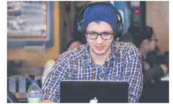
Bei der Lehrstellensuche spielt das Internet eine große Rolle.