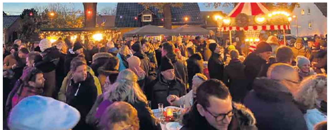
Dichtes Gedränge auf dem Vorplatz des Schützenhauses

Kraftstoffverbrauch 1 in l/100 km, innerorts: 6,3-5,8; außerorts: 5,0-4,4; kombiniert: 5,5-4,9; CO 2 -Emission, kombiniert: 114-111 g/km (gemäß VO (EG) Nr. 715/2007, VO (EU) Nr. 2017/1153 und VO (EU) Nr. 2017/1151). Effizienzklasse A