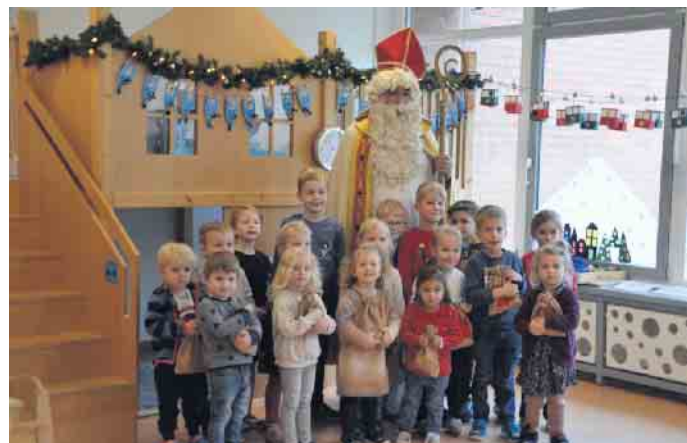
Der Nikolaus begeistert alle Kinder