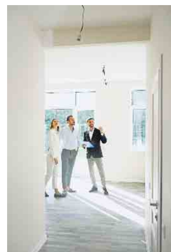
Ein Makler übernimmt auch die Wohnungsbesichtigungen mit den Kaufinteressenten.

land keine geschützte Berufsbezeichnung ist, gilt es, bei der Auswahl eines geeigneten Immobilienprofis auf einige Aspekte zu achten. Es ist zum einen unverzichtbar, dass der Makler oder die Maklerin sich in der Region gut auskennt, da die Lage bei jeder Immobilie ein wichtiges Preiskriterium darstellt. Auf www.immoscout24.de/immobilienmakler etwa finden Immobilienverkäufer geprüfte Fachleute, die auf die jeweilige Region und die Art der zu verkaufenden Immobilie spezialisiert sind. (djd)