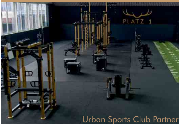
Urban Sports Club Partner

Functional Fitness auf 500qm Freies Training / Kurse / Personal Training