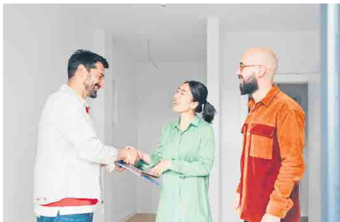
Eine Partnerschaft auf Augenhöhe - das sollte die Zusammenarbeit mit einem Immobilienmakler sein.

„Mit einem leichten Zeitversatz zeigt sich eine Veränderung der Immobilienpreise auf die abgeschwächte Nachfrage. Wir sehen mehr Angebote für Kaufimmobilien auf dem Markt, längere Verkaufszeiten von Immobilien und eine Verlagerung der Nachfrage in Richtung Miet-Markt“,