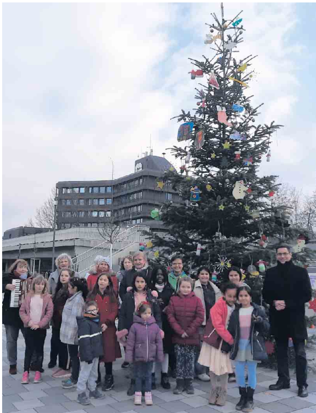
Die Kinder der KGS Mülldorf übergeben Bürgermeister Max Leitterstorf (re.) den geschmückten Weihnachtsbaum.

An den traditionellen großen Weihnachtsbäumen in den Stadtteilen hält die Stadt Sankt Augustin auch in Anbetracht der Energiekrise fest. „Wir haben circa zehn große Weihnachtsbäume aufgestellt und diese mit LED-Beleuchtung ausgestattet. Außerdem wurden die Beleuchtungszeiten reduziert. In Summe wird die Beleuchtung dieser Bäume für die gesamte Weihnachtszeit nur 20 bis 30 Euro Stromkosten verursachen“, erklärt Bürgermeister Max Leitterstorf. „Daher wäre es unverhältnismäßig, auf diese weihnachtliche Tradition zu verzichten.“