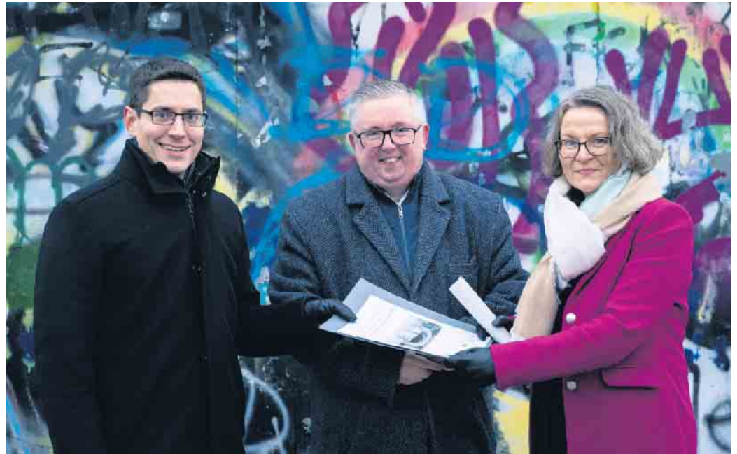
Bürgermeister Max Leitterstorf, NRW-Kommunalministerin Ina Scharrenbach und Landtagsabgeordneter Sascha Lienesch beim Ortstermin am Sankt Augustiner Skatepark.

Die Stadt Sankt Augustin kann mit einer Förderung für den Neubau des Skateparks rechnen. Der bei Kindern und Jugendlichen sehr beliebte Skatepark an der Zufahrt zum Freibad in der Nähe des Stadtzentrums musste im Oktober 2022 leider geschlossen werden. Die kleineren Skateelemente sowie die Halfpipe waren nicht mehr verkehrssicher und wiesen eine erhöhte Unfallgefahr auf. Für einen an die heutigen Standards angepassten Neubau der Anlage werden nach aktueller Einschätzung mindestens 500.000 Euro benötigt. Angesichts der schwierigen Haushaltslage kann diese Summe von der Stadt kaum alleine aufgebracht werden. Deshalb hatte sich Bürgermeister Max Leitterstorf vor wenigen Wochen an NRW-Kommunalministerin Ina Scharrenbach gewandt und um eine finanzielle Unterstützung durch das Land gebeten. Auf Einladung des örtlichen Landtagsabgeordneten Sascha Lienesch, der sich wie alle Ratsfraktionen für den Skatepark einsetzt, machte sich die Ministerin nun vor Ort selbst ein Bild vom Zustand des Skateparks. „Der Skatepark ist wegen seiner zentralen Lage ein beliebter Treffpunkt für Groß und Klein und von enormer Bedeutung für unsere städtische Kinder- und Jugendarbeit. Als Anlaufstelle für viele verschiedene Sportarten hat er sich zu einer der beliebtesten Freizeitanlagen in der Stadt entwickelt. Auch von körperlich