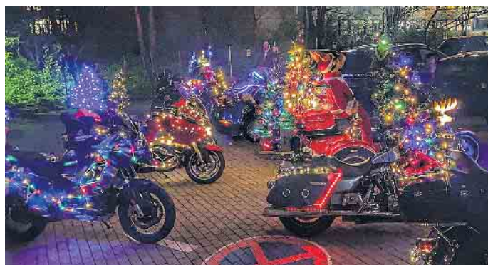
Und das ist nur ein Teil des weihnachtlich geschmückten Fuhrparks der Biker for Kids.