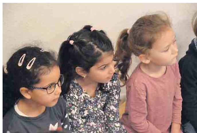
Den Nikolaus im Blick