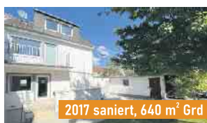
2017 saniert, 640 m 2 Grd

SANKT AUGUSTIN Einfamilienhaus, BJ 1996 ca. 125 m 2 Wohnfläche EA-B: G, 205,9 kWh, Gas