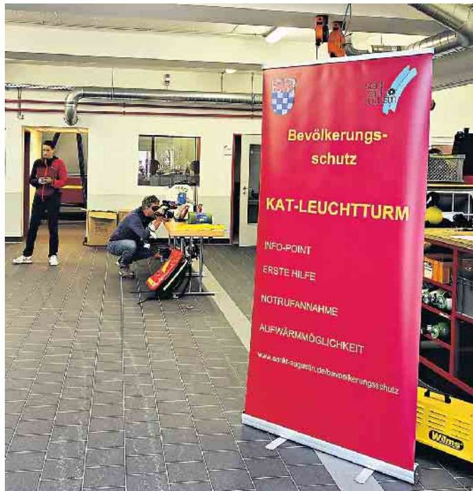
Die Stadt Sankt Augustin macht ihre Schularbeiten für mögliche Stromausfälle / Blackouts und hat sogenannte KAT-Leuchttürme in den Feuerwehrgerätehäusern der Stadt vorbereitet.