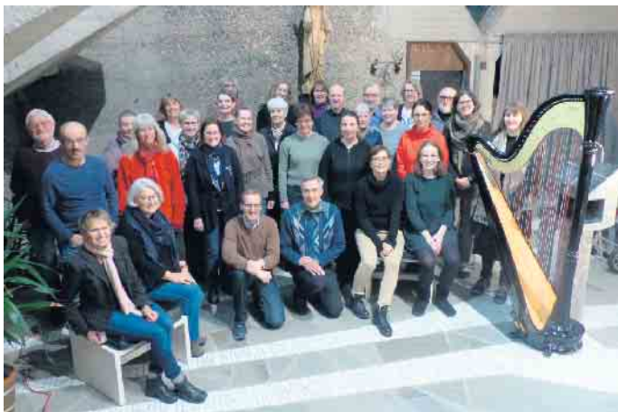
Der Konzertchor beim Proben.

Im neuen Jahr vielleicht auch mit Ihnen?