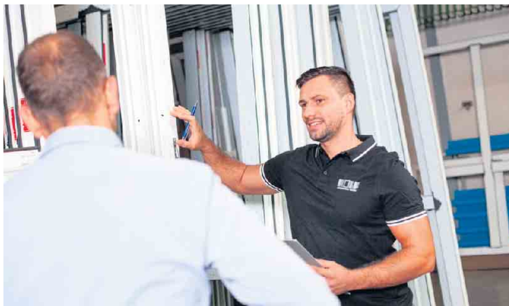
ROLF Fensterbau - Ihr kompetenter Rundum-Service zum Thema Schallschutz