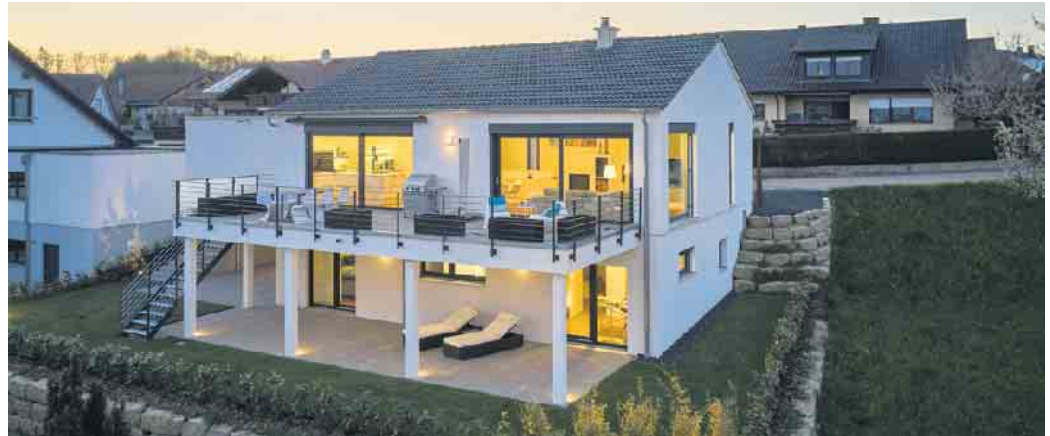
Keller werden heute zum Wohlfühlwohnen genutzt.

Eine Einliegerwohnung im Keller? - „Da ist es doch dunkel, feucht und muffig. Da möchte ich bestimmt nicht wohnen“, wird sich früher manch einer gedacht haben. Heute ist das ganz anders, was nicht etwa daran liegt, dass man gerade in Ballungsgebieten jede Wohnung nehmen muss, die man kriegen und bezahlen kann. Nein, vielmehr ermöglichen auch Wohnungen im Kellergeschoss inzwischen echtes Wohlfühlwohnen. „In fast jedem Einfamilienhaus mit Keller wird dieser als vollwertiges Wohngeschoss mit