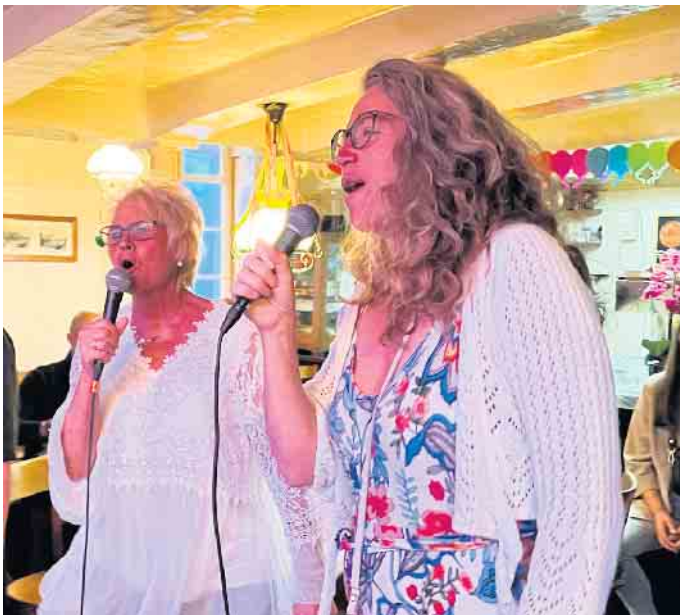
Karaoke-Sängerinnen im Jägerhof.