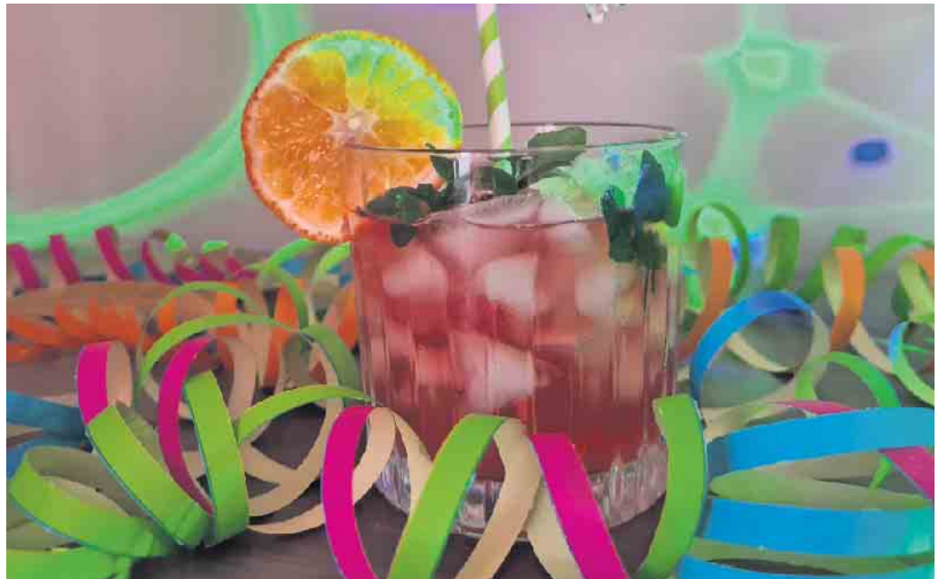
„Lass dich nicht K.o.-Tropfen“ - warnt das Netzwerk Oberberg no- gegen Gewalt und gibt Tipps und informiert über Hilfsangebote.

test. Danach kann das Verfahren der anonymen Spurensicherung eingeleitet werden. Betroffene Frauen können sich dabei von den geschulten Ärztinnen und Ärzten untersuchen lassen und haben im Nachhinein bis zu zehn Jahre lang Zeit, sich für eine Strafanzeige zu entscheiden. Wichtig ist, dass mögliche Spuren unmittelbar nach der Tat gesichert werden. Weitere Informationen auf www.obk.de/ass .