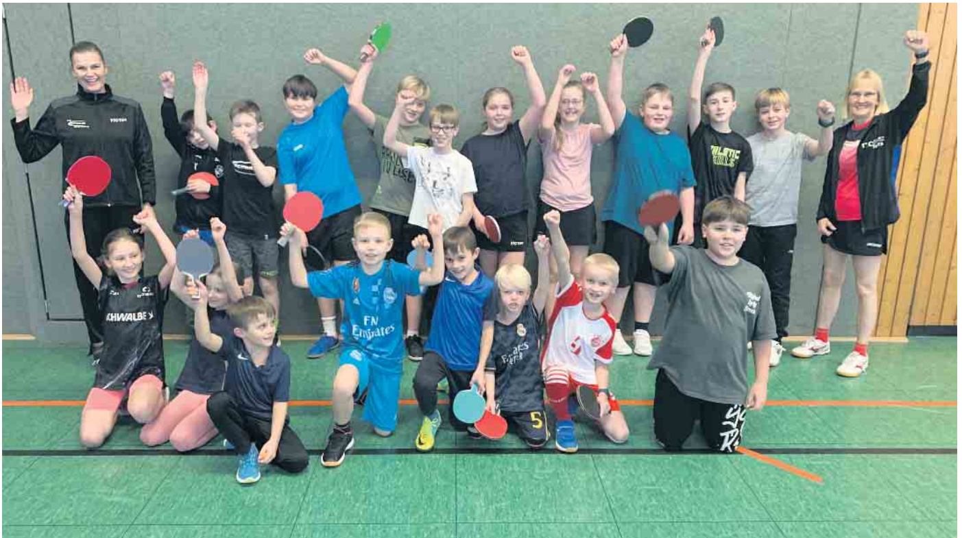
Die Teilnehmerinnen und Teilnehmer der 42. Tischtennis-Minimeisterschaften mit den Trainerinnen Edita Galatiltiene u. Petra Bösinghaus (v. l.).

Tischtennis-Minimeisterschaften in Bergneustadt