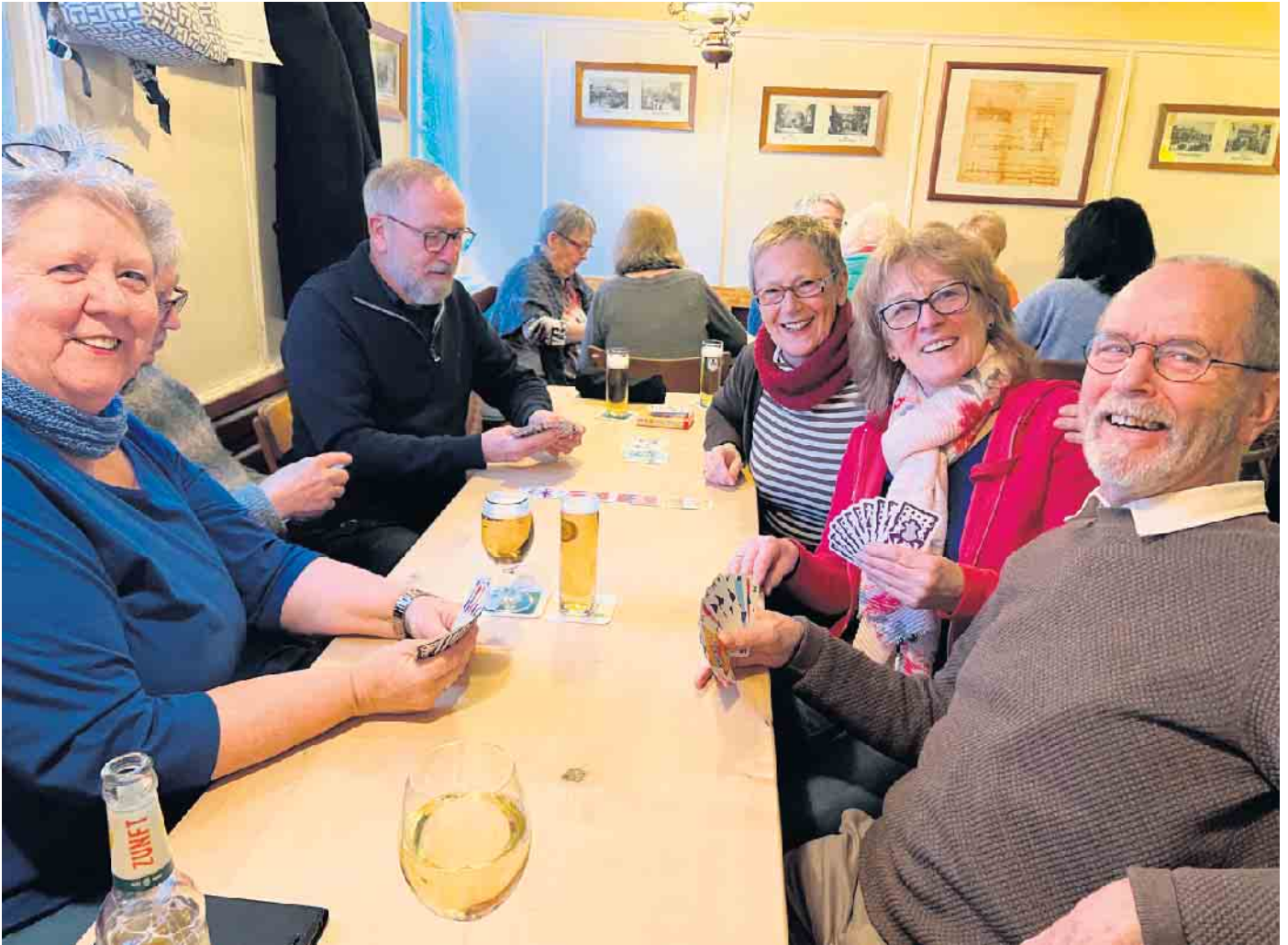
Geselliger Spieleabend im Jägerhof.

Der erstmals ausgerichtete Spieleabend im Jägerhof am Freitag, 14. Februar, war ein voller Erfolg. Das teilte Tatjana Mönnich, Organisationschefin der Jägerhof-Genossenschaft, mehr als zufrieden mit: „Unser Angebot wurde angenommen, der Jägerhof war restlos ausgebucht, alle Gäste waren happy, eine Wiederholung ist versprochen!“ Schon wenige Minuten nach Öffnung um 17 Uhr war die Bergneustädter Kultkneipe voll besetzt. Zusätzliche Spieltische und Stehtische wurden herangeschleppt und im Flur aufgestellt, um mehr Platz zu schaffen. Vom Würfeln über verschiedene Kartenspiele bis zur Königsdisziplin Schach - Jung und Alt teilten ihre Begeisterung für analoge Gesellschaftsspiele miteinander.