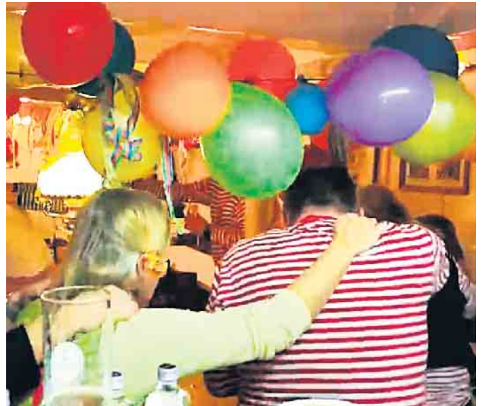
An Karneval zieht die Karawane durch den Jägerhof.

Kölsche Karnevalsklänge und ein bunt geschmückter Jägerhof erwarten die Jecken ab Weiberfastnacht, 27. Februar. Raderdolle Weiber zeigen es den Alphamännchen, indem sie das Regiment in Bergneustadts Kultkneipe übernehmen und sich mit Volldampf in die tollen Tage stürzen. Am Freitag, 28. Februar, der andernorts als Ruhetag im Karneval gilt, geht das närrische Treiben weiter. Nach einer Verschnaufpause am Wochenende freuen sich jecke