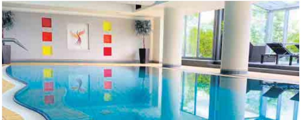
Hier findet die Wassergymnastik statt.

Der Kurs richtet sich an alle, die sich fit halten und gleichzeitig etwas für ihr Wohlbefinden tun möchten. Durch gezielte Übungen im Wasser werden das Herz-Kreislaufsystem trainiert, die Beweglichkeit gefördert und die Muskelkraft gestärkt. Der Wasserauftrieb reduziert das Körpergewicht und entlastet die Gelenke - eine ideale Möglichkeit, um den Körper nach den Anforderungen des Berufs und Alltags zu kräftigen und zu entspannen. Eine gute Gelegenheit, sich in