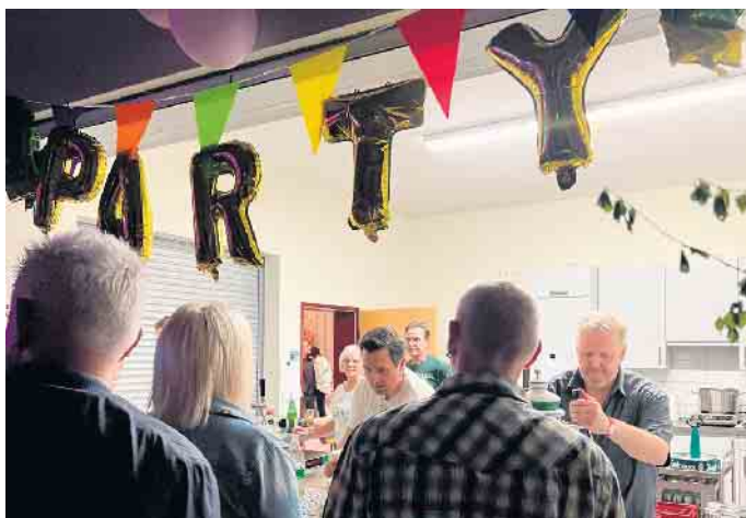
Schlange stehen für frisch Gezapftes vom Jägerhof-Team