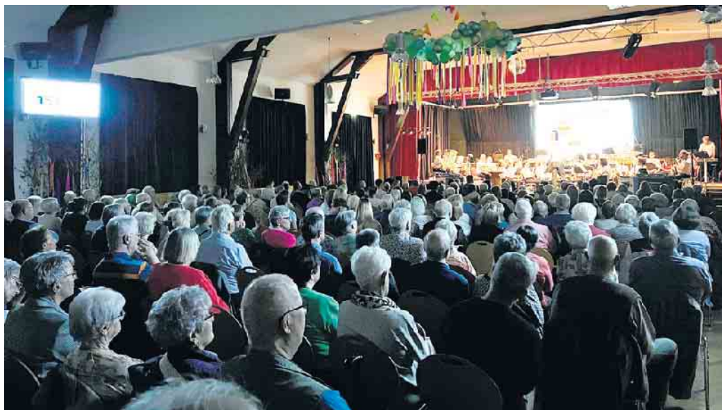
Frühjahrskonzert des Musikzuges der Freiwilligen Feuerwehr.

Nachdem sich im Anschluss an das Konzert der bestuhlte Saal schnell in eine Tanzfläche verwandelt hat, können alle Feierlaunigen direkt in den Mai tanzen. Um 22 Uhr startet die „zweite Halbzeit“, die von der Jägerhof-Genossenschaft organisiert wird: Partytime mit der Live-Band Red Igelz. Die fünfköpfige Coverband aus dem Ober-