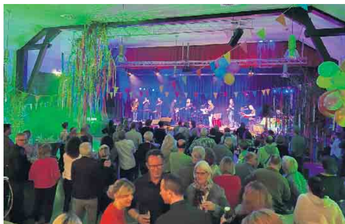
Partytime im Krawinkelsaal

sucher, die erst um 22 Uhr zur Happy Hour kommen, zahlen an der Abendkasse 9 Euro.