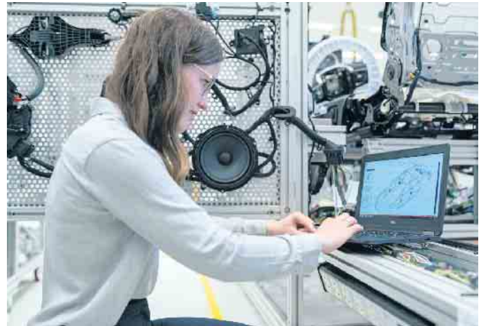
Kupfer spielt in vielen zukunftsweisenden Berufen eine wichtige Rolle - zum Beispiel in der Entwicklung und Produktion von E-Autos.

Arbeitsplätze in vielen Bereichen - auch außerhalb der Kupferindustrie. (DJD)