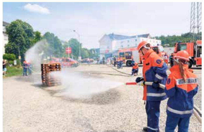
Schauübung der Jugendfeuerwehr

Am Samstagabend gab es eine Mega-Party im zum Bersten gefüllten Festzelt mit mehreren Live-Acts. Nach einem Konzert am Sonntagvormittag des Musikzugs Bergneustadt zeigte die Jugendfeuerwehr den rund 200 Besuchern in einer Schauübung, wie ein brennender Holzstapel routiniert gelöscht wird. Später demonstrierte die Wiehler Rettungshundestaffel der Johanner Rhein-Oberberg die Flächensuche einer vermissten Person. (mk)