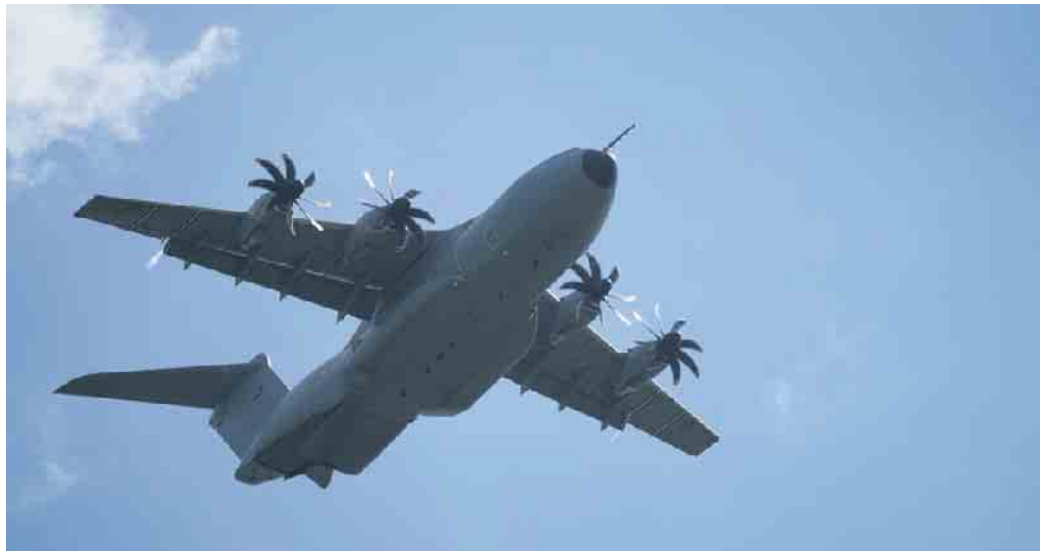
LSC Dümpel

Aber auch das übrige Flugprogramm des Wochenendes konnte sich sehen lassen: Neben spektakulären Flugvorführungen im Kunstflug wurden viele klassische Flugzeuge am Boden und in der Luft präsentiert, unter anderem eine Boeing Stearman, eine Stampe S4, eine Ryan PT 22 sowie ein Stieglitz, alles perfekt gepflegte und erhaltene Modelle aus den 30er- bis 50er-Jahren. Faszinierend auch die Vorführung vieler befreundeter Modellflieger, die mit Ihren unfassbar originalgetreuen Modellen Luftakrobatik vorführten, als würden für sie die