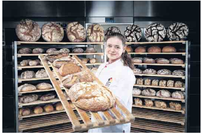
Junge Leute sind begehrt in der Branche - sie haben Spaß an Lebensmitteln, sind kreativ und holen sich ihre Inspirationen auch über soziale Medien.

Der Weg ins Bäckerhandwerk: Ob Abitur oder Hauptschulabschluss, das Bäckerhandwerk steht jedem entsprechend seinen Qualifikationen offen. Grundsätzlich ist ein Schulabschluss von Vorteil. Fachverkäufer können nach der Gesellenprüfung Verkaufsleiter werden, Bäcker können den Meister machen und danach sogar Bäckerreimanagement studieren, sich selbstständig machen oder eine Weiterbildung zum Brotsommer-