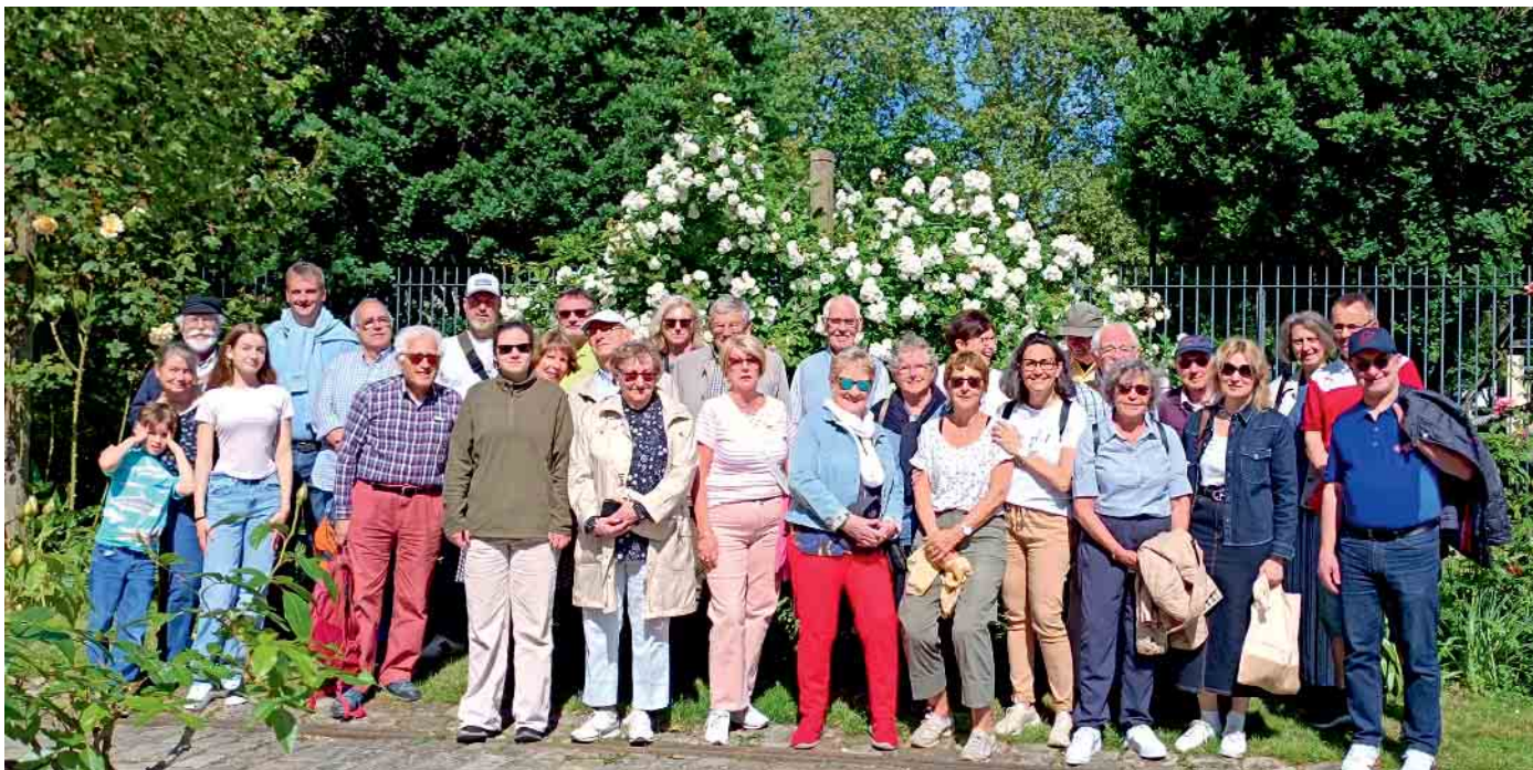
Die Gruppe im Rosengarten von Bercy.

Mitglieder des Vereins zur Förderung der Partnerschaft zwischen Bergneustadt, Châtenay-Malabry und Landsmeer e. V. nutzten das Himmelfahrtswochenende zu einem Besuch in der Partnerstadt Châtenay-Malabry.