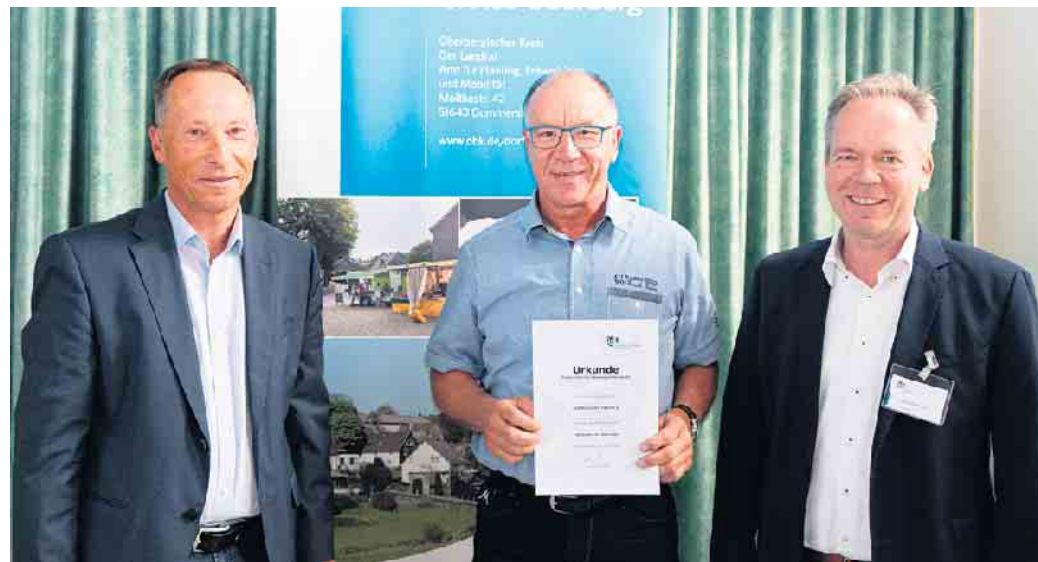
Der Förderbescheid für TUS Belmicke 1910 e. V.; Stadt Bergneustadt.