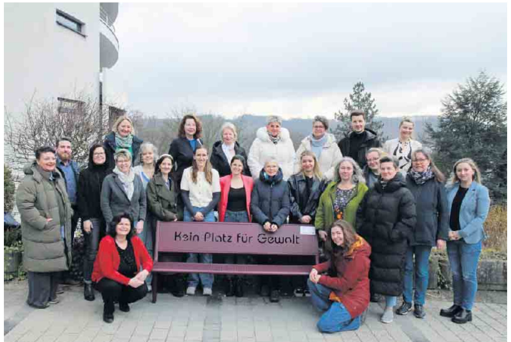
Das Netzwerk no - gegen Gewalt will mit der Motivbank ein sichtbares Zeichen setzen.

„Die violette Sitzbank lädt nicht nur zum Verweilen ein. Sie soll