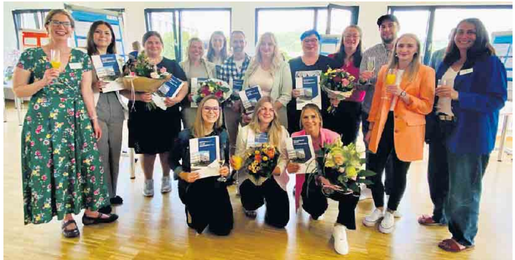
Mitarbeitende der AGewiS freuen sich mit den erfolgreichen Absolventinnen und Absolventen über deren Qualifikation als „Verantwortliche Pflegefachkraft“.