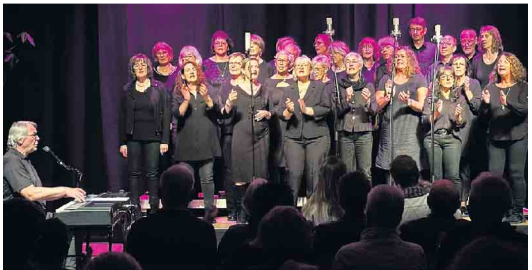
Oberberg Gospel Choir.

nennen, immer wieder bereichert durch neue Kompositionen, neue Instrumentationen, Arrangements und neue Stylistic.“ Besonders nach der Veröffentlichung der Aufnahme von „O Happy Day“ durch die „Edwin Hawkins Singers“ im Jahr 1969 wurde Gospelmusik etablierter Bestandteil der weltweiten Popmusik. Die Zusammenarbeit mit dem „Gospelurgestein“ Helmut Jost stellte sich als so fruchtbar heraus, dass der Wunsch entstand, das Projekt zu einer Dauer Einrichtung zu machen. Heute zählt der Chor gut 35 konzerterfahrene Sängerinnen und