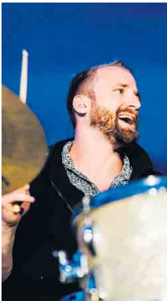
Ben Jost.

Sänger. In den letzten Jahren hat sich der Chor unter anderem auch durch Auftritte außerhalb des Oberbergischen Kreises in