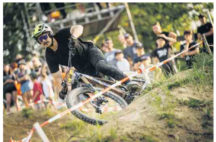
Erster E-Mountainbike-Worldcup auf deutschem Boden.

sowie -Trainings genutzt; mehr ist dem Verein aufgrund einer Lärmschutzverordnung nicht gestattet. Mit der neuen Strecke für (E-)Mountainbikes, die an dem Wochenende der Worldcup-Veranstaltung von internationalen