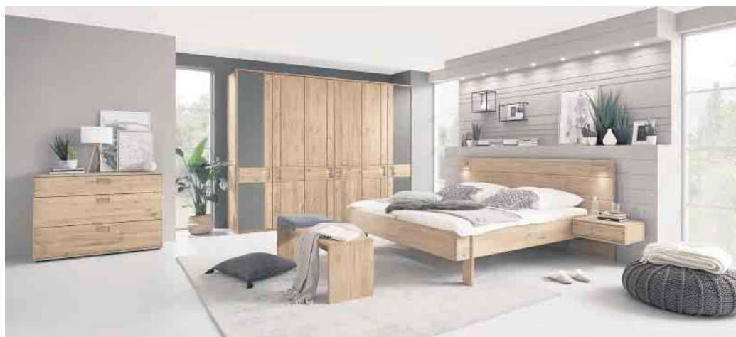
Auch Allergiker können dank Massivholzmöbeln aufatmen, denn das Holz besitzt eine antistatische Wirkung und zieht keinen Staub oder Schmutz an. IPM/Möbelwerke A. Decker

sowie lange Freude und Erholung im eigenen Massivholzbett. (IPM/RS)