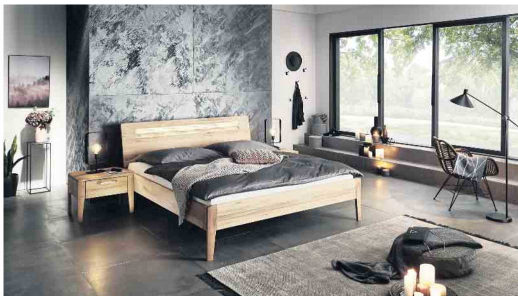
Natürliche Inhaltsstoffe wie ätherische Öle im Holz wirken beim Einatmen beruhigend auf den Körper und unterstützen diesen dabei, zur Ruhe zu kommen.