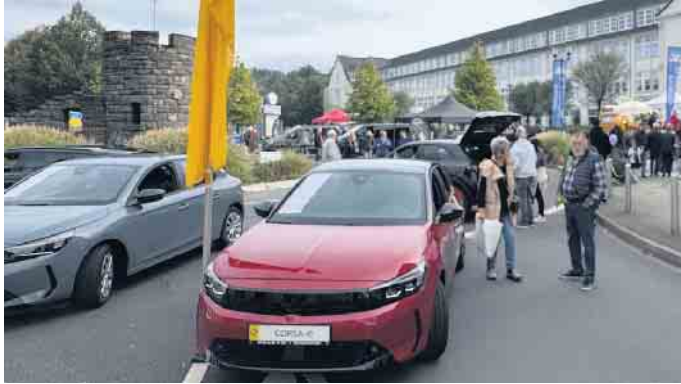
- Opel Ley begrüßt die Besucherinnen und Besucher am traditionellen Standort am Kreisel beim Rathausplatz.

lassen. Fachkundige Beratung und ein vielfältiges Angebot machen den Einkaufsbummel zum besonderen Erlebnis. Natürlich sind auch bewährte Partner wieder mit dabei: