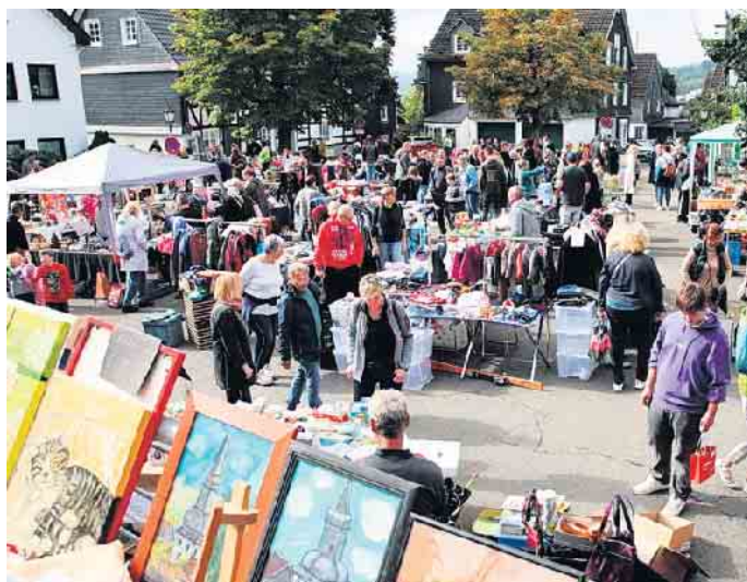
Trubel in der Altstadt von Bergneustadt.

Jägerhof-Genossenschaft lädt ein zu Flohmarkt, Kürbis- und Weinfest