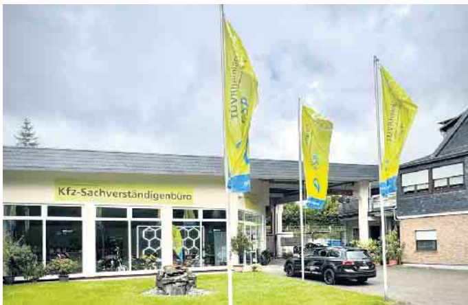
- Das Schadenzentrum Oberberg, seit April Partner von TÜV Rheinland, präsentiert sich erneut an der Kölner Straße neben Gießelmann. Hier gibt es kompetente Informationen rund ums Kfz - von Experten aus erster Hand.

Damit ist der Nyestädter Herbst ein Fest für alle Sinne: Musik, Shopping, Action, Informati-