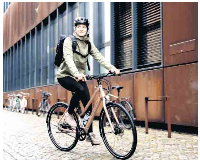
Ohne Stau zum Job: Gerade in Städten bietet sich das Rad als Alternative zum Auto an.