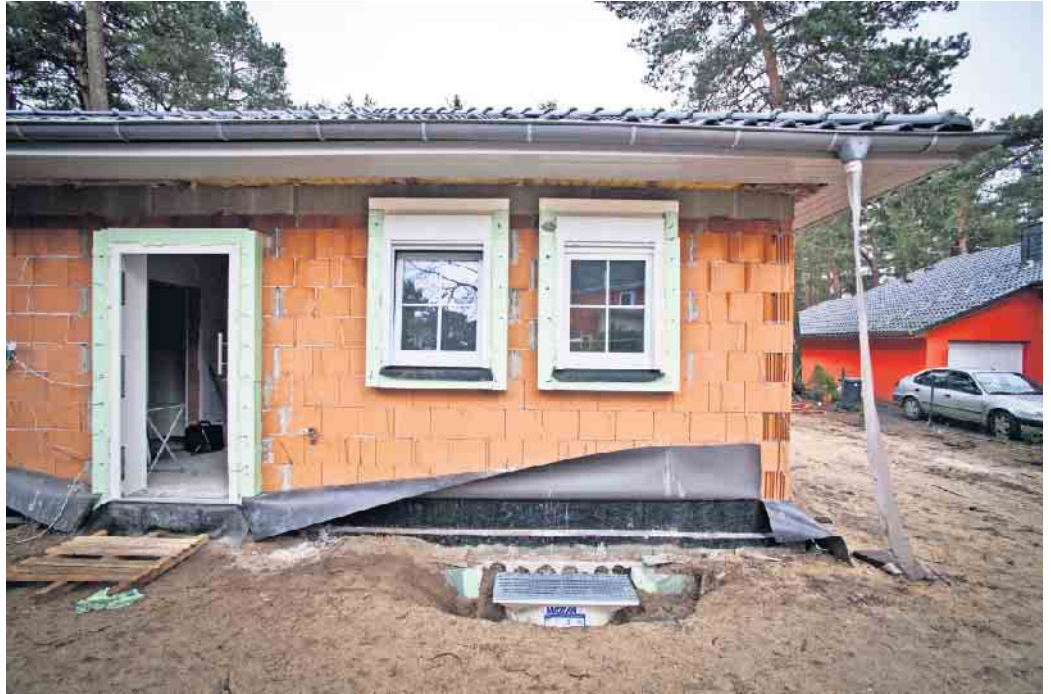
Ideal für ein selbstbestimmtes Leben in den eigenen vier Wänden bis ins hohe Alter: Wohnen auf einer Ebene.