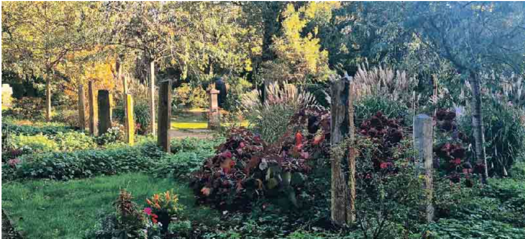
Friedhöfe als grüne Oasen in der Stadt - Gemeinschaftsgrabanlage Nordfriedhof Düsseldorf.