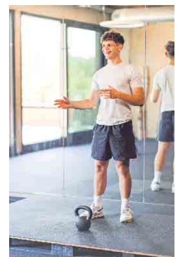
Das Hobby zum Beruf machen: Aufgrund der wachsenden Bedeutung der Zukunftsbranche Gesundheit und Fitness kann sich eine Qualifizierung in Berufen rund um Fitness- und Gesundheitstraining lohnen.

Unter www.dhfgp.de sind weitere Erfolgsgeschichten zu finden. (DJD)