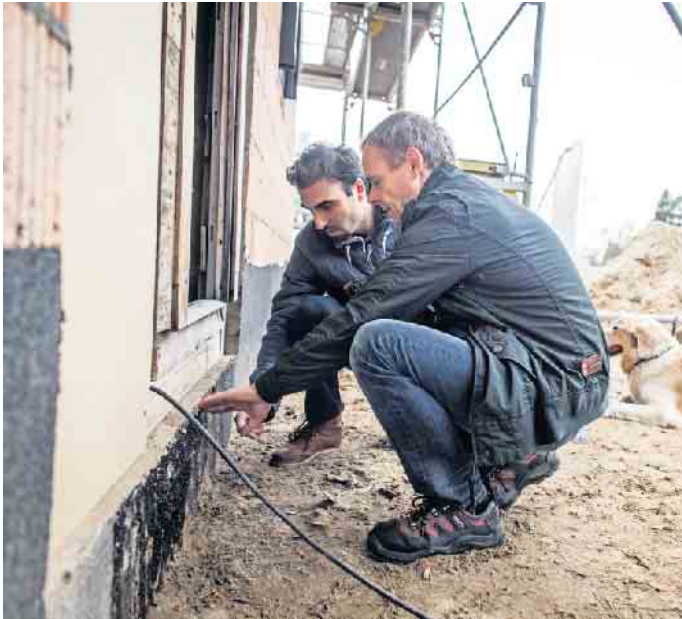
Wer bereits beim Bauen an Barrierefreiheit beispielsweise bei den Hauszugängen denkt, hat es später einfacher, das Haus an altersgerechte Bedürfnisse anzupassen.

winden. „Idealerweise legt man die Räume im Haus so an, dass eine oder zwei Personen im Alter auch alle wichtigen Bereiche - Wohnen, Schlafen, Körperpflege und Essen - auf einer Ebene unterbringen können“, so Stange. „Barrierefrei“ als Schlagwort in der Baubeschreibung genügt nicht Zu Vorsicht rät der BSB, wenn in Angebotsbeschreibungen für ein Haus Schlagworte wie „barrierefrei“, „altersgerecht“ oder „rollstuhlgerecht“ auftauchen. Die Begriffe sind nicht gesetzlich definiert und beschreiben keine verbindlichen Standards. „Es kommt immer auf die konkret in der Baubeschreibung genannten Details und Beschreibungen an“, erklärt