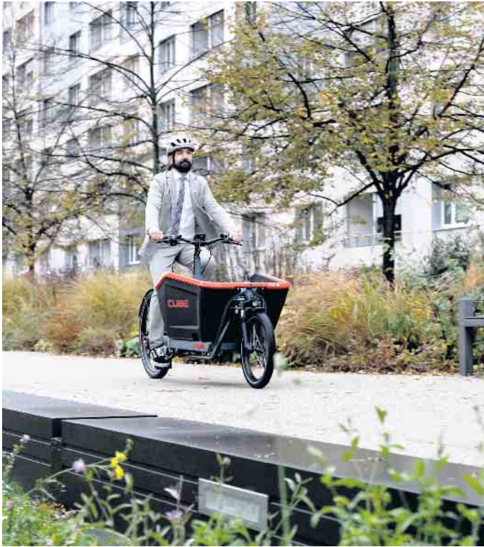
Erst zur Arbeit, dann zur Kita: Diensträder dürfen auch privat genutzt werden.