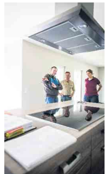
Eine großzügig geplante Küche bietet viel Komfort und macht es einfacher, später einmal Anpassungen für mehr altersgerechten Komfort vorzunehmen.

gangstür, die nicht erst im Alter, sondern auch für Kinderwagen die komfortablere Variante darstellt. Wo das nicht möglich ist, lassen sich Höhenunterschiede durch Rampen statt Treppenstufen über-