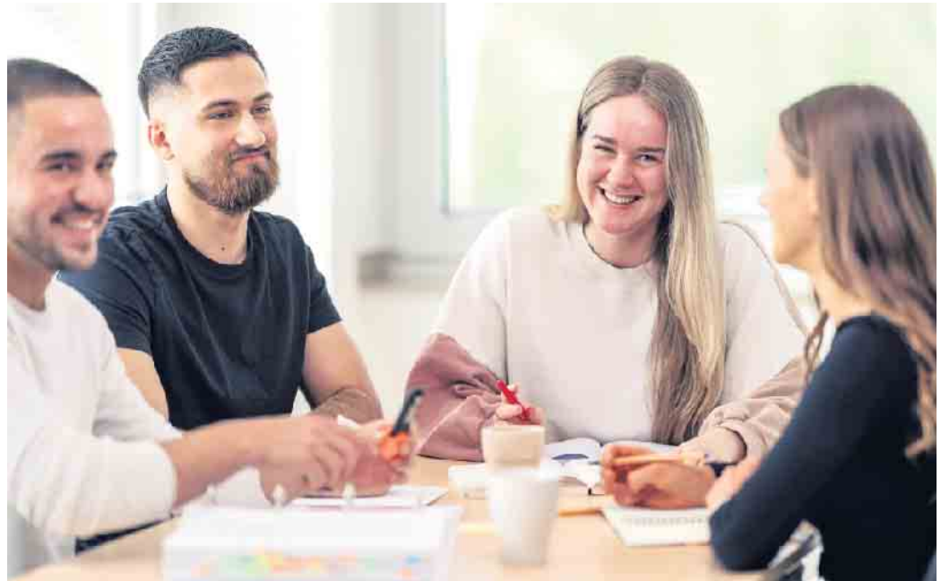
Die dualen Bachelor-Studiengänge bestehen aus einem Fernstudium in Kombination mit kompakten Lehrveranstaltungen.

Wer ein Studium im Bereich Prävention, Gesundheit, Fitness, Sport und Informatik mit einer betrieblichen Ausbildung kombinieren möchte, für den eignen sich beispielsweise die dualen Bachelor-Studiengänge an der staatlich anerkannten privaten Deutschen Hochschule für Prävention und Gesundheitsmanagement (DHfPG). Sie bestehen aus einem Fern-