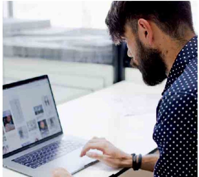
Eigene Qualifikationen, Berufserfahrungen und Stärken darf man online selbstbewusst darstellen.

plattformen tummeln sich viele heute ebenfalls in den eher privat ausgerichteten sozialen Medien. Doch auch hier sollten Bewerber seriös auftreten. Bilder, Beiträge, Kommentare und alles, was dem eigenen Ruf schaden könnte, sollte man tunlichst löschen - selbst wenn es sich buchstäblich um Jugendsünden handelt. Auf Facebook zum Beispiel kann man einschränken, wer einen auf Fotos markieren darf. Dadurch lassen sich unangenehme Überraschungen vermeiden. Unter adecgroup.de etwa gibt es viele weitere Tipps für das digitale Eigenmarketing und die Jobsuche. Noch ein Tipp, der auf alle sozialen Plattformen zutrifft: Ein systematisches Aufräumen der eigenen Kontaktliste schafft Klarheit und sorgt dafür, dass man selbst relevantere Beiträge angezeigt bekommt. (djd)