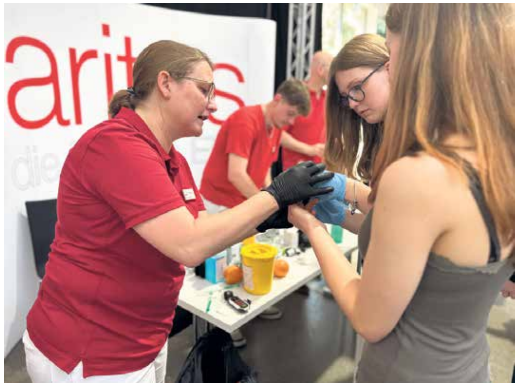
Schülerinnen der Gesamtschule Weilerswist am Stand der Caritas.

war in diesem Jahr ein mobiler Escape-Room, der im Rahmen der Kampagne #WTFuture Sozial- und Erziehungsberufe erlebbar mach-