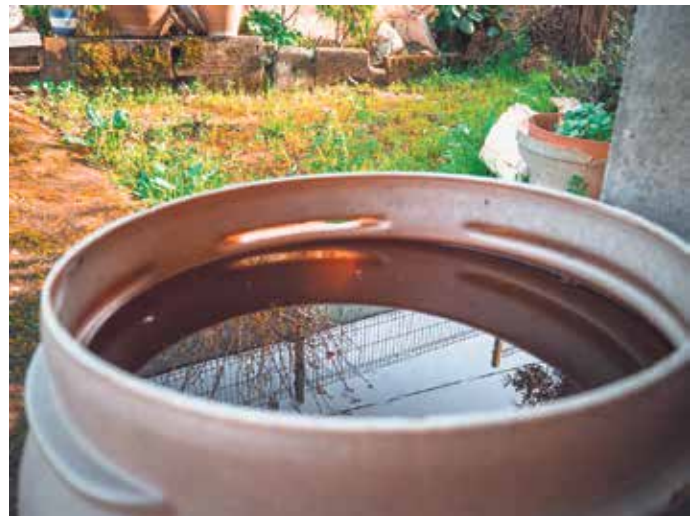
Wer Regenwasser sammelt, kann Trinkwasser einsparen.

dafür Regentonnen oder Zisternen. Gegossen werden sollte möglichst morgens oder abends, damit weniger Wasser verdunstet. Wassersparen gewinnt zudem durch den Klimawandel an Bedeutung. Längere Trockenperioden und sinkende Grundwasserstände beschäftigen inzwischen zahlreiche Regionen Deutschlands. Zwar gilt die Trinkwasserversorgung hierzulande weiterhin als stabil, dennoch werben Kommunen und Wasserversorger zunehmend für einen bewussteren Umgang mit der Ressource.