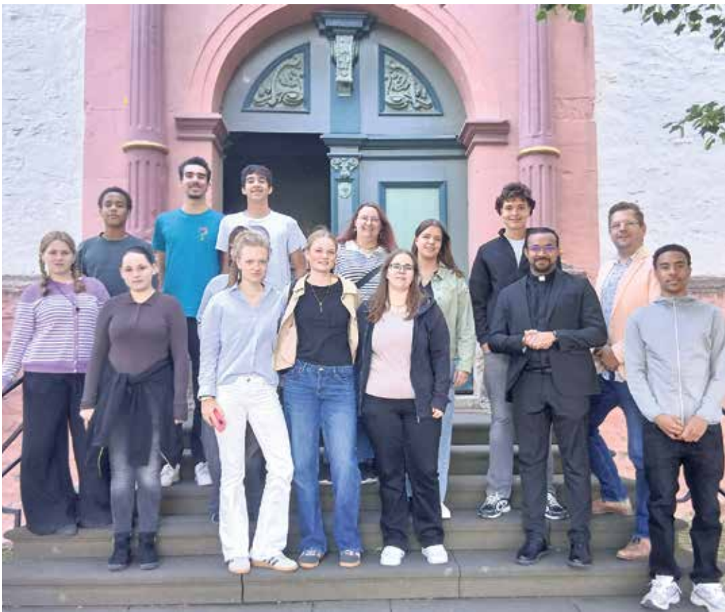
Die Jugendlichen, Betreuerinnen und Betreuer freuten sich vor der Jesuitenkirche Bad Münstereifel schon auf eine aufregende Reise zum Weltjugendtag nach Südkorea.

Abordnung aus Kommern übergab Spenden für Korea-Reise an Weltjugendtags-Truppe in Bad Münstereifel