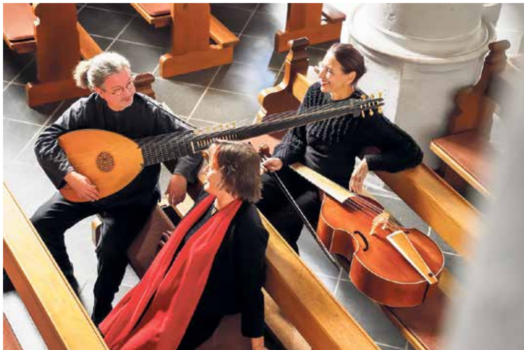
Ensemble favori.