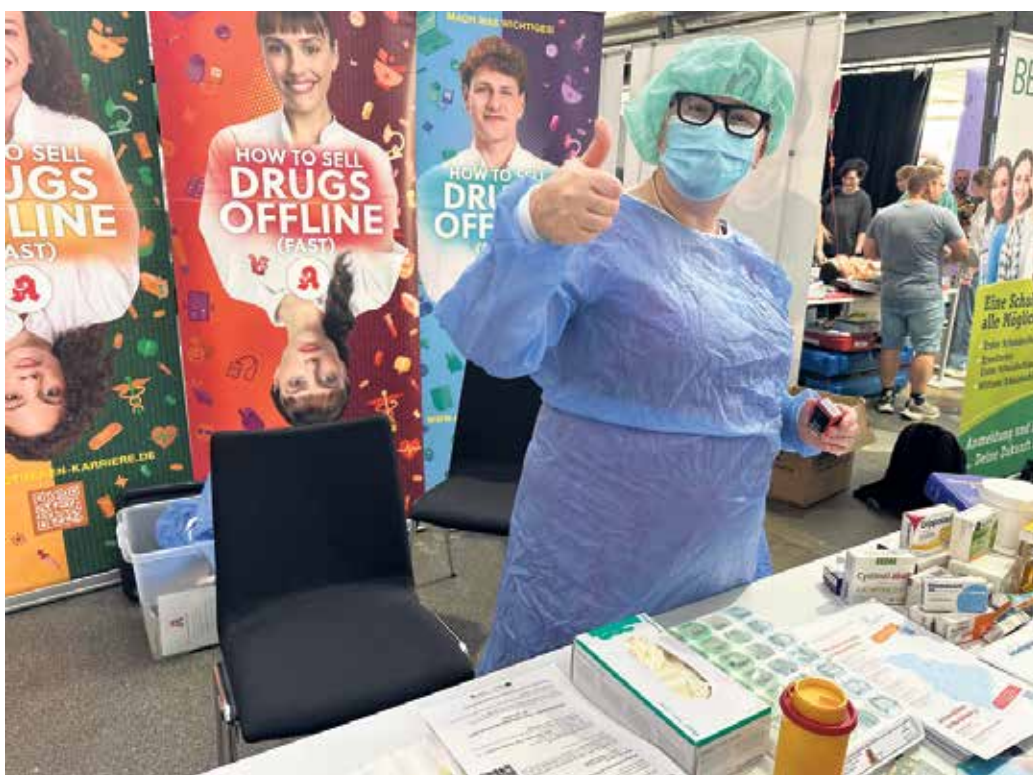
Auch die Apothekerkammer Nordrhein präsentierte sich auf der Gesundheitsberufemesse

Das interaktive Format machte Berufsorientierung zum Erlebnis: Die Teilnehmenden schlüpfen in die Rolle von Menschen auf der Suche nach einem sinnvollen Beruf. Eine geheimnisvolle Raumzeitbox mit einer Botschaft aus der Zukunft führte sie durch mehrere Stationen. Dort lösten sie gemeinsam Aufgaben, die Einblicke in verschiedene Bereiche der Sozial- und Erziehungsberufe gaben. Am Ende stand eine Botschaft, die den Bezug zur eigenen Zukunft der Jugendlichen herstellte.