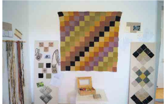
Bandweben (I.) und Weben mit dem Pin Loom, Decke aus pflanzengefärbter Dochtwolle.

Das seit 2006 existierende Handwebmuseum in Rupperath (Gemeinde Bad Münstereifel), das seit Schließung der Grundschule 1969 als Ausstellung der 1961 gegründeten „Werkgemeinschaft