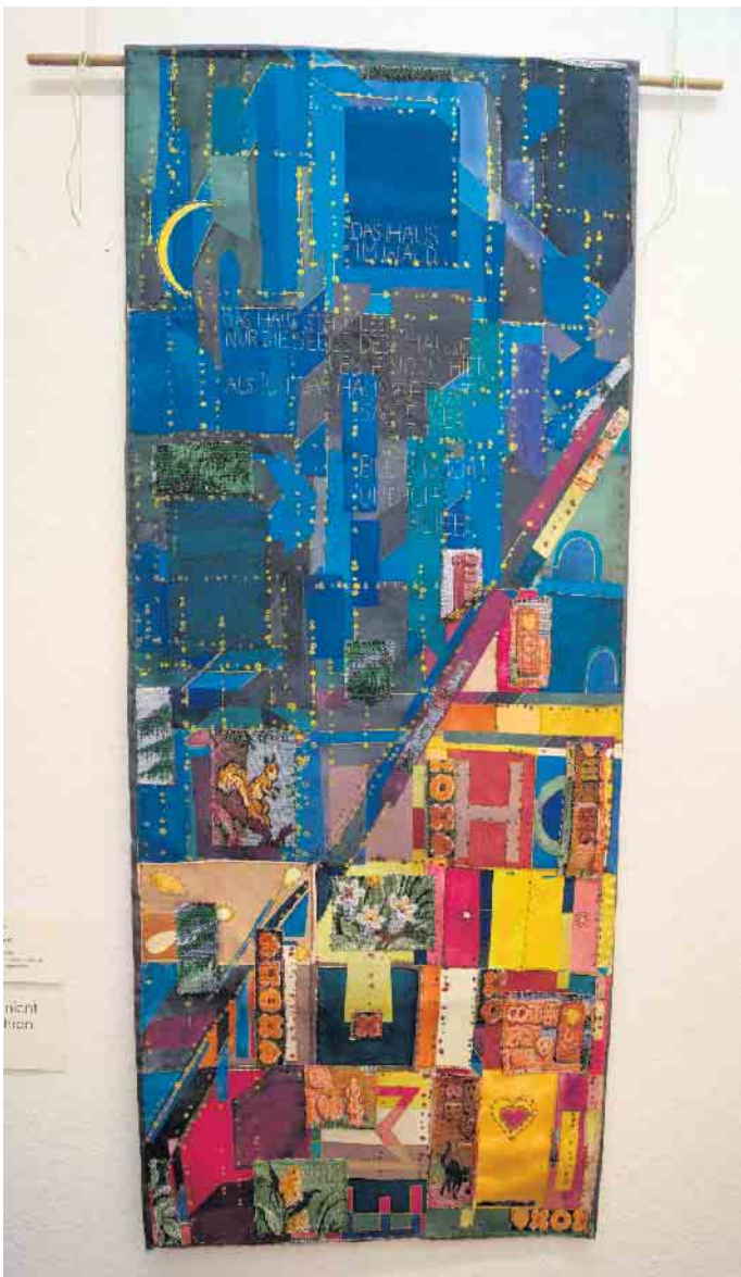
Haus im Wald: Seide, Baumwolle, Seidenmalerei, freie Stickerei, Appliqué, handgenäht

für Handwebkunst“ begann und bis 2003 bestand, zeigt die Geschichte der traditionellen Wollverarbeitung und Textilherstellung. Auf zwei Etagen (Erdgeschoss und 1. Stock) des alten Schulgebäudes werden die verschiedenen Arten und Epochen des Handwebens an Hand von ausgestellten original historischen Webstühlen, Webrädern, weiteren benötigten Werkzeugen sowie den verschiedenen Stufen der Wollverarbeitung bis hin zu fertigen Kleidungsstücken gezeigt.