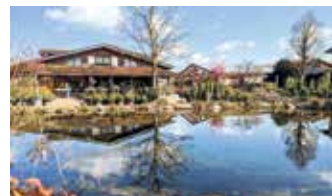
Das 3,5 Hektar große Firmengelände in der Keggenriede 9a ist wie ein großer Landschaftspark.