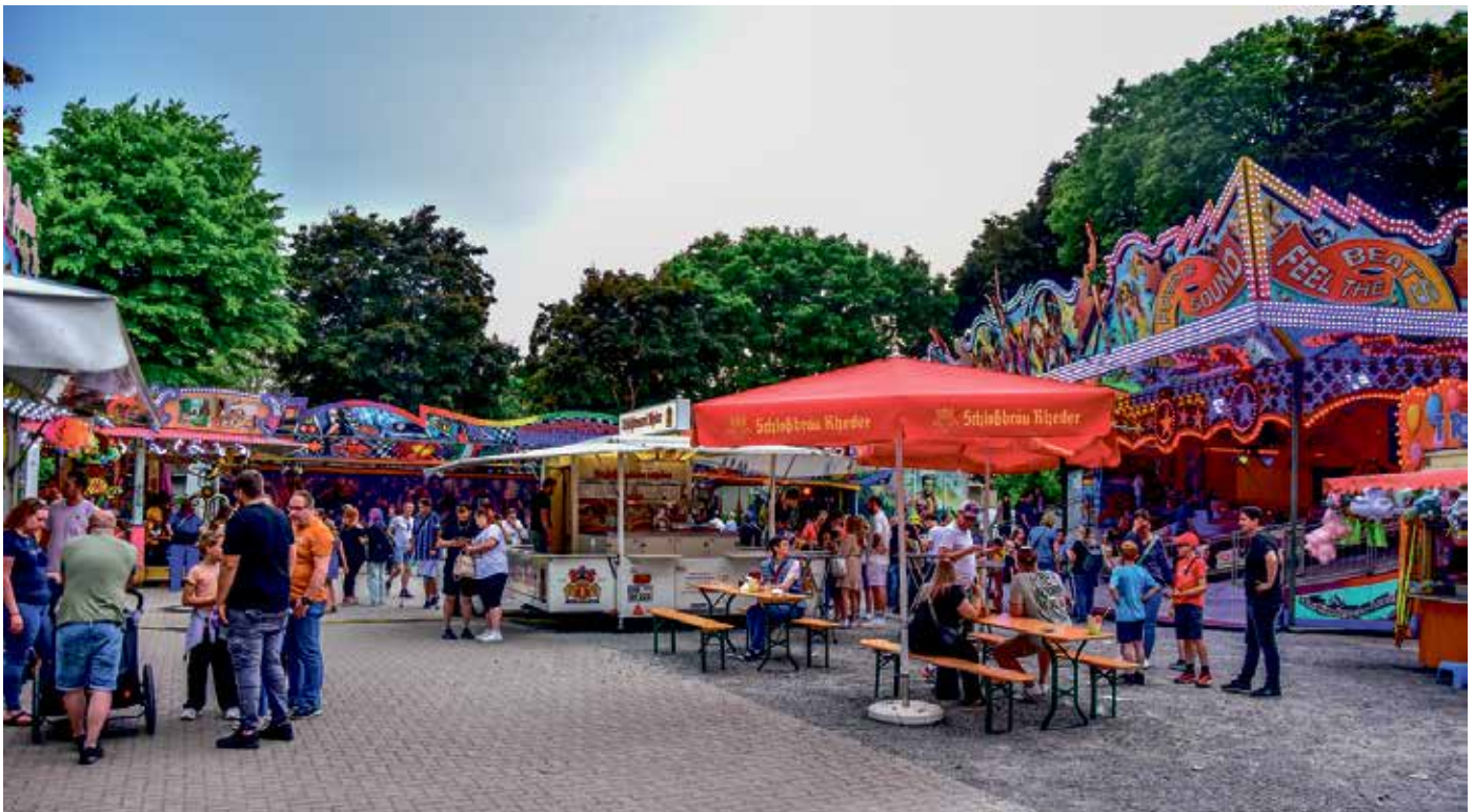
Die Frühlingskirmes startet bereits am Donnerstag, 14. Mai auf dem Feuerteich-Parkplatz.

Der Werbering und die Stadt Brakel sowie alle Organisatoren und Beteiligten freuen sich auf das bevorstehende Brakeler Stadtfest und wünschen allen Gästen einen erlebnisreichen Besuch in der Nethestadt.