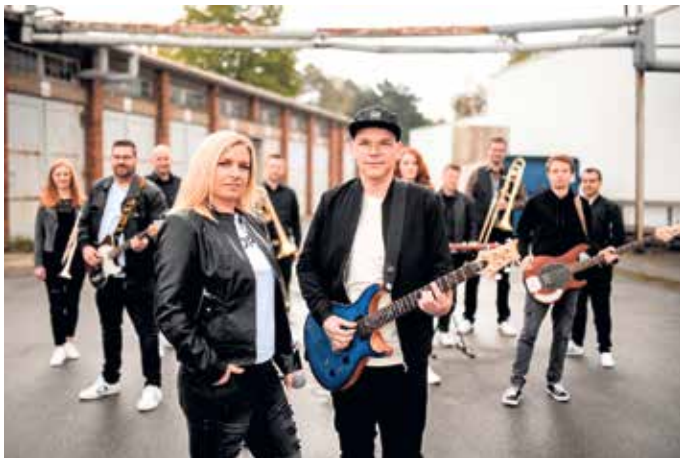
Ab 20 Uhr heizt die „Royal-Stage-Army-Band“ auf der Bühne „Am Thy“ ein.

Ab 20:00 Uhr bringt die 11-köpfige Band „Royal Stage Army“ die Bühne zum Beben. Mit bekannten Hits aus Pop, Rock, Soul, Funk und