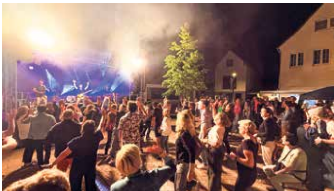
Auch im Jahr 2025 herrschte vor der Bühne „Am Thy“ tolle Partystimmung.

Neben dem tollen Bühnenprogramm lädt auch die gesamte Brakeler Innenstadt wieder zu einem Besuch ein. Hier erwartet die Stadtfestgäste neben dem „verkaufsoffenen Sonntag“ ein vielfältiges Angebot: