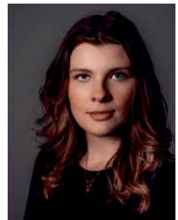
Die Fotografin Claudia Warneke fertigte im Rahmen des Photoshootings unvergessliche Portraitaufnahmen.