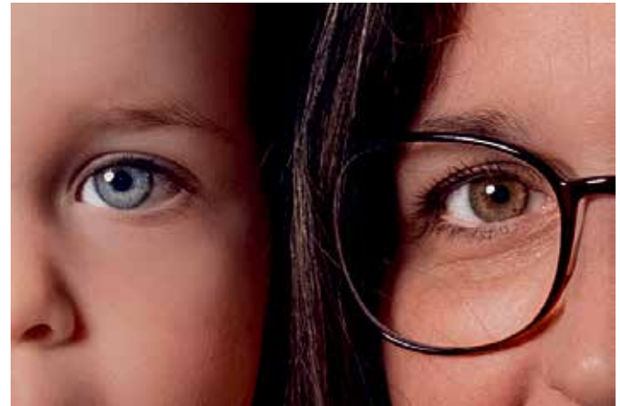
Die Fotografin unterstützte die Aktion und fertigte Fotos der Teilnehmerinnen.

werden, so die Vorsitzende. Alle Informationen seien ebenfalls auf der Internetseite des Vereins www.foerderverein-frauenhaus-hoexter.de zu finden.