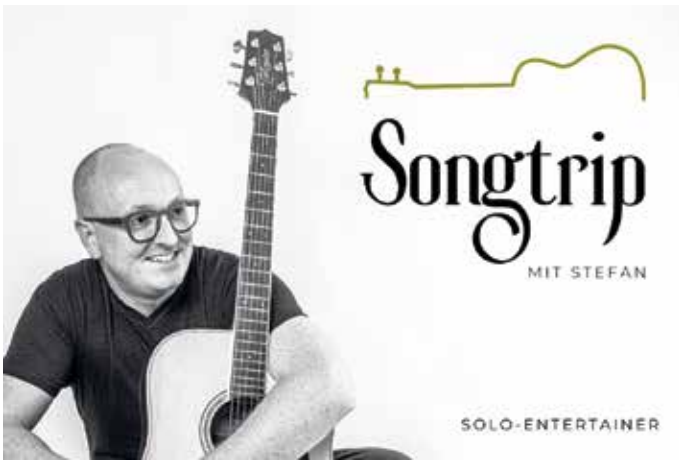
„Songtrip mit Stefan“ - ab 18 Uhr auf der „Thy-Bühne“.

Brakeler Stadtfestes ein abwechslungsreiches Bühnenprogramm „Am Thy“, im Wechsel treten auf: