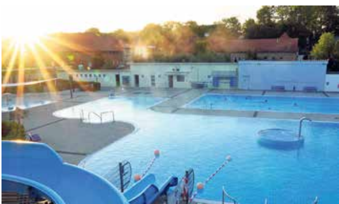
Ab Montag, 18. Mai 2026 startet das Sommer-Bad in die Saison.