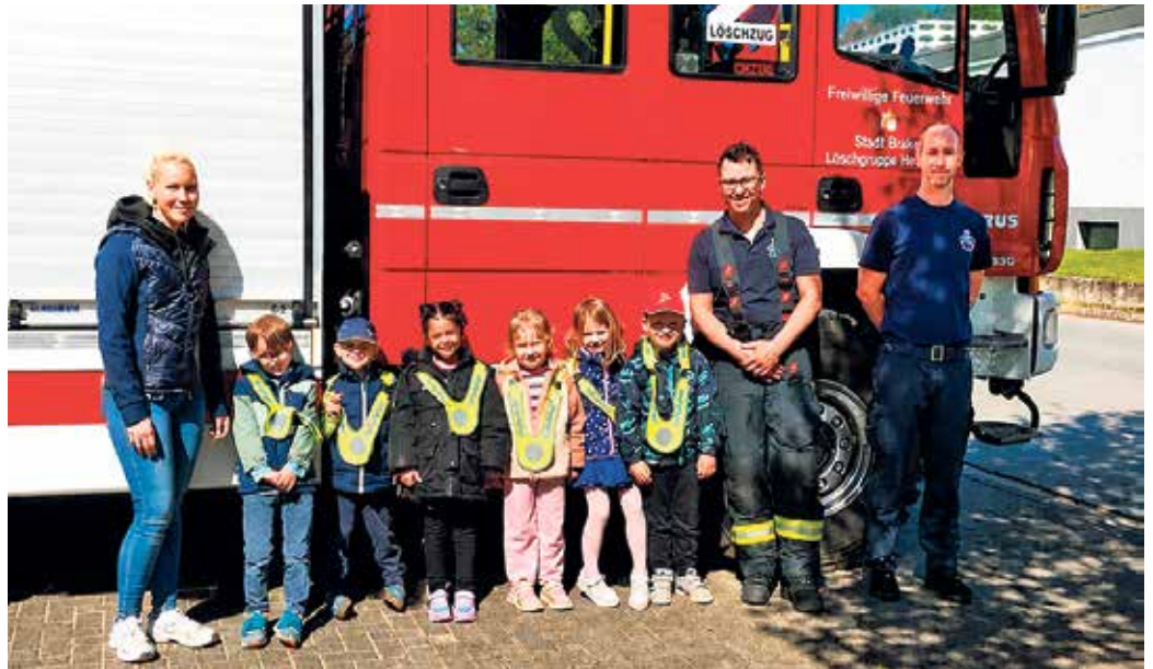
Die Kita Hembsen zu Besuch bei der freiwilligen Feuerwehr Brakel in Hembsen.

Von der Schutzkleidung über die Ausrüstung bis hin zu den Einsätzen, vieles durften die Kinder nicht nur anschauen, sondern auf Wunsch sogar selbst ausprobieren. Neugierig hörten sie zu und stellten zahlreiche Fragen. Besonders eindrucksvoll war die Demonstration eines Rauchmelders. Die Kinder erfahren, wie wichtig dieser im Alltag ist, wie er im Ernstfall klingt und wie man sich bei einem Brand richtig verhält. Ein weiteres Highlight war der Blick in das Feuerwehrauto. Staunend entdeckten die Kinder die vielfältigen Geräte und Hilfsmittel. Sie durften das Sprechen über Funkgeräte ausprobieren und mit einer