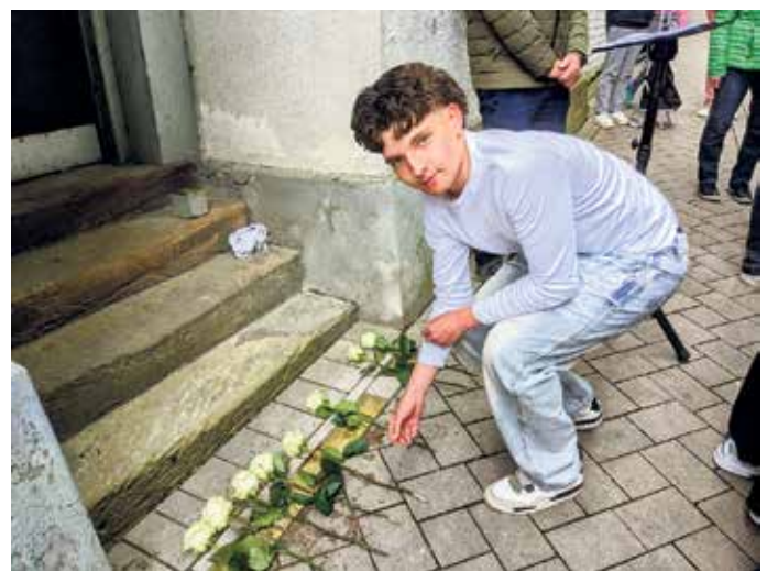
Zehn Stolpersteine vor dem Haus erinnern an insgesamt zehn Angehörige der Brakeler jüdischen Familie Stein.