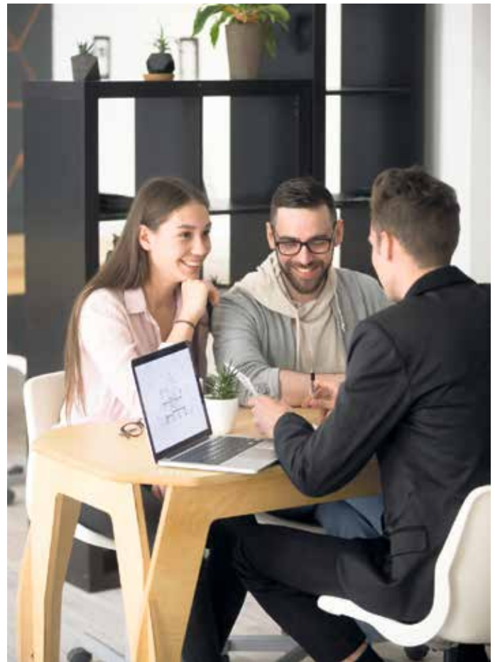
Unabhängige Beratung im Vorfeld eines Eigenheimprojekts gibt mehr Sicherheit bei der Finanzplanung und der Entscheidung für den richtigen Baupartner.

Unterstützung nutzt, reduziert Risiken und kann sein Vorhaben deutlich entspannter begleiten.“ (DJD).