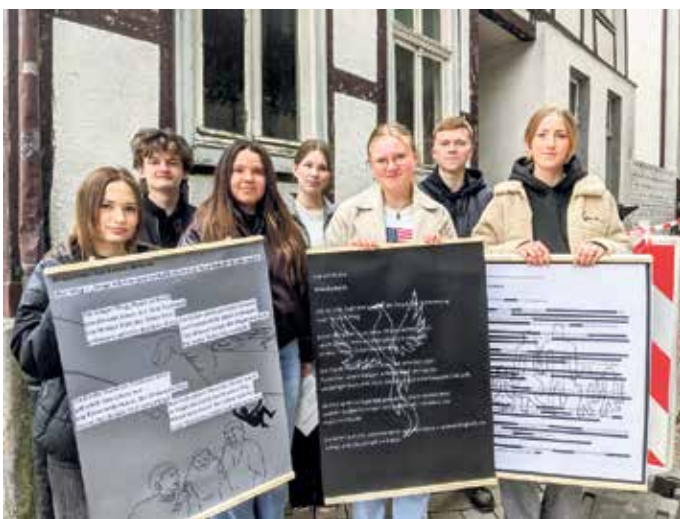
Schülerinnen und Schüler der Gesamtschule Brakel gestalten die Gedenkfeier.