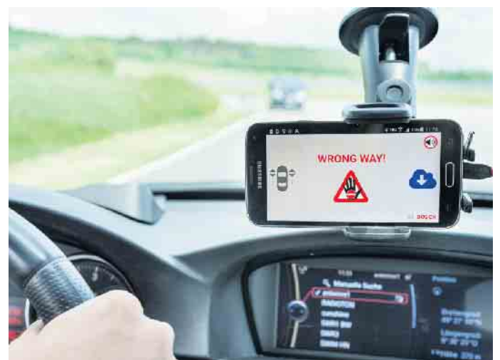
Im Fall der Fälle schlägt das Cloudsystem Alarm, die Falschfahrerwarnung ist innerhalb von zehn Sekunden möglich.