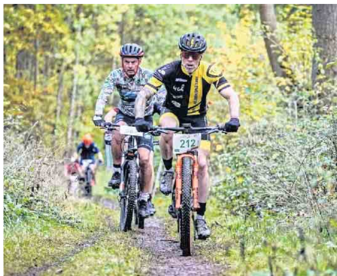
EXD MTB-Part.

Infos zu Distanzen und dem Zeitplan: www.e-xd.de