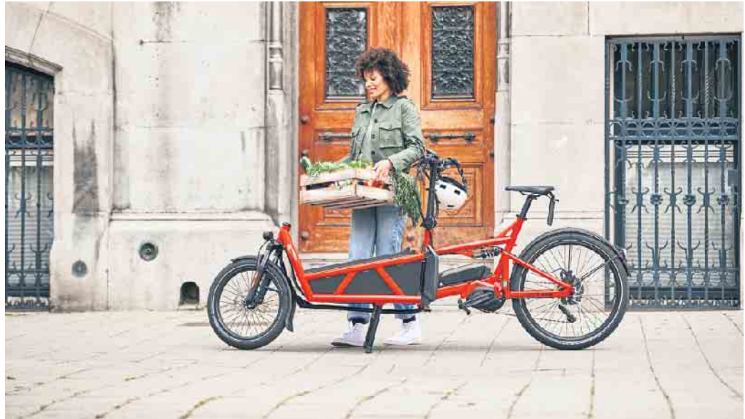
Lastenräder gehören in vielen Städten zum Alltagsbild. Mit elektrischer Unterstützung ermöglichen E-Cargobikes den bequemen Transport zum Beispiel von Wocheneinkäufen.

Wichtig ist gerade bei elektrischen Lastenrädern ein leistungsstarker Akku, um angesichts des Eigenge-