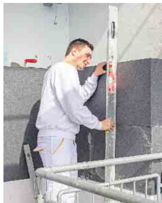
Dämmen durch den Profi: Die fachgerechte Ausführung stellt Langlebigkeit und Wirksamkeit des Wärmeschutzes sicher.

effiziente Gebäude (BEG) Zuschüsse von bis zu 25 Prozent der Gesamtinvestitionen möglich. Beispielsweise unter www.mit-sicherheit-eps.de gibt es dazu viele weitere Informationen und Tipps für Hauseigentümer. Die Dämmung mit Hartschaum wie expandiertem Polystyrol (EPS) zählt zu den seit Jahrzehnten bewährten Verfahren. Das Material verbindet eine hohe Dämmleistung mit leichter Verarbeitbarkeit und geringem Gewicht - wichtig gerade für die Altbauanierung. Zudem ist das Material langlebig, sicher und dank heutiger Technik nach Jahrzehnten der Nutzung anschließend recycelbar. (djd)