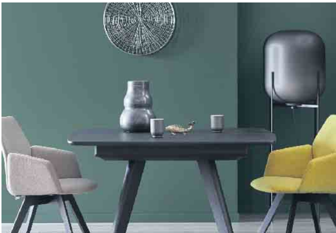
Der Dschungel in den eigenen vier Wänden: Der Name dieser Trendfarbe für die Wand ist hier Programm.