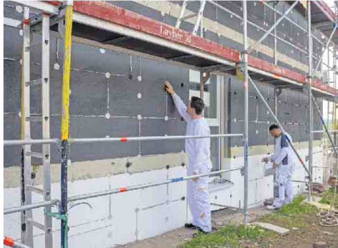
Angesichts hoher Energiepreise amortisiert sich das energetische Sanieren noch schneller.

Planung und Dämmung durch Fachhandwerker Als Voraussetzung für eine dauerhaft wirksame Dämmung gilt, dass die Sanierung von erfahrenen Fachbetrieben geplant und ausgeführt wird. Energieberater begleiten den Prozess zusätzlich und können einen individuellen Sanierungsfahrplan aufstellen, der exakt für die vorhandene Bausubstanz passende Empfehlungen abgibt. Damit sind aus der Bundesförderung für