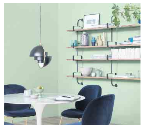
Mehr Mut zur Farbe: Das kreative Kombinieren von Wandfarben, Bödenbelägen und Möbeln verleiht dem eigenen Zuhause mehr Ambiente.

Wer hingegen kräftige Farbakzente setzen will, ist mit den „fruchtigen“ Tönen Amarena, Mango oder dem satten, beruhigenden Blau von Blueberry in der passenden Einrichtungswelt unterwegs. Die 32 Trendfarben aus der Kollektion von Schöner Wohnen-Farbe ermöglichen das Einrichten im eigenen Stil. Für ein unkompliziertes Verarbeiten und Verschönern sind die Dispersionsfarben fertig gemischt in unterschiedlichen Gebindegrößen im Fachhandel sowie in vielen Baumärkten erhältlich. Unter www.schoener-wohnen-farbe.com etwa gibt es mehr Details und Videos mit praktischen Tipps für das eigene Zuhause. Neben der Optik sind ebenso die inneren Werte wichtig. Daher enthalten die Wandfarben keine Konservierungsstoffe oder Lösemittel, sind für Allergiker geeignet und tragen das renommierte Umweltzeichen Blauer Engel. (djd)