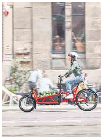
Die Kids zur Kita bringen oder den Einkauf nach Hause transportieren: E-Cargobikes sind eine nachhaltige, umweltfreundliche und kostengünstige Alternative zum Auto.

wichts und der transportierten Lasten eine hohe Reichweite zu ermöglichen. Praktisch ist zudem die Navigationsfunktion. Das vernetzte Display navigiert entspannt zum nächsten interessanten Ort, egal ob zu Ausflugszielen oder einem neuen angesagten Café. Praktisch sind dabei die Reichweiten-Hinweise, die automatisch berechnen, ob das Wunschziel mit elektrischer Unterstützung noch bequem erreicht werden kann. (djd)