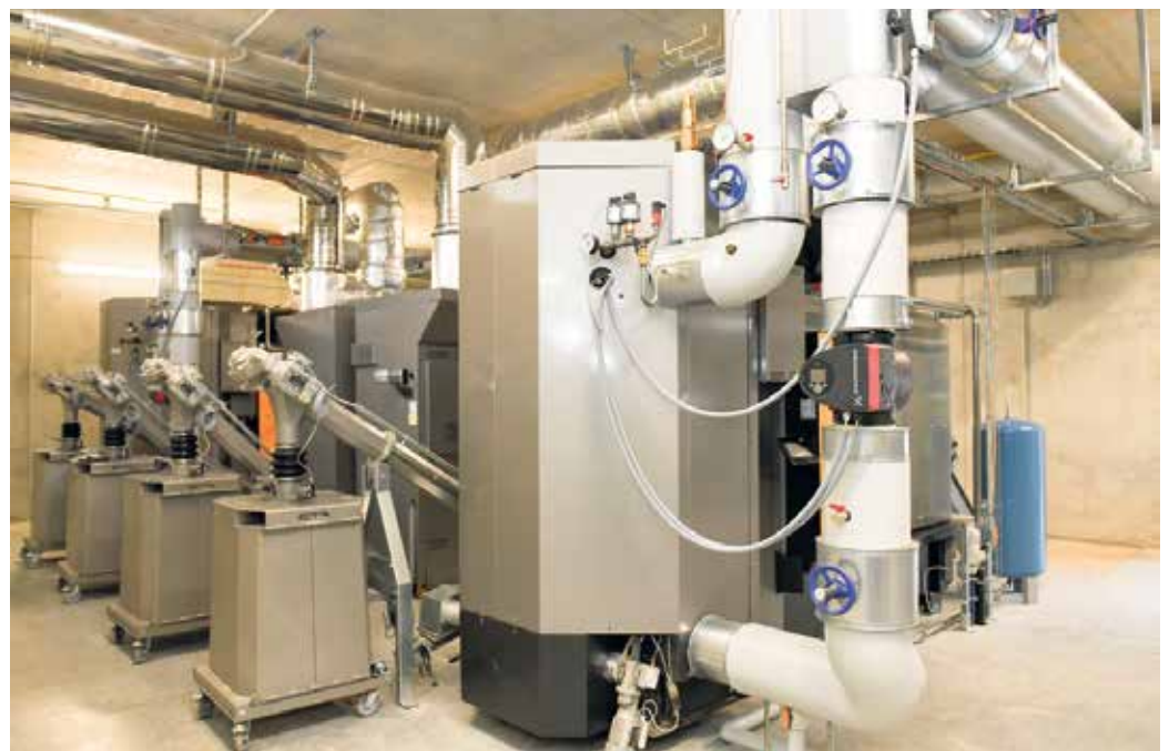
Holzenergiewerke, hier ein Projekt der Holz Energie Regio AG, können in Zukunft eine wichtige Rolle im Zuge der Wärmewende spielen.