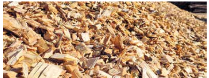
Lediglich Holzreste, wie hier Hackschnitzel, werden energetisch genutzt.