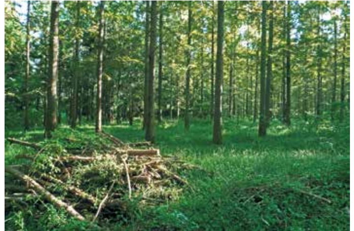
Wärme aus dem Wald: Holz ist eine erneuerbare Ressource und weist eine neutrale Klimabilanz auf.

Ein häufiges Vorurteil lautet, dass Bäume allein für die Energiegewinnung gefällt würden. Ein Irrtum, denn stattdessen greift das ökonomisch und ökologisch sinnvolle Prinzip der Kaskadennutzung. Hochwertiges Stammholz wird primär stofflich genutzt, zum Beispiel für Möbel oder den Hausbau. Erst danach folgt die energetische Nutzung. In regionalen Holzenergiewerken kommen meist Hackschnitzel zum Einsatz, hierfür werden Resthölzer oder auch Schadholz verwendet. Das Verfahren bietet noch viel Potenzial, insbesondere für die kommunale Wärmeplanung: Als Basis für Wärmenetze können die Anlagen ganze Städte und Dörfer oder Industrieareale zuverlässig und nachhaltig versorgen. Unter http://www.fachverband-holzenergie.de etwa finden sich weitere Einblicke und technische Hintergründe. (DJD)