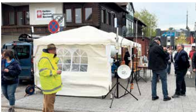
Zahlreiche Antennen sorgten für eine sichere Kommunikation in Pavillon und Funk-Container.

cking, der unter der Telefonnummer 02471-3105 oder per E-Mail an df3ed@darc.de erreichbar ist.