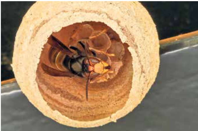
Ein etwa tennisballgroßes Embryonalnest der Asiatischen Hornisse, das vor wenigen Tagen in Kirchheim entdeckt wurde.

Frühe Nestfunde im Kreis Euskirchen deutlich gestiegen - UNB ruft zur Meldung von Hornissensichtungen auf