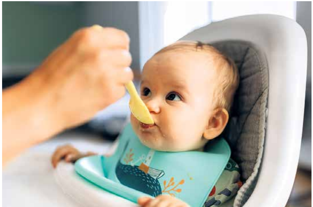
Baby sitzt im Hochstuhl und wird mit Brei gefüttert.

Welchen Brei sie zu welcher Tageszeit füttern, können Eltern frei ent-