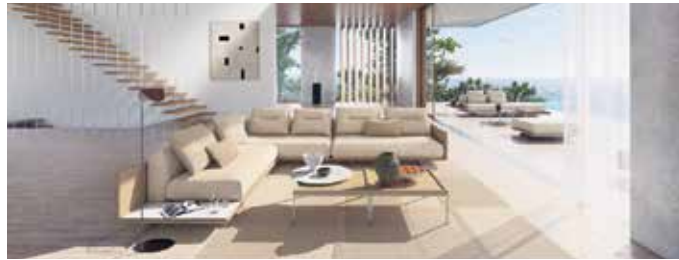
Nahtloser Übergang vom Innen- zum Außenbereich: Das moderne Loungesofa macht sich im Wohnzimmer wie auf der Terrasse gleichermaßen gut - dann mit einem Gestell aus Edelstahl und speziellen Outdoorstoffen.