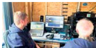
Die Satelliten-Bodenstation im Funk-Container fand großes Interesse.

Der DARC-Ortsverband Rureifel bietet kontinuierlich einen Amateurfunk-Lehrgang zur Vorbereitung auf die Lizenz-Prüfung an. Vorkenntnis-