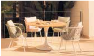
Sommerliches Flair: Der Säulentisch im Retrostil und die Aluminiumstühle mit den abgerundeten, kordelbespannten Lehnen bieten viel Komfort.

Runde Säulentische, bequem gepolsterte Stühle mit Kordelbespannung und individuell planbare Outdoorküchen prägen die neue Außensaison