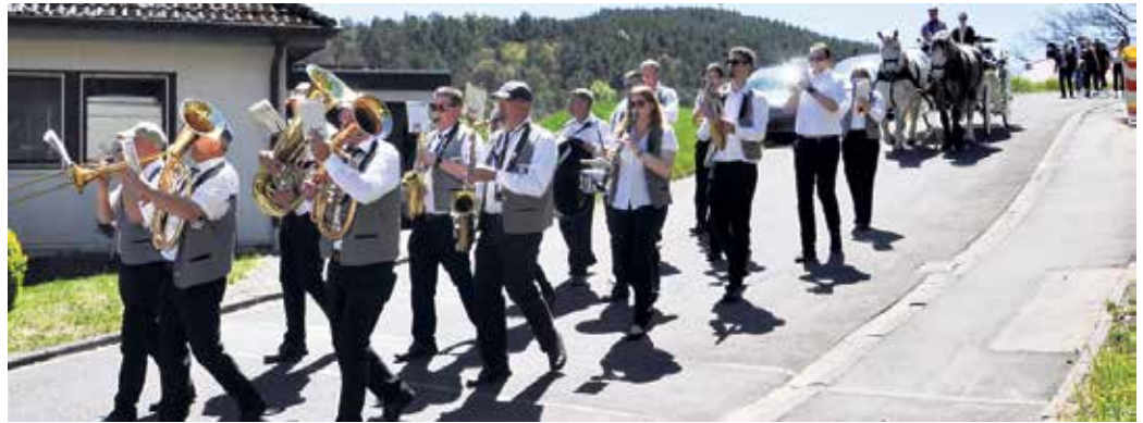
Die Musikkapelle Kall schritt auf dem Weg zur Maikönigin dem bunten Umzug voran.