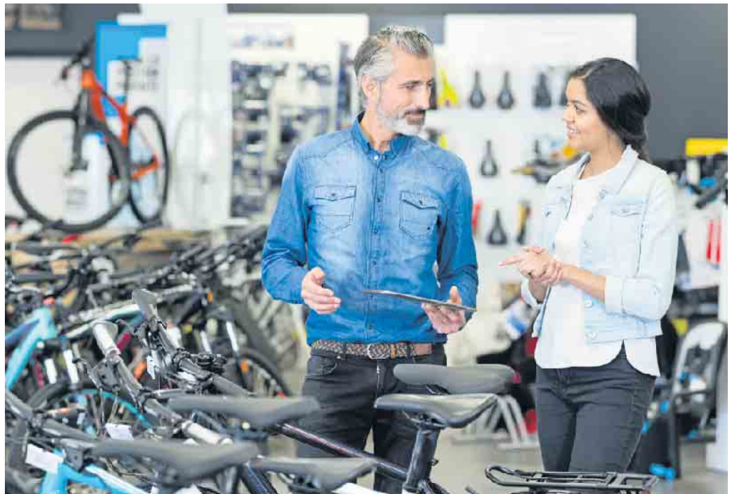
Beim Fahrrad stößt der Onlinekauf an Grenzen: Eine gute Beratung im Fachhandel ist durch nichts zu ersetzen.