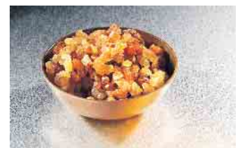
Myrrhe kann die Darmbarriere stabilisieren.

„Die Behandlung richtet sich aktuell in erster Linie nach den Beschwerden der jeweils vorliegenden Erkrankung“, erklärten die Expert:innen bei ihrem Treffen in Frankfurt. Dabei solle den Patient:innen klar gesagt werden: „Eine instabile Darmbarriere ist kein eigenständiges Krankheitsbild, sondern als möglicher Mitauslöser von Erkrankungen zu sehen.“ Da eine erhöhte Durchlässigkeit aber durchaus auch Beschwerden wie z. B. Durchfälle verursachen könne, sei bei einer erkannten Schädigung eine Stabilisierung der Darmbarriere anzustreben. Dies kann z. B. durch den Einsatz einer Pflanzenarznei mit Myrrhe erreicht werden, die seit mehr als 60 Jahren erfolgreich zur unterstützenden Behandlung von Durchfall, Blähungen und Darmkrämpfen eingesetzt wird. (akz-o)