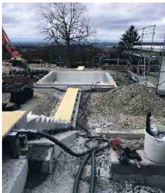
Ein Pool entsteht.

Da es keinen Ausbildungsberuf Schwimmbadbauer gibt, arbeiten in der Poolbranche Fachkräfte mit unterschiedlichen Qualifikationen, beispielsweise: Mechatroniker, Sanitär-/Heizung-/Klima-Fachleute, Verfahrenstechniker, Elektriker, Anlagenbauer, Schreiner und Ingenieure. Sie widmen sich der Erfüllung von Poolräumen - und haben dabei selber traumhafte Berufsaussichten.