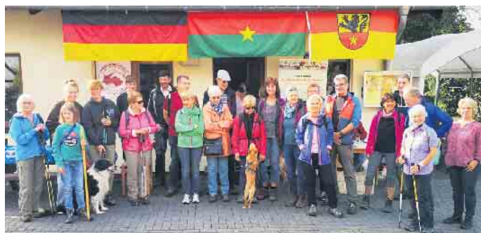
Die Wanderung für Piéla gehört fest zum Jahresprogramm des Bad Münstereifeler Partnerschaftsvereins.

Der Partnerschaftsverein lädt Interessierte und Unterstützer dazu ein, am Sonntag, 10. September, an einer etwas sieben Kilometer langen Rundwanderung um Rupperath teilzunehmen. Treffen ist um 10 Uhr an der dortigen Alten Schule. Wer mitgehen möchte, wird um Spenden gebeten. Wegen der aktuellen Situation vor Ort soll das Geld einerseits für die Flüchtlingshilfe genutzt werden, andererseits werden Nahrungsmittel dringend benötigt. Im Anschluss an die Wanderung können sich die Teilnehmer an ei-