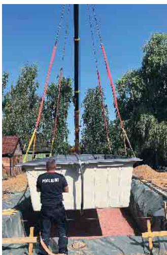
Ein Becken findet seinen Platz.