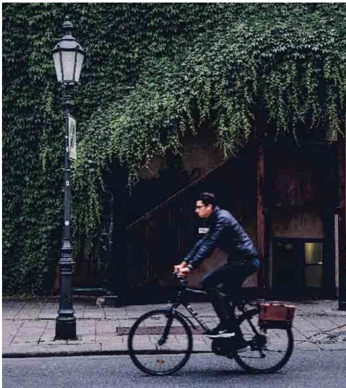
Volle Dröhnung: Auf keinen Fall darf man mit aufgesetzten Kopfhörern und hoher Lautstärke am Straßenverkehr teilnehmen.

Ohren auf im Straßenverkehr! Nicht nur gutes Sehen ist dort wichtig, auch um sich als Autofahrer, Radler oder Fußgänger sicher zu orientieren, ist das Gehör wichtig.