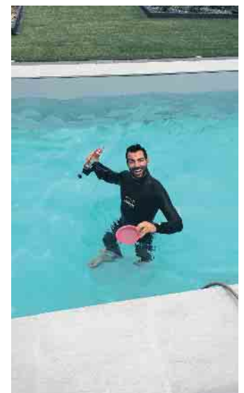
Wasserspaß bei der Arbeit.

Immer wichtiger wird zudem, sich mit Energieeffizienz im Pool auszukennen. Schließlich will der Kunde von heute so ressourcenschonend wie möglich schwimmen. Und Poolbauer wissen, wie man alternative Energiequellen nutzt, Wärme bewahrt und Wasser spart.