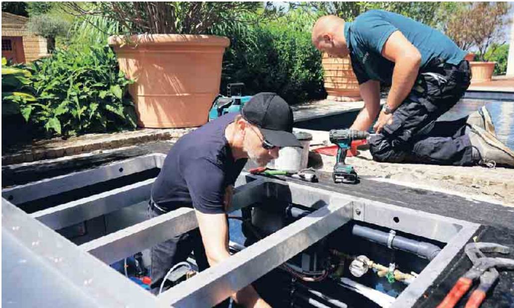
Arbeiten am Technischacht.

Gibt es einen Beruf, in dem man Träume erfüllen kann? In dem individuelle Beratung genauso gefragt ist wie handwerkliches Können und ein Gespür für Ästhetik und Design? In dem man Werte schafft, die für andere den „Himmel auf Erden“ bedeuten? Schwimmbadbauer ist so ein Beruf - vor allem, wenn es um den Bau privater Pools geht. Hier sind kreative Köpfe am Werk, die die Wellnesswünsche ihrer Kunden wahr werden lassen. Schwimmbadbauer schaffen Entspannungsoasen, Urlaubsorte ohne Anreise oder schlicht Wasserspaß vor der Haustür. Wer das beherrscht, ist ein Allroundtalent. Schließlich müssen Poolexperten umfassendes Fachwissen haben. Beckenbau und Bauphysik sind ebenso gefragt wie Wärmegewinnung und Wasseraufbereitung. Oder anders gesagt: Von A wie Anlagentechnik bis Z bis Zukunftstechnologien ist alles dabei.