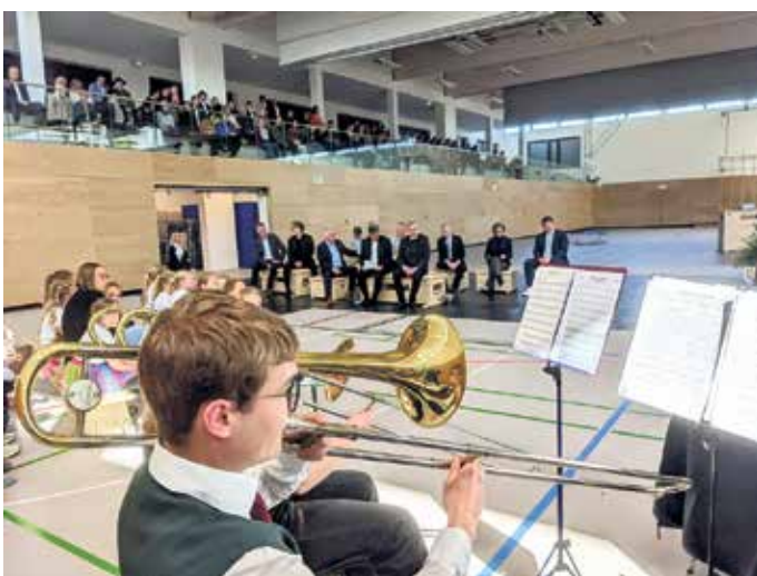
Das Jugendorchester des Musikvereins sorgt für den musikalischen Rahmen.