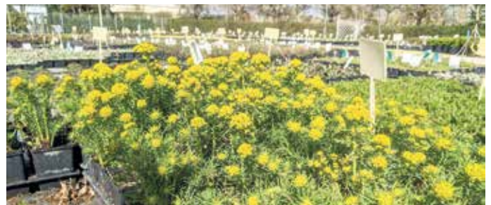
Der Betrieb Borgentreicher Grünbau hat die größte Staudenzucht der Region.