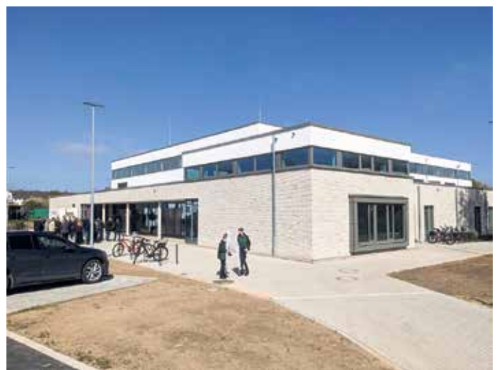
Borgentreich feiert die offizielle Einweihung der neuen Multifunktionshalle am Standort der alten Dreifachsportalle am Schulzentrum.