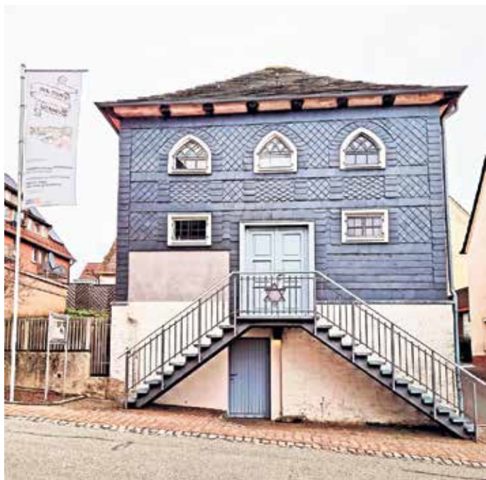
Die Synagoge Borgholz wurde 1838 erbaut und gilt als herausragendes historisches Gebäude dieser Art in NRW.

lung jüdischer Gemeinden seit dem 19. Jahrhundert nach: von einer Blütezeit mit starker Verankerung im gesellschaftlichen Leben über Abwanderung und Assimilation bis zum Bruch ab 1933. Boykotte, Auswanderung und schließlich Deportationen ab 1941 führten zur fast vollständigen Vernichtung jüdischen Lebens in der Region. Aus dem Kreis Höxter wurden den Angaben zufolge über 263 Menschen deportiert; nur etwa 20 kehrten zurück.