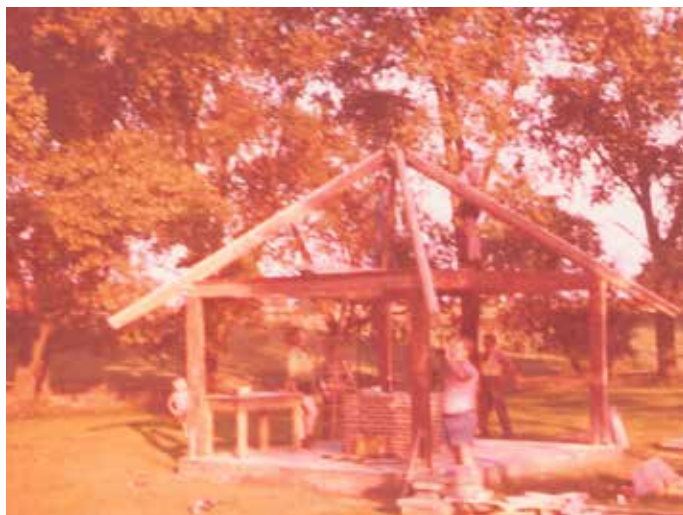
Hier wird das Zusatzgebäude der Grillhütte errichtet.