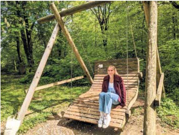
Auf der großen Sonnenschaukel lässt es sich wunderbar entspannen.