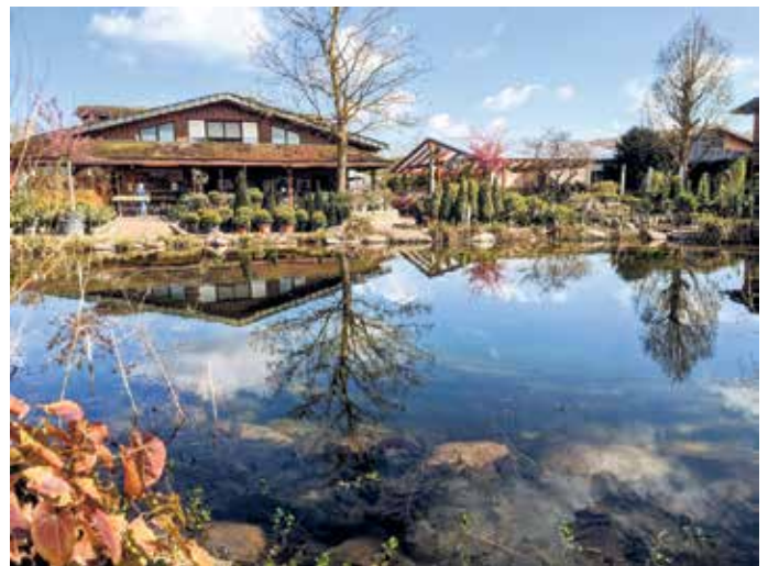
Das 3,5 Hektar große Firmenareal in der Keggenriede 9a ist wie eine großer Landschaftspark.

Borgentreich. Das Firmengelände der Borgentreicher Grünbau in der Keggenriede 9a ist ein mehr als drei Hektar großer Landschaftspark mitten im Gewerbegebiet der Orgelstadt. "Man darf auch gerne einfach nur ein bisschen flanieren und sich von unseren großen Pflanzenauswahl inspirieren lassen", sagt Betriebsgründer und Gärtnermeister Thorsten Koch. Die Auswahl auf dem 3,5 Hektar großen Firmengelände in Borgentreich ist riesig.