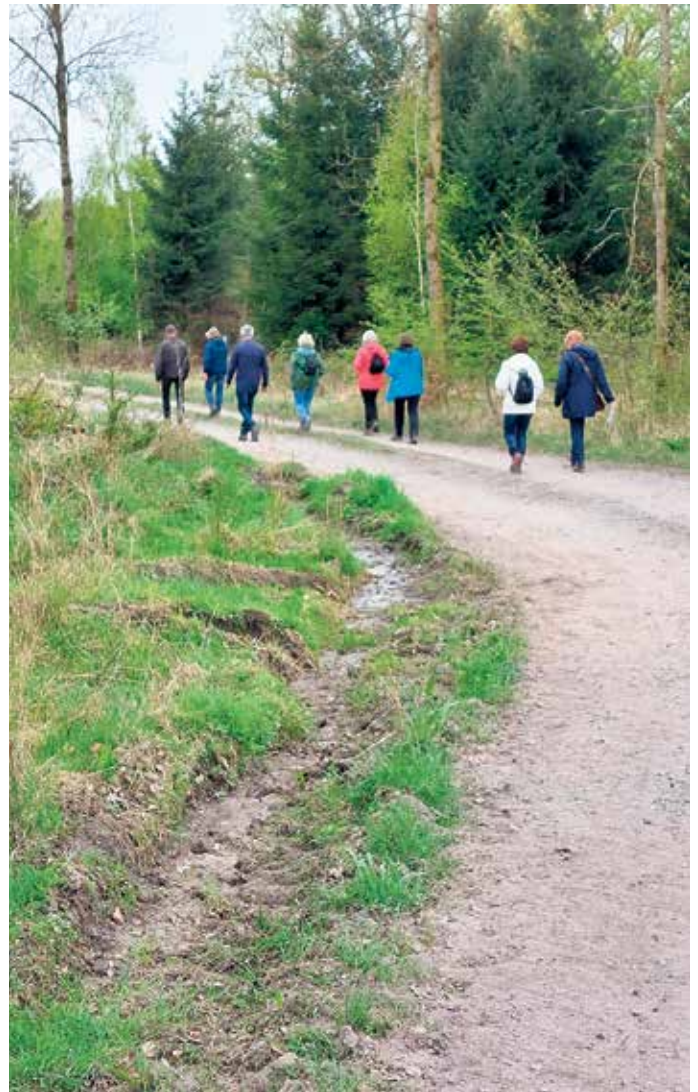
Pilgernd den Pastoralen Raum Börde-Egge erkunden.