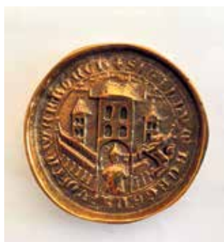
Stadtwappen von Warburg mit Humborg-Pferd