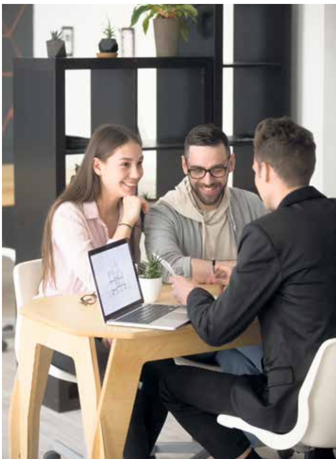
Unabhängige Beratung im Vorfeld eines Eigenheimprojekts gibt mehr Sicherheit bei der Finanzplanung und der Entscheidung für den richtigen Baupartner.

Stange betont: „Bauherren stehen zwar vor komplexen Aufgaben, aber sie müssen sie nicht allein bewältigen. Wer sich frühzeitig informiert und fachliche Unterstützung nutzt, reduziert Risiken und kann sein Vorhaben deutlich entspannter begleiten.“ (DJD).