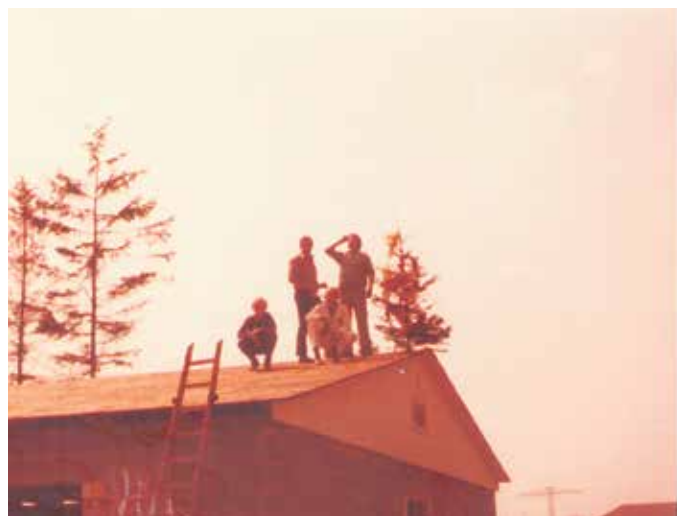
Es wird Richtfest gefeiert.