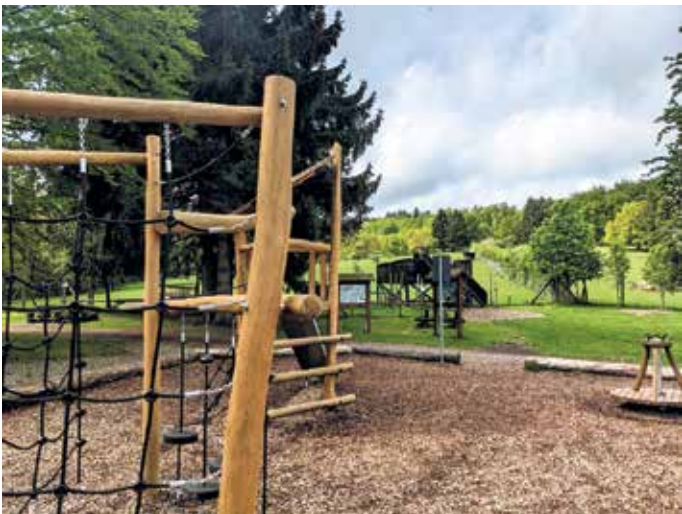
Ein zeitgemäßer Spielplatz trägt seit zwei Jahren zur Attraktivität des Willebadessener Wildgeheges bei.