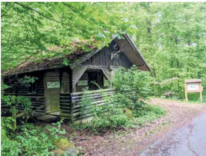
Die historische Jägerhütte im Wildgehege Willebadessen ist jeden Freitag Anlaufstelle für den Kindergarten.