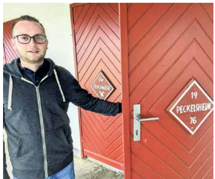
1976 hat die Löschgruppe Peckelsheim die Hütte in Eigenleistung gebaut. So steht es auch auf der Eingangstür.