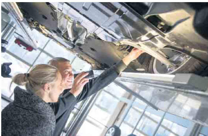
Nach einer gründlichen Fahrzeuginspektion ist das Auto gut gerüstet für eine lange Urlaubsreise.

So wird das Auto urlaubsfit für die Sommerreise