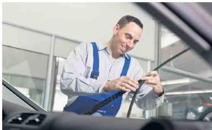
Auch Kleinigkeiten werden beim Urlaubs-Check in der Kfz-Werkstatt geprüft - zum Beispiel Wischerblätter oder Flüssigkeitsstände.

Kühlwasser, Motoröl und Scheibenwaschwasser werden vor Reiseantritt voll aufgefüllt. Wenn während der Reise ein Ölwechsel fällig werden würde, sollte man ihn besser vorziehen. Eine Dose Öl und eine Flasche Kühlwasser im Gepäck ersparen die Suche nach einer Tank-