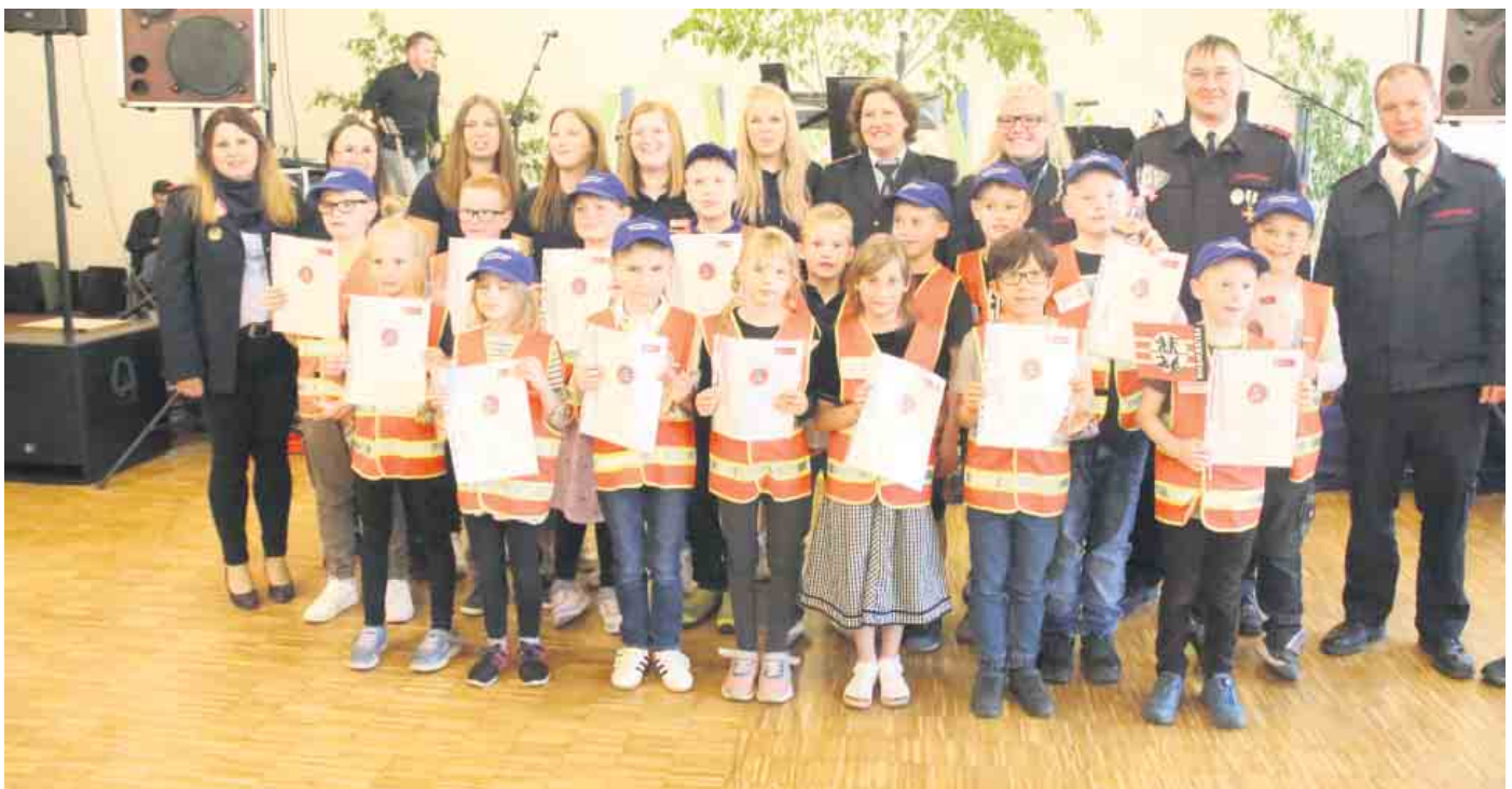
16 Kinder der neu gegründeten Kinderfeuerwehr erhalten ihre erste Auszeichnung.