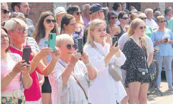
Hunderte Schaulustige säumen die Straßen.