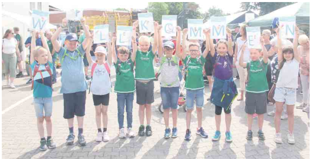
Das halbe Dorf ist beim Empfang der Bewertungskommission dabei.