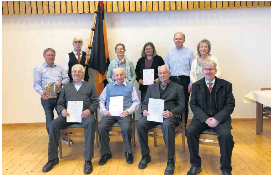
Der Vorstand der Kolpingsfamilie Borgentreich mit den geehrten Mitgliedern.

Als Geschenk für seinen runden Geburtstag gab es von Kolpingsfamilie eine alte Bibel und anschließend brachten sie ihm noch ein Geburtstagsständchen. Weiterhin wurden Aktivitäten für die kommenden Monate besprochen. So fährt die Kolpingsfamilie auch in diesem Jahr wieder zur Freilichtbühne Bökendorf. Am Mittwoch, 5. Juli, zum Kinderstück „Die Unendliche Geschichte“ im Rahmen