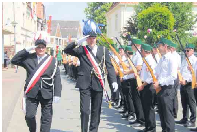
Peckelsheim feiert ein prachtvolles Schützenfest.

Festumzugs führte von der Langen Torstraße über den Busbahnhof, Helmernsche Straße, Lützer Straße und Lange Torstraße zum Sportplatz. Dort fand der Vorbeimarsch des Hofstaats am Schützenbataillon und der Parade-marsch statt. In der Schützenhalle gab es in diesem Jahr am Sonntag ab 15.30 Uhr erstmals ein Kuchenbuffet und Kaffee. Nach dem Einzug in die Halle ging es