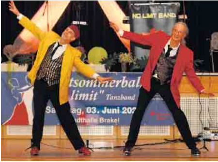
2 tap brothers aus Schloss Holte Stuckenbrok - 2 Stepp tänzer, 4 Füße, eine Passion - Rhythm Tap.