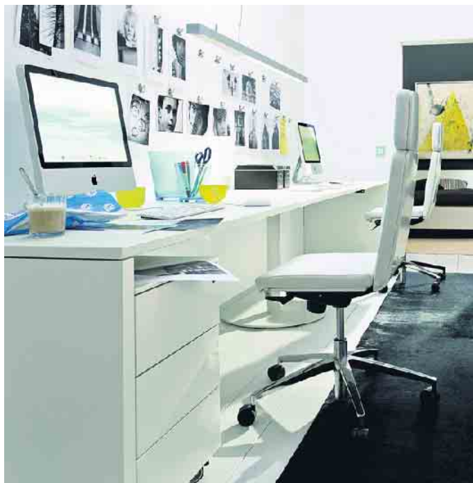
Rückenfreundliches Arbeiten bringt im Homeoffice und im Büro mehrere Anforderungen bei der Möbelauswahl mit sich.

Ergonomie bedeutet die Optimierung von Arbeitsbedingungen und -abläufen. Das stetige Verbessern der Benutzerfreundlichkeit eines Arbeitsplatzes und Fördern der Gesundheit einer Arbeitskraft sind wichtige Teilbereiche der Ergonomie. Möbel wie Schreibtische und Schreibtischstühle mit dem RAL-Gütezeichen „Goldenes M“ sind unter vielen Gesichtspunkten qualitätsgeprüft - auch unter ergonomischen. Seit 1963 verpflichten sich Möbelhersteller und Zulieferbetriebe, die der DGM angehören, freiwillig zur Einhaltung der Güte- und Prüfbestimmungen RAL-GZ 430. Diese bilden die Grundlage für das „Goldene M“ und garantieren dem Nutzer von zertifizierten Möbeln deren Langlebigkeit und einwandfreie Funktion, sowie Sicherheit, Gesundheit und Umwelt-