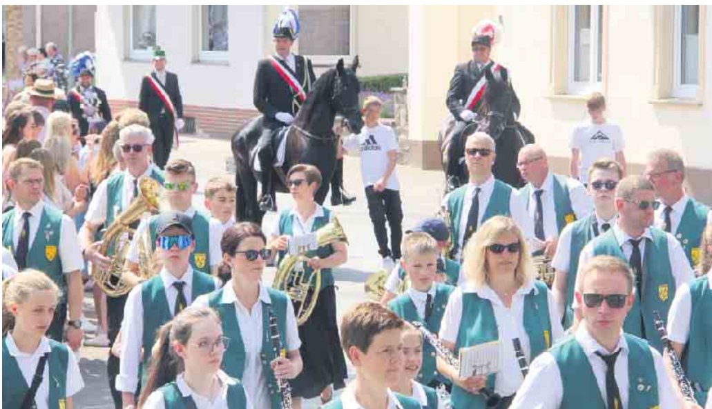
Der Oberst begleitet den Umzug hoch zu Ross.