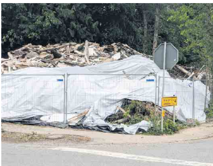
Im November war die alte Apotheke abgerissen worden. Der Schutt wird demnächst beseitigt.

stand hat. „Mit der Ausrufung eines Sanierungsgebietes haben wir genau den richtigen Schritt eingeleitet“, zeigt sich Bürgermeister Norbert Hofnagel zufrieden.