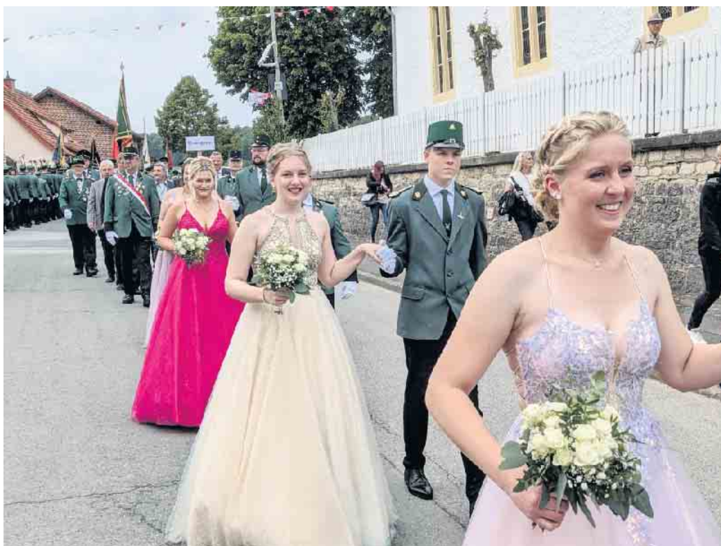
Ein glanzvoller Hofstaat aus sechs Paaren begleitet das Königspaar.