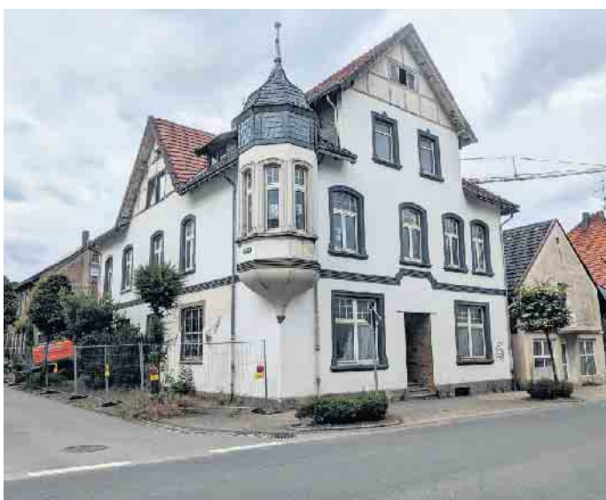
Der einstmals prachtvolle Gasthof Kloid