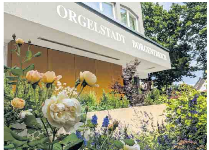
Das Rathaus der Orgelstadt Borgentreich.

Online Familien-Anzeigen: für alles was wirklich zählt! shop.rautenberg.media