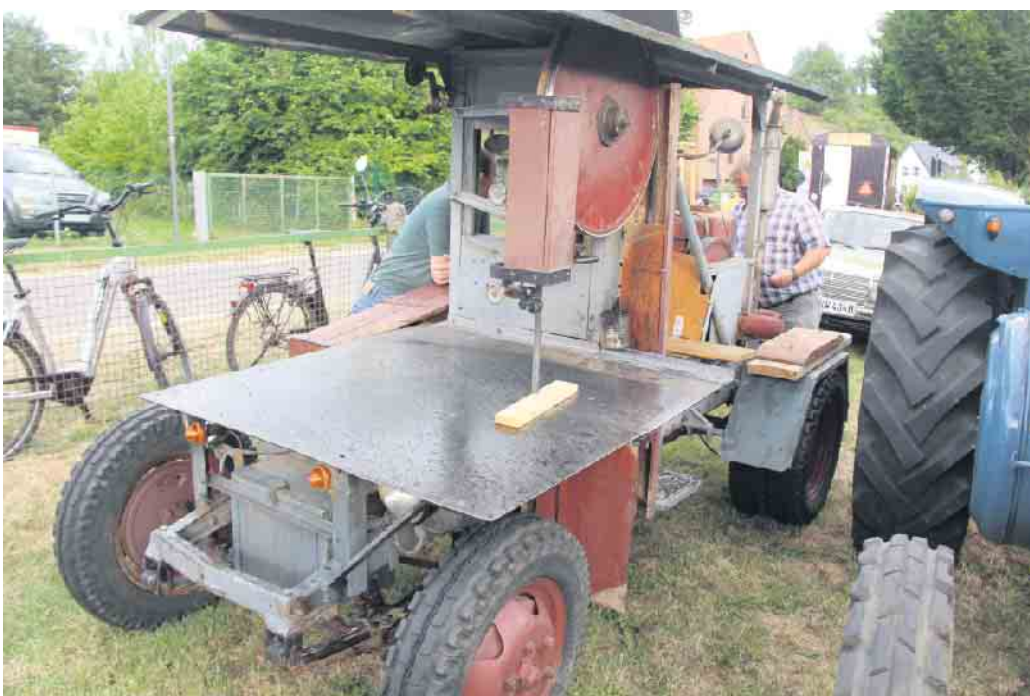
Die mobile Bandsäge von 1948 ist ein seltenes und von den Besuchern viel beachtetes Objekt.