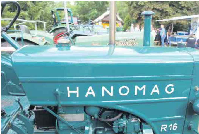
Rund 50 Traktoren präsentieren sich den Besuchern beim Treffen in Körbecke.