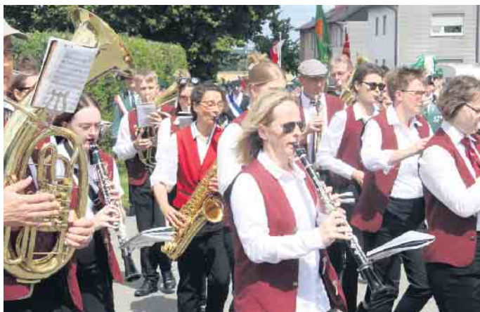
Der Löwener Musikverein ist unverzichtbar für das Fest.