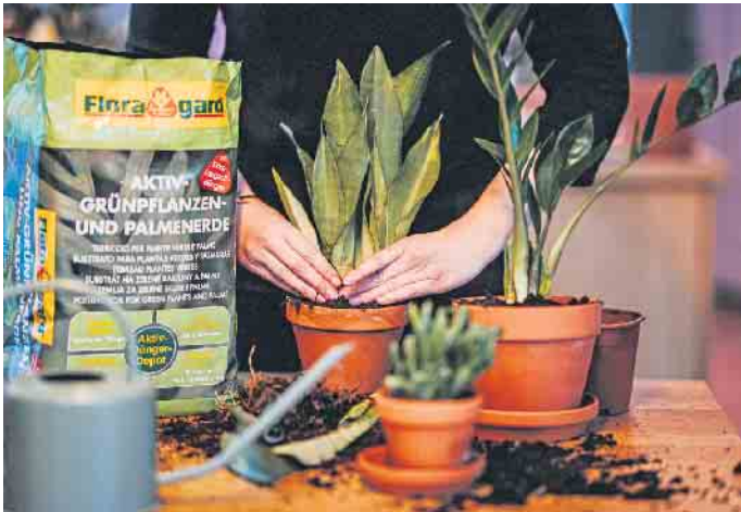
Praktisch sind Erden mit Langzeitdünger, sodass für bis zu drei Monate nicht nachgedüngt werden muss.

blatt eher schattig, mit stets leicht feuchter Pflanzenerde mag, bevorzugt der Bogenhanf eher helle und sonnige Plätze. Zu den pflegeleichten Pflanzen, die quasi eine Wachstumsgarantie aufweisen, gehören ebenso Klassiker wie die kräftig rankende Efeutute oder der Gummibaum. Wichtig ist in jedem Fall eine gute, lockere Erde, damit die Wurzeln dauerhaft Luft bekommen. Gleichzeitig sollte die Erde genügend Wasser speichern oder nach Austrocknung das Wasser gut aufnehmen können. Praktisch sind Produkte wie die Floragard Aktiv Grünpflanzen- und