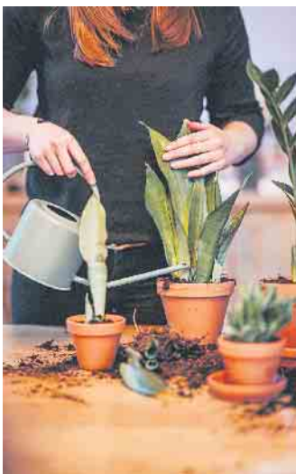
Beim Neupflanzen oder Umtopfen machen es sich Pflanzenfreunde mit hochwertigen Erden einfacher. Damit erhält das Grün direkt die richtigen Nährstoffe.

bis drei Jahre umtopfen - oder spätestens dann, wenn der Topf zu klein wird. Auch dabei empfiehlt es sich, eine hochwertige, frische Pflanzenerde zu verwenden. Die Blütezeit hingegen sollte man für ein Umtopfen vermeiden, da die Pflanzen dann die volle Kraft für ihr Wachstum benötigen. (DJD)