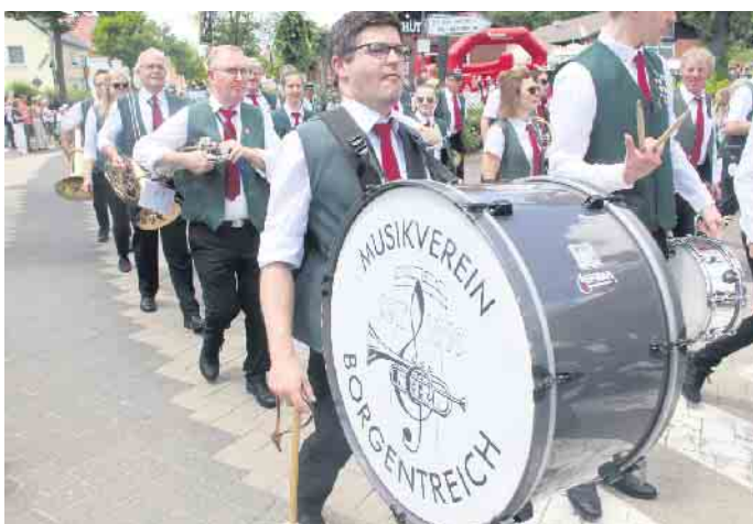
Acht Musikzüge begleiten den imposanten Festumzug.