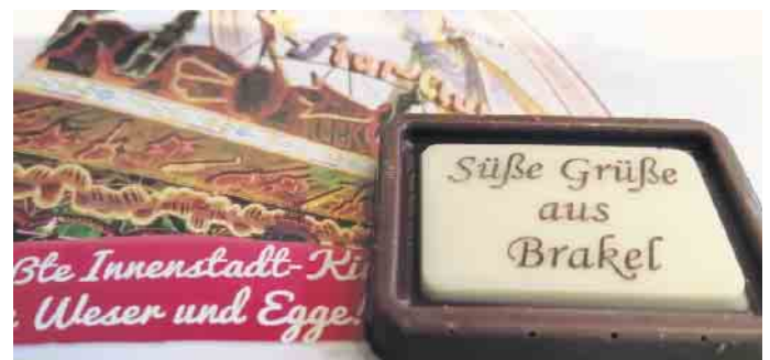
Der Annentag hat auf der ganzen Welt Freunde.