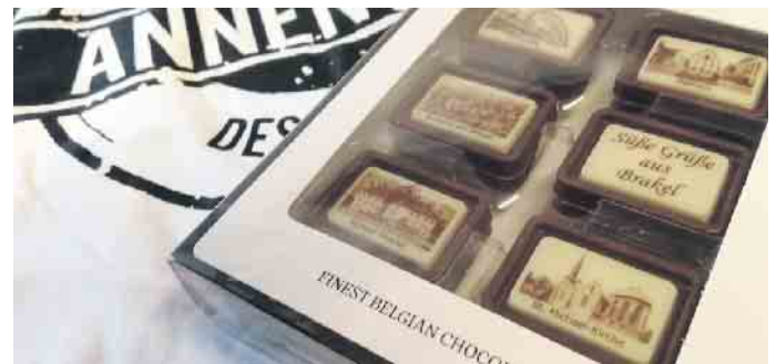
Auch in diesem Jahr gibt es wieder den Annen-Euro, mit dem Extra-Rabatt auf der Kirmes.