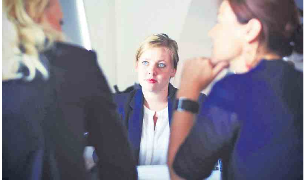
Mit gezielten Fragen können Bewerber im Vorstellungsgespräch ihr Interesse an einem Job untermauern.

Geld ist zwar wichtig, aber längst nicht mehr der alleinentscheidende Faktor bei der Jobwahl. Eine aktuelle Umfrage des Personaldienstleisters Adecco zeigt, dass für Arbeitnehmer nach dem Gehalt (53 Prozent der Befragten) vor allem die Arbeitsatmosphäre (36 Prozent) und Karrierechancen (25 Prozent) eine bedeutende Rolle spielen. Mit den richtigen Fragen lässt sich daher bereits im Vorstellungsgespräch klären, ob eine potenzielle Stelle den persönlichen Vorstellungen entspricht und zu den Fähigkeiten passt. Dazu gehört es, sich schon im Vorfeld der eigenen Stärken und Wünsche an die berufliche