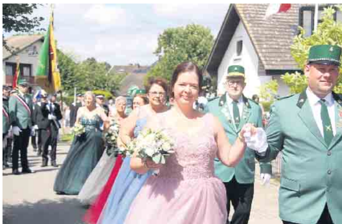
Zehn Hofstaatpaare begleiten den prächtigen Festumzug.