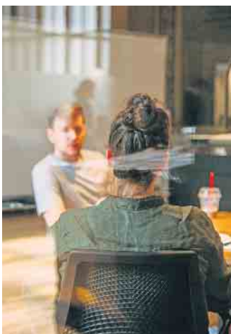
Dialog statt Monolog: Bei Vorstellungsgesprächen sollten auch Bewerber aktiv Fragen stellen.

ge sollten Bewerber am Ende des Gesprächs keinesfalls vergessen: „Wann kann ich damit rechnen, wieder von ihnen zu hören?“ (djd)