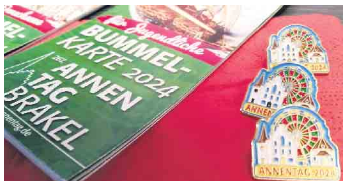
Die Annentags-Kirmes ist ein großes Freizeitvergnügen.