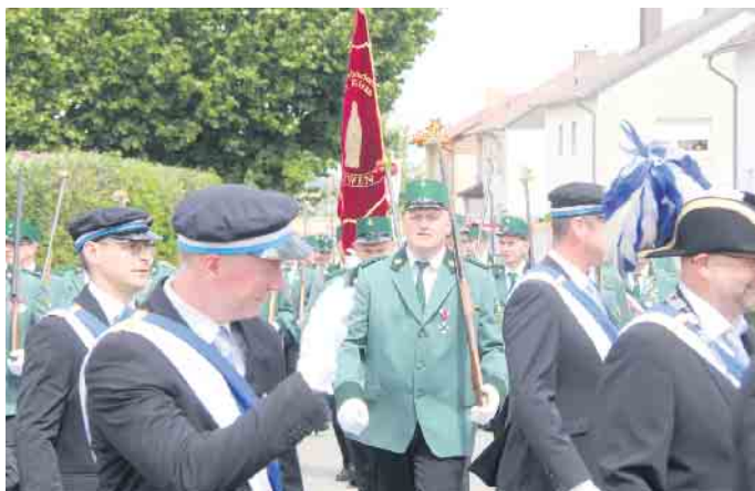
Eine Fahnenabordnung aus Menne begleitet die Löwener Kiliansschützen.