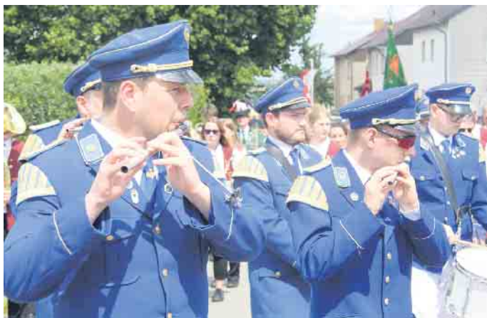
Auch das Tambourkorps aus Kleinenberg ist mit von der Partie.