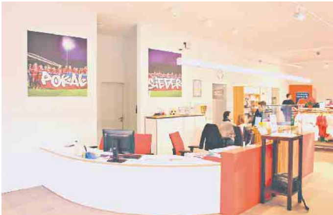
Vor dem Stadion des 1. FC Heidenheim hat Lehner Haus ein Vereinslokal und die Geschäftsstelle mit Fanshop des Zweitligisten gebaut.

Fertighaushersteller bauen mehr als nur Eigenheime