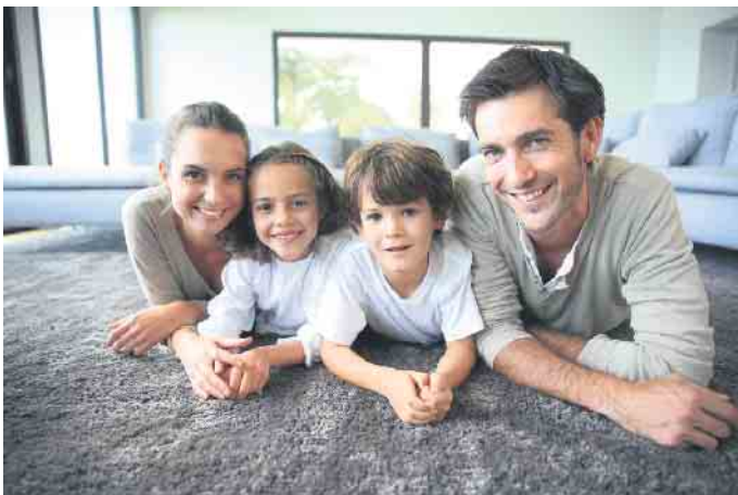
Dank moderner Wohnraumlüftung mit Wärmerückgewinnung fühlt sich die Familie bei gutem Raumklima wohl - und schont zusätzlich ihren Geldbeutel.

Gebäudes und hebt den Wiederverkaufswert. Gerade in Neubauten oder bei der energetischen Sanierung, wenn die Gebäudehülle fast luftdicht ist, spielt die Lüftungstechnik ihre Vorteile aus. (djd)