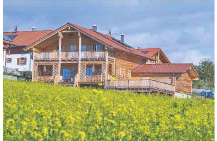
Privathäuser, Hotels und vieles mehr wird heute immer öfter in Holz-Fertigbauweise errichtet.

„Wer bauen möchte, ist heute weniger auf eine bestimmte Bauweise festgelegt als früher und fußt seine Entscheidung umso mehr auf guten Argumenten“, sagt Achim Hannott, Geschäftsführer des Bundesverbandes Deutscher Fertigbau (BDF). Die Argumente der Fertigbaubranche kommen nicht nur bei privaten, sondern auch bei gewerblichen Bauherren immer besser an. Der Fertigbaugedanke ist schon viele hundert Jahre alt. Einer der ersten, der ihn hegte