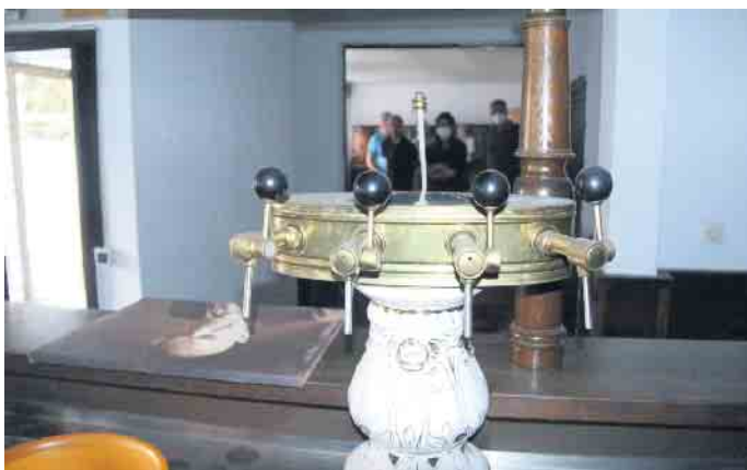
Aus dem Zapfhahn fließt schon lange kein Bier mehr.