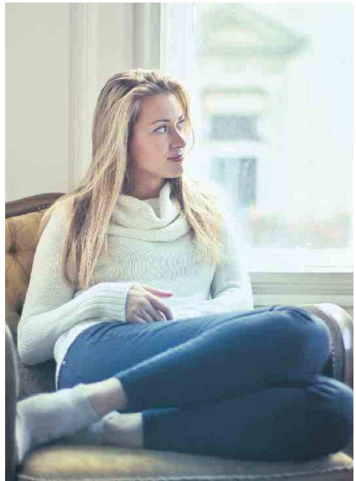
Lüftungssysteme mit Wärmerückgewinnung regeln automatisch den notwendigen Luftaustausch, wärmen die Frischluft vor und sparen Heizkosten.