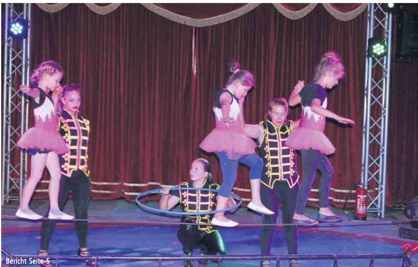
Bericht Seite 5