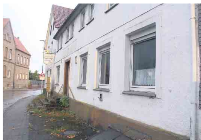
Der ehemalige Dorfkrug in Natzungen ist ein marodes Gebäude in zentraler Ortslage.