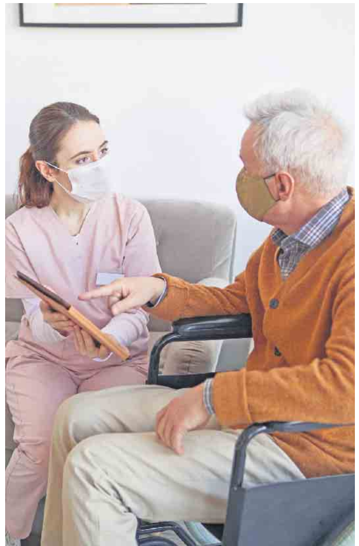
Oftmals kann der Pflegebedürftige in seiner gewohnten Umgebung bleiben und ambulant betreut werden.