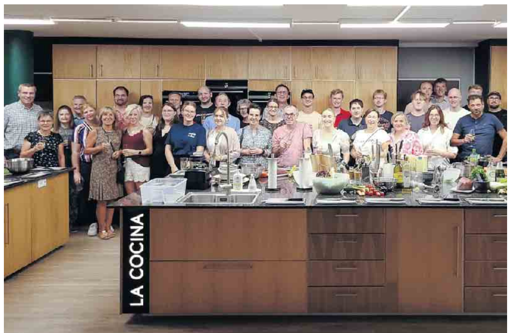
Das 30-jährige Firmenjubiläum feierte die UKL iT & Logistik kürzlich an einem Wochenende in Hamburg u.a. mit einem tollen Kochevent, das Foto zeigt den größten Teil des Teams.