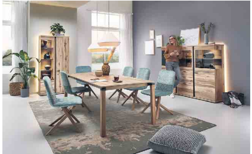
Zeitlos schöne Qualitätsmöbel bereiten ihren Besitzern lange Freude.

Klimafreundliches Handeln und die Entscheidung für klimafreundlich hergestellte Produkte spielen für immer mehr Menschen eine wichtige Rolle. „Beim Möbelkauf heute schon an die Zukunft zu denken, bezieht den Klimawandel und die Zukunft der Umwelt mit ein. Daher bereiten klima- und umweltfreundlich hergestellte Möbel ihren Besitzern umso länger Freude und ein gutes Klima-Gewissen“, sagt Jochen Winning und empfiehlt beim Möbelkauf auf die neuen RAL Gütezeichen „Möbel Klimaneutral“ und „Möbelherstellung Klimaneutral“ zu achten.