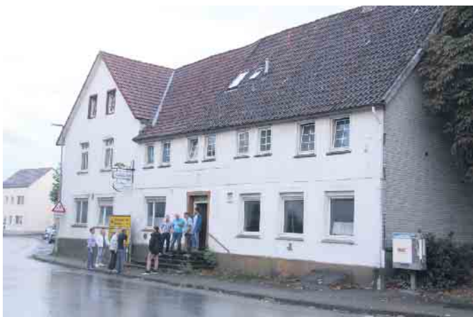
Die Ortspolitiker der Orgelstadt machen sich ein Bild von der Liegenschaft.

„Jetzt sollen erst mal die Ratsfraktionen in Ruhe Vorschläge entwickeln und zu gegebener Zeit werden wir dann darüber beraten.“ Wichtig sei, dass das Areal in städtisches Eigentum übergegangen sei und die Orgelstadt damit die weitere Entwicklung komplett in der Hand habe.