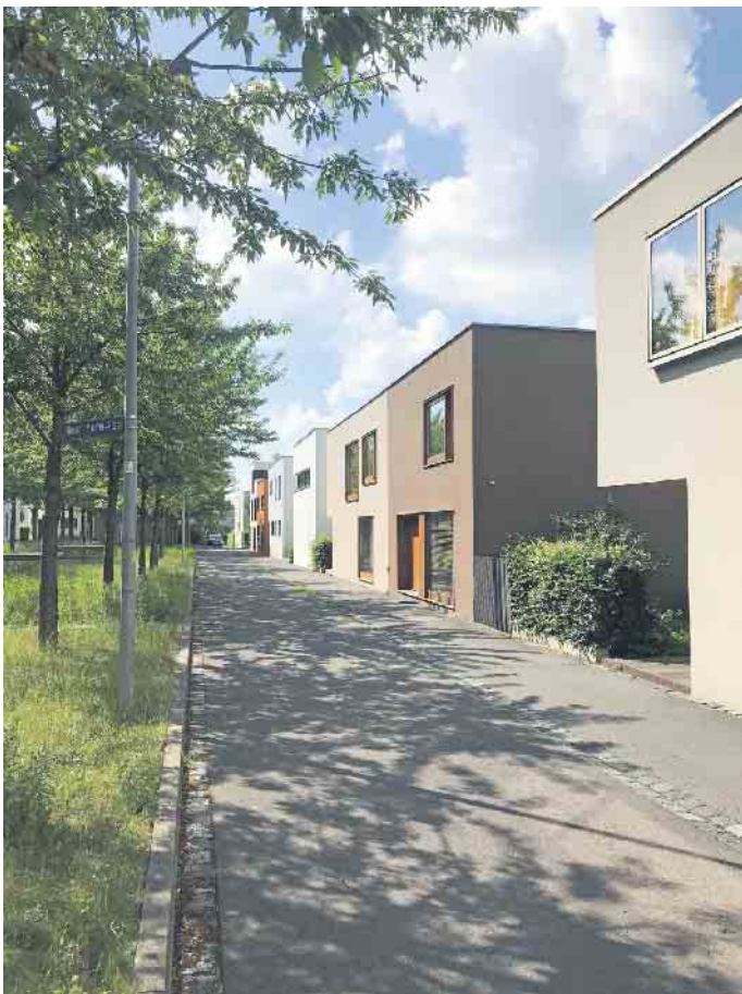
Die farbige Vielfalt von Putz bringt eine lebendige Atmosphäre in jede Wohnsiedlung.