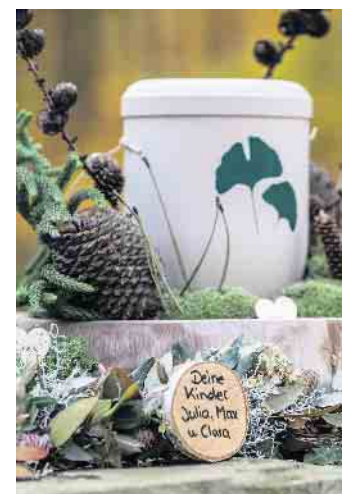
Die Asche der Verstorbenen ruht in einer biologisch abbaubaren Urne.

in das soziale Netz eingebunden? In einem Bestattungswald bleiben die unterschiedliche Bewertung der Gräber und der damit verbundene Stress durch das Grab schmuck-Verbot aus. So entfällt auch der Druck auf Angehörige. Die Gleichheit in der Grabgestaltung führt aber nicht dazu, dass man keine Individualität erlebt - im Gegenteil. Jedes Baumgrab ist von Natur aus anders. Und auch die Beisetzungen und Gedenk-möglichkeiten können ganz persönlich geprägt werden. (DJD)