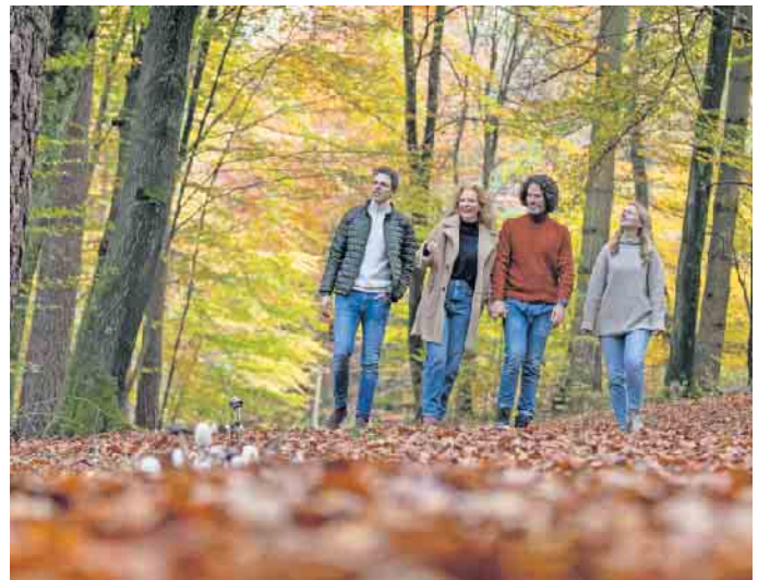
Wenn Angehörige das Baumgrab im Wald besuchen, geht es meistens nicht besonders förmlich zu.

Bei den Wald-Beisetzungen ruht die Asche von Verstorbenen in biologisch abbaubaren Urnen unter einem Baum mitten im Bestattungswald. Eine dezente Namens- tafel macht auf die Grabstätte aufmerksam. Die Studie zeigt: Während Beisetzungen auf einem kirchlichen Friedhof oft als tradierte und ‚strenge‘ Trauerzeremonien erlebt werden, fühlen sich die Menschen im überkonfessionellen Bestattungswald freier und unbeobachtet. Die Weitläufigkeit der Natur bietet beispiels-