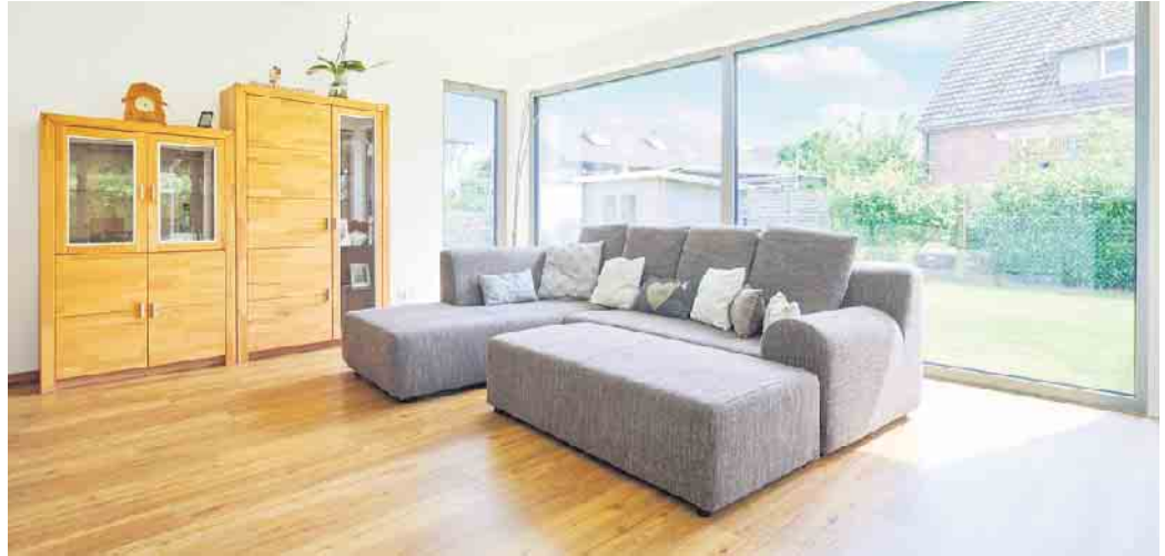
Aluminiumfenster sind bei großformatigen Panoramafenstern besonders beliebt.

Aluminiumrahmen werden wegen ihrer guten Statik sowie des robusten und doch leichten Materials besonders für große, moderne Fensterfronten gerne genutzt. Darüber hinaus sind sie sehr wartungsfreundlich. Dass Aluminiumfenster wegen ihres Materials besonders lange Wind und Wetter trotzen und in einer Vielzahl von Farben beschichtet und lackiert