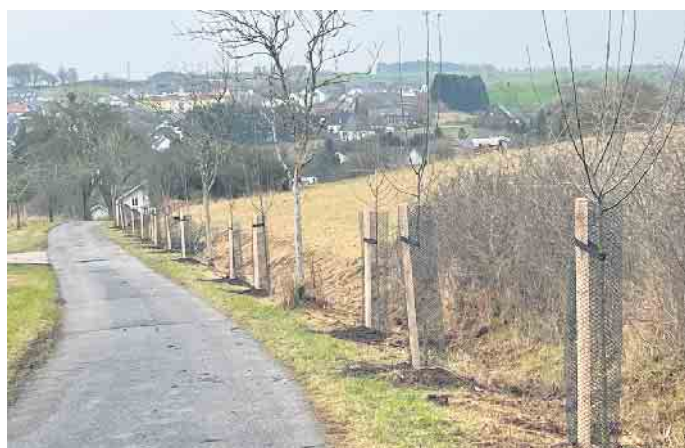
Ergänzungspflanzungen mit Obstbäumen am Dahlemer Ortsrand.

Insgesamt sind in diesem Jahr rund 50 neue Bäume in den Ortslagen der Gemeinde angepflanzt worden.