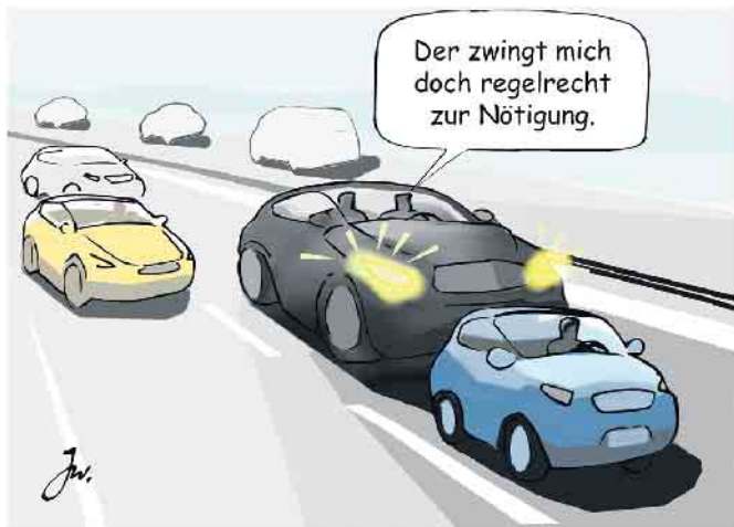
Falsche Reaktion auf Drängler: Demonstratives Langsamfahren auf dem linken Fahrstreifen trägt zur Eskalation bei.

ohne andere Autofahrer in Bedrängnis zu bringen. Ebenso gilt es zu vermeiden, die Bedrängnis, in die man durch den aufdringlichen Hintermann gebracht wird, an das vorausfahrende Fahrzeug weiterzugeben, indem man sich diesem zu sehr nähert. Denn daraus können unliebsame Kettenreaktionen resultieren. Zur Vermeidung solcher Situationen ist es ebenfalls ratsam, bei einem eigenen Überholvorgang immer wieder - alle fünf bis zehn Sekunden raten die Fachleute - zu kontrollieren, dass man nicht ein schnelleres Fahrzeug hinter sich behindert. Manche Autofahrer begehen den Fehler, wenn ein Fahrzeug mit höherer Geschwindigkeit hinter ihnen auftaucht, dessen Fahrer zu provozieren, indem sie den Überholvorgang unnötig lang ausdehnen bei möglichst geringem Tempo. Diese Verkehrsteilnehmer sollten erstens das allgemeine Rechtsfahrgebot in Deutschland nicht vergessen und sich zweitens darüber klar sein, dass sie mit ihrem Verhalten dem Eskalieren einer solchen Situation Vorschub leisten können. (mid/ak-o)