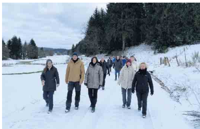
Auf der Wanderung durch ein winterliches Kylltal.