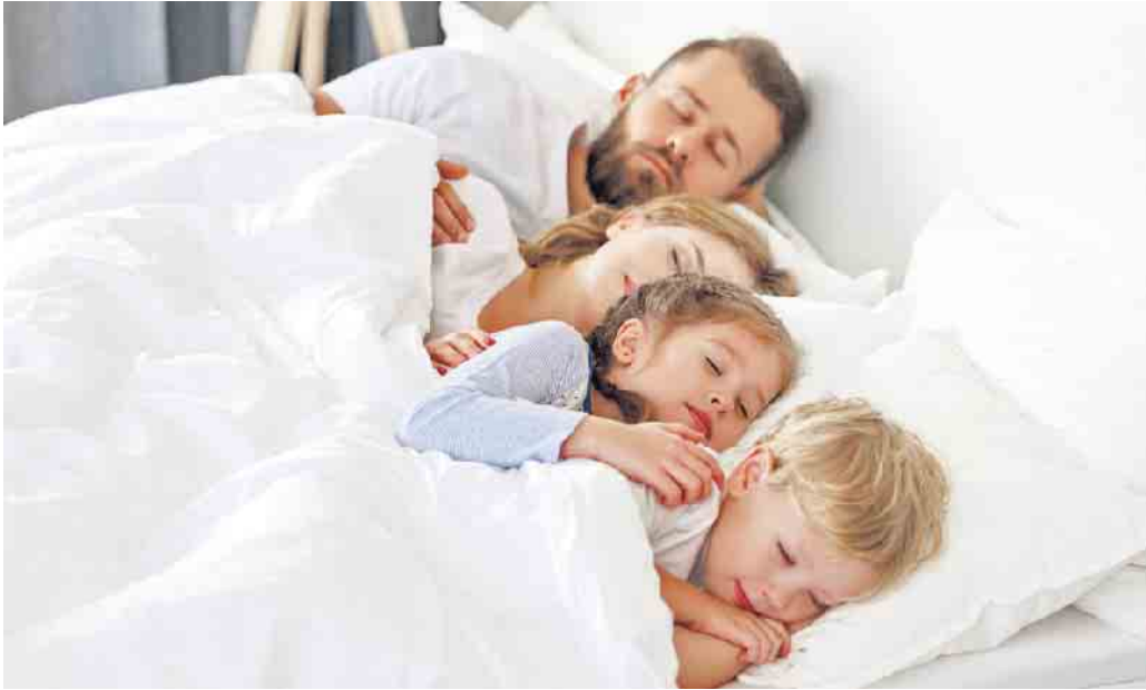
Gesund und in Ruhe wohnen: Mit Außenwänden aus Leichtbeton profitieren Familien von einem hohen Schallschutz.

Mit massivem Mauerwerk aus Leichtbeton störenden Lärm ausschließen