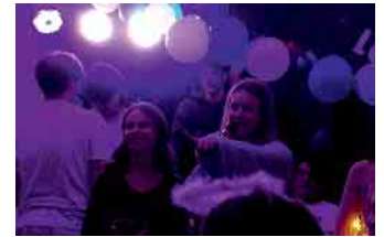
Die Moderatorinnen aus der Ephemie sind voll in ihrem Element.

Noch ein außerschulisches Highlight steht im Januar an: Der Besuch der Französischklassen 7-10 im Kino Hillesheim. Beim französischen Kinofestival Cinéfête sehen die Schüler:innen französische Filme im Original mit deutschen Untertiteln, die sonst nicht in deutschen Kinos laufen. Die Lateinschüler:innen nutzen den Tag, um das römische Erbe in der Region ganz real in Zülpich und Köln zu erleben.