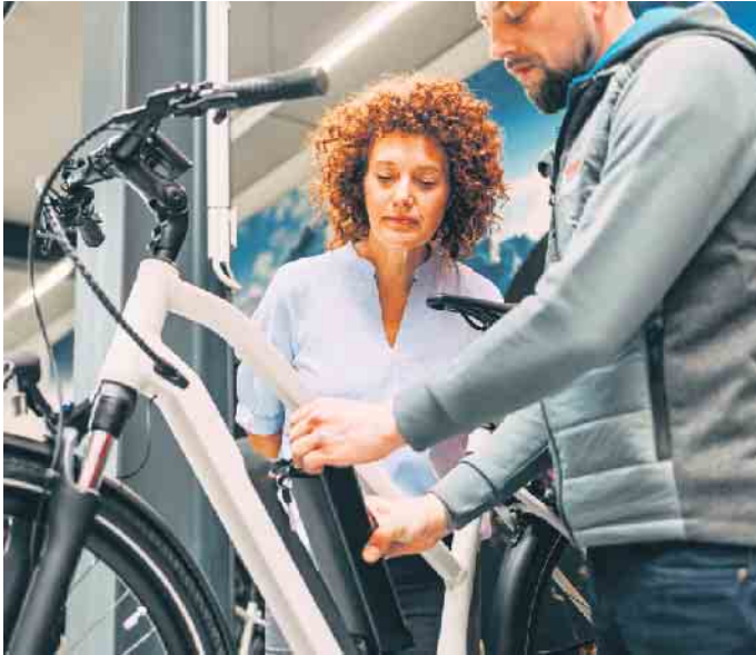
Vor der Winterpause sollte das E-Bike gründlich gewartet werden. Tipp: Den Akku abnehmen und separat an einem trockenen Ort ohne große Temperaturschwankungen lagern.

Tipps für die Wartung und die richtige Lagerung des Akkus