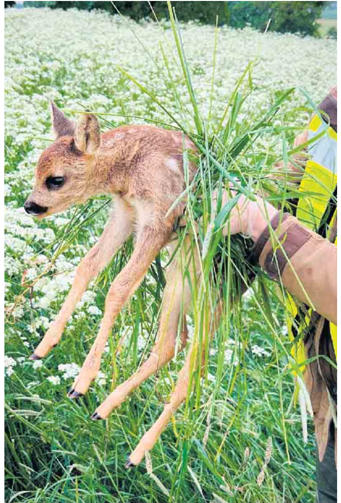
Rehkitzrettung Kreis Euskirchen e.V.