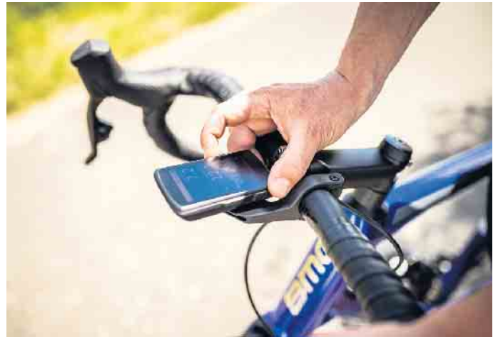
Mit zeitgemäßem Zubehör lassen sich auch ältere Räder gestiegenen Anforderungen anpassen.

der Straße empfiehlt sich aufgrund der guten Geländegängigkeit und Federung ein Mountainbike. Wer hingegen lange Strecken mit höherer Geschwindigkeit fahren möchte, sollte sich ein Rennrad zulegen. Es ist leicht und auch dank der sportlichen Sitzposition besonders aerodynamisch. Eine gute Mischung zwischen Sportlichkeit und Komfort bieten Trekkingräder, die sowohl im Alltag als auch auf Touren gute Dienste leisten. Doch manchmal muss es einfach praktisch sein. „Wer auf dem Weg zur Arbeit nicht aufs Rad verzichten will, setzt aufs Faltrad. Falträder sind platzsparend und können bequem in Bus, Bahn oder Auto transportiert werden - deshalb liegen sie wieder voll