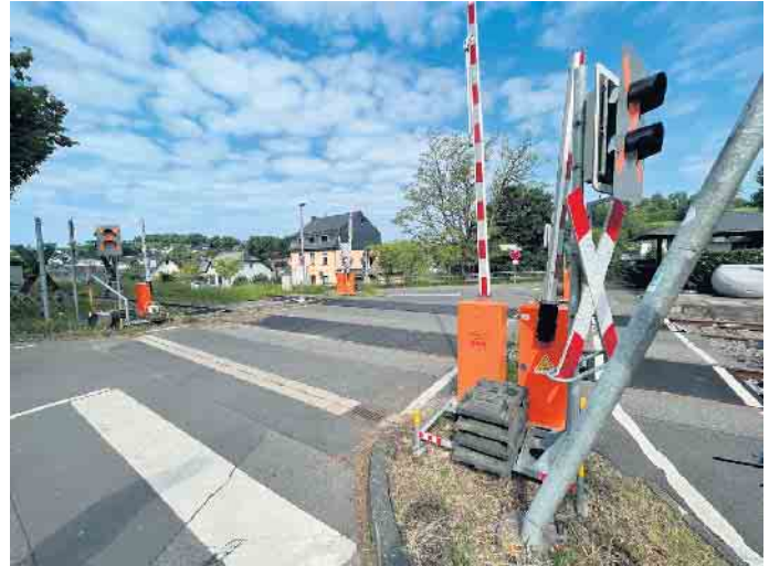
Am Bahnübergang in Dahlem sind die provisorischen Schranken- und Signalanlagen aufgestellt.

die Geschwindigkeit für die Straße auf 30km/h zu begrenzen. Es handelt sich um die drei folgenden Bahnübergänge: Dahlem I: Höhengleiche Kreuzung bei bahn-km 77,368 mit „Bahnstraße“ Dahlem II: Höhengleiche Kreuzung bei bahn-km 78,268 mit „Untermühle“ Dahlem III: Höhengleiche Kreuzung bei bahn-km 78,790 mit unbenanntem Weg (Abzweig von Untermühle) Der Neubau der Anlagen ist bereits vollständig geplant und ist für den Zeitraum Oktober 25 - März 26 vorgesehen, in dieser Zeit ist kein Bahnverkehr in diesem Streckenabschnitt vorgesehen, was ein sicheres und reibungsloses Arbeiten an den Anlagen ermöglicht.