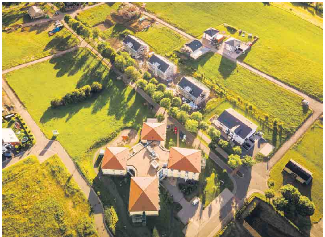
Die Einrichtungen für ältere Menschen in unserer Gemeinde: unterhalb der Allee das „Haus Marienhöhe“, darüber die 3 Gebäude Service-Wohnen und rechts die Caritas-Tagespflege.

Nach intensiven Akquisitionsbemühungen hat sich der Saarländische Schwesternverband 2019